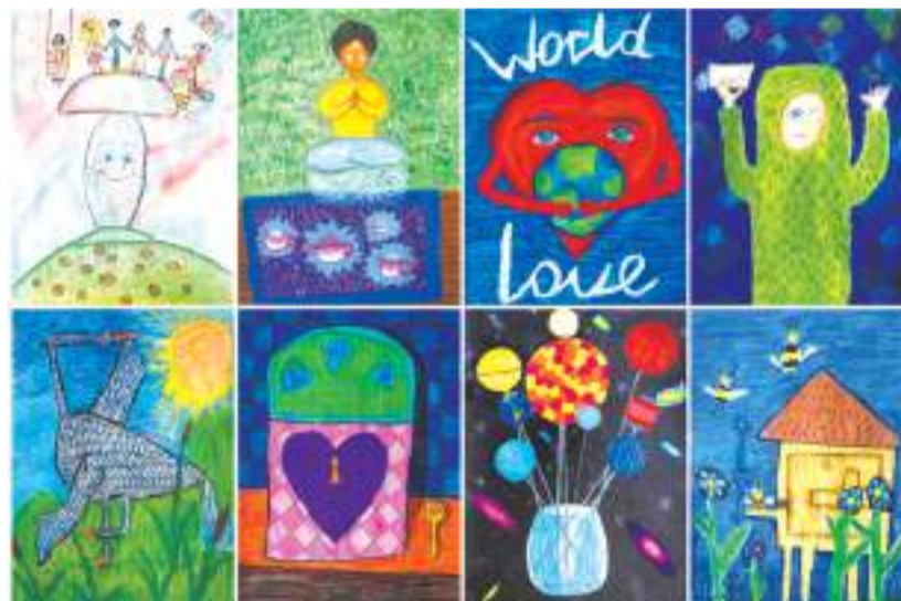
Коллаж из рисунков «Волшебной шляпы».

Творческая студия «Волшебная шляпа» из Реммаша отправила посылку с 56 детскими рисунками в Китай. Это ответный жест — в конце ноября прошлого года наши художники получили пакет с рисунками из Азии.