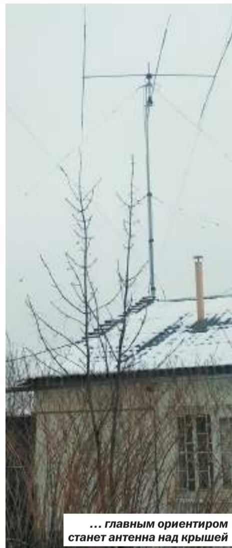
... главным ориентиром станет антенна над крышей