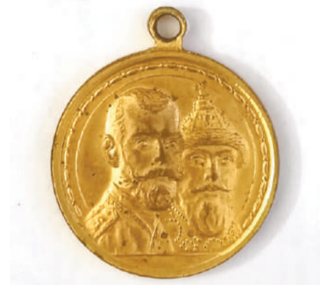
Бронзовая медаль, выпущенная в память 300-летия царствования Дома Романовых