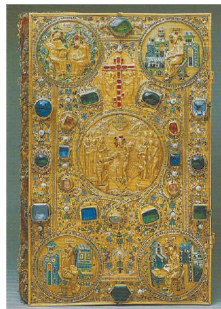
Напрестольное Евангелие в золотом окладе