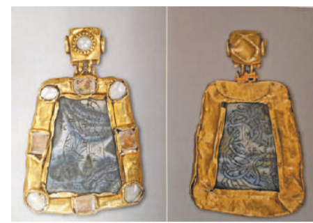
Яшмовая наперсная икона