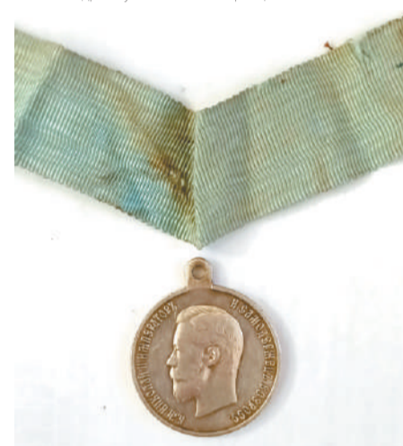
Серебряная медаль, отчеканенная на Санкт-Петербургском монетном дворе в память коронации императора Николая II