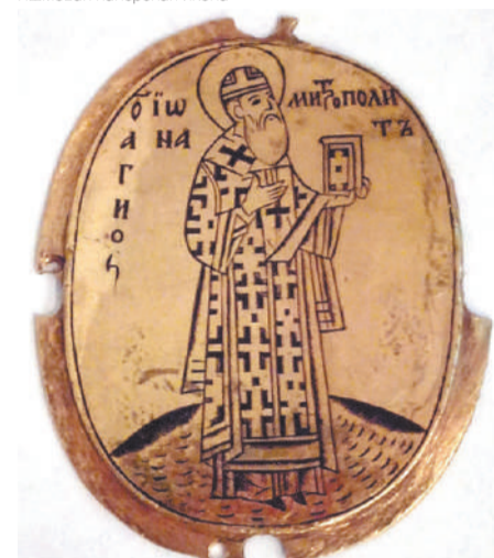
Овальная дробница — часть драгоценного оклада на икону письма Андрея Рублёва «Святая Троица»