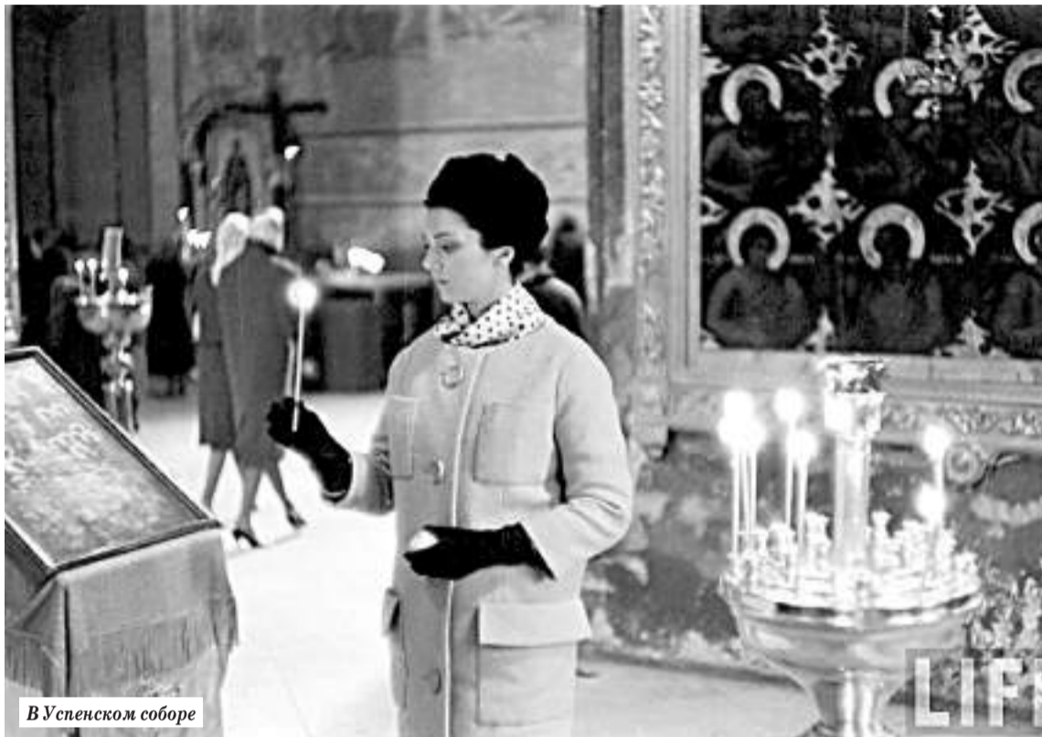
В Успенском соборе