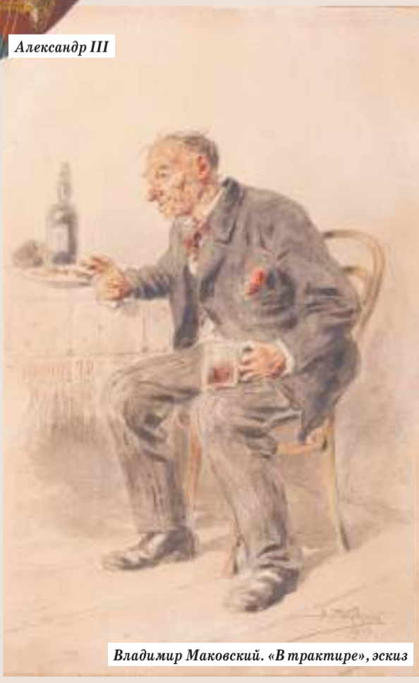
Владимир Маковский. «В трактире», эскиз

Поступок посадского мещанина можно, конечно, списать на пьянство. Но не показывает ли он снижение авторитета царской власти, ранее незыблемого? И ещё, в этой короткой истории поражает снисходительность царских властей к агрессивной выходке нашего земляка. Всего через 30-40 лет любой гражданин уже не царской России, а Страны Советов за подобные же слова в адрес не то чтобы высочайшей партийной особы, но любого руководителя, поплатился бы свободой, а то и жизнью.