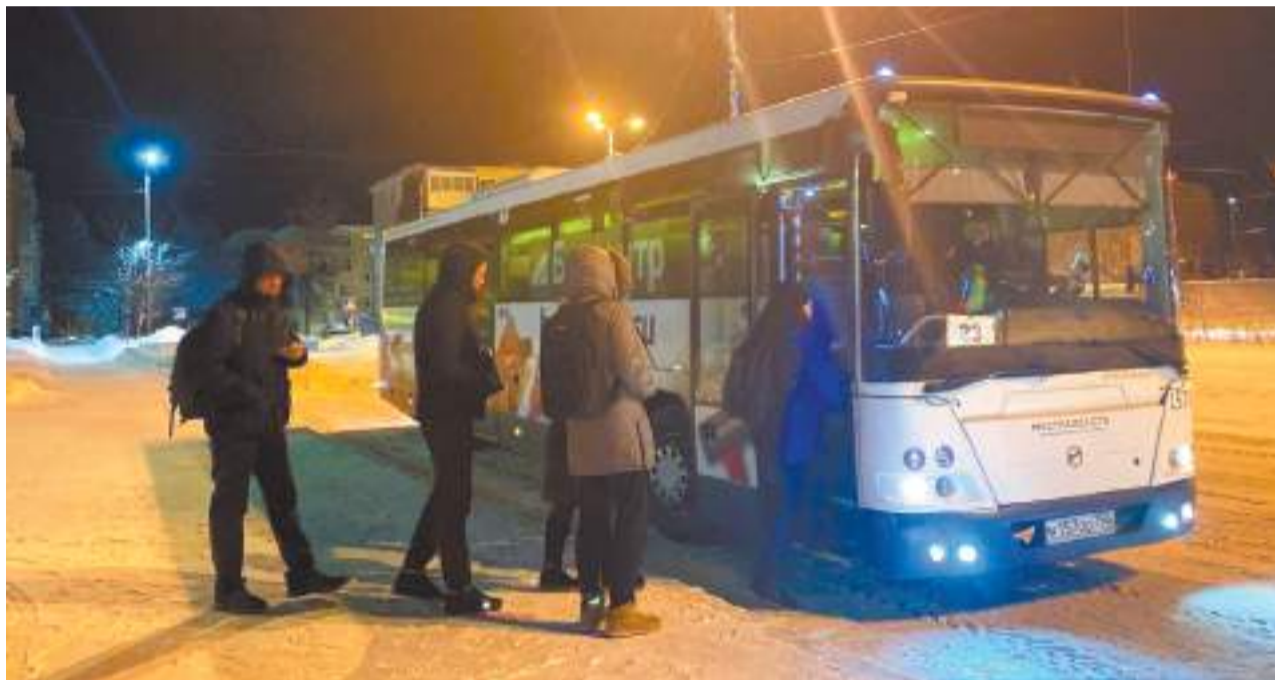
Теперь маршруты № 23, № 42 и № 49 переданы на обслуживание «Мострансавто»

С трёх пассажирских маршрутов ушёл частный перевозчик