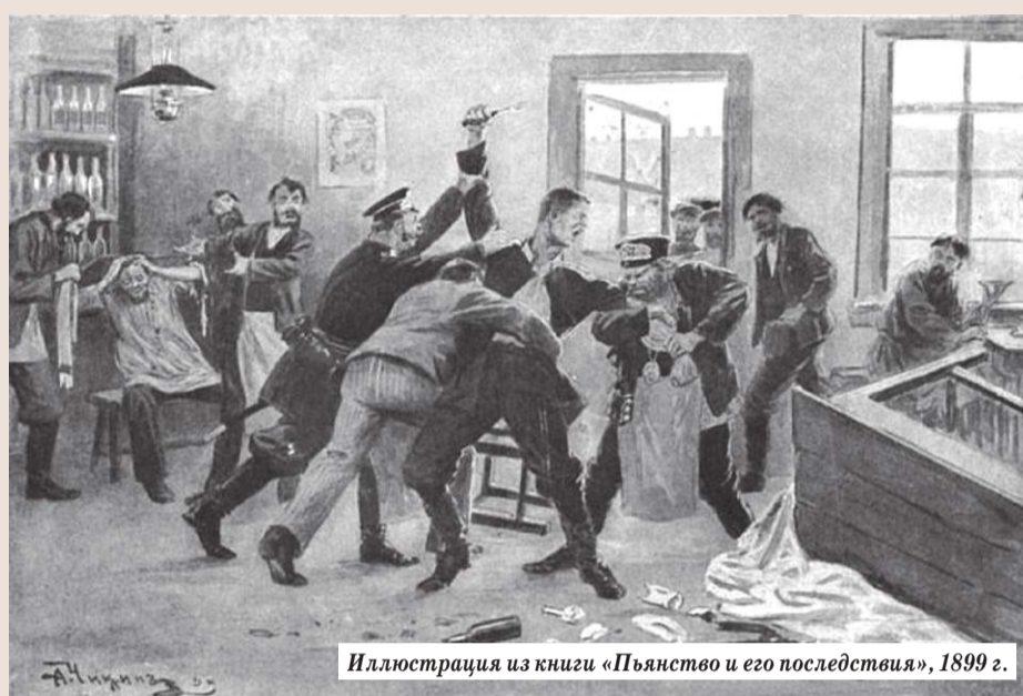
Иллюстрация из книги «Пьянство и его последствия», 1899 г.

◆ 12 (25) января 1917 года (105 лет назад) Комитет Всероссийского Союза городов направил запрос властям Посада: желательны ли открытие курсов для увечных воинов и какой специальности? Созданная Комиссия выяснила, что «в Сергиевском посаде имеется нужда в ремёслах: шорном, экипажном, кузнечном, сапожном, шапочном и бондарном. Эти ремёсла всегда приносили затруднение в приобретении предметов, изготовленных этими мастерскими, а в настоящее время в особенности, за поступлением такого рода мастеров на военную службу, что невыгодно отражается на благосостоянии потребителей». Постановили: желательны открытие курсов по ремёслам: шорному, экипажному, шапочному и бондарному.