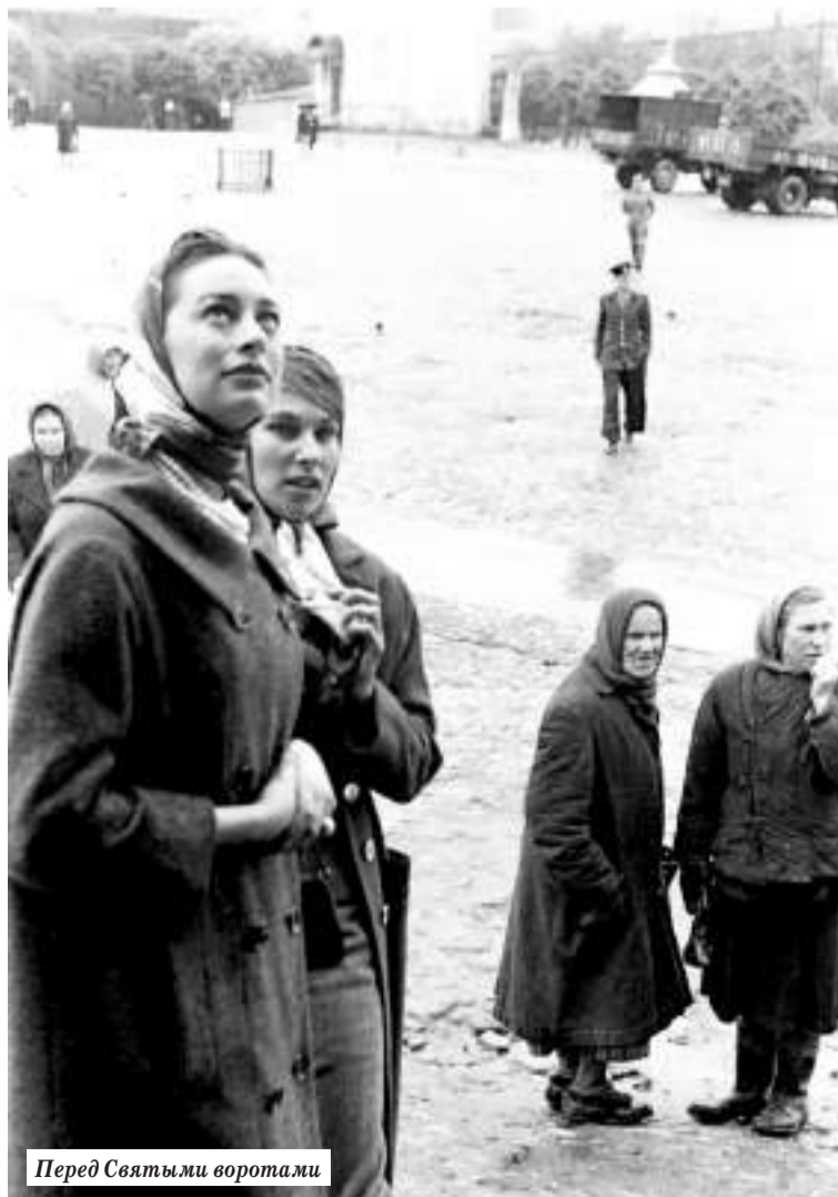
Перед Святыми воротами

Поездка была тщательно срежиссирована ещё во Франции. Кроме 14 показов в столице предусматривались фотосессии на улицах города. Снимал происходящие события знаменитый Говард Сочурек из американского журнала «Лайф», который не раз бывал в СССР и проехал с фотоаппаратом от Крыма до Якутска.