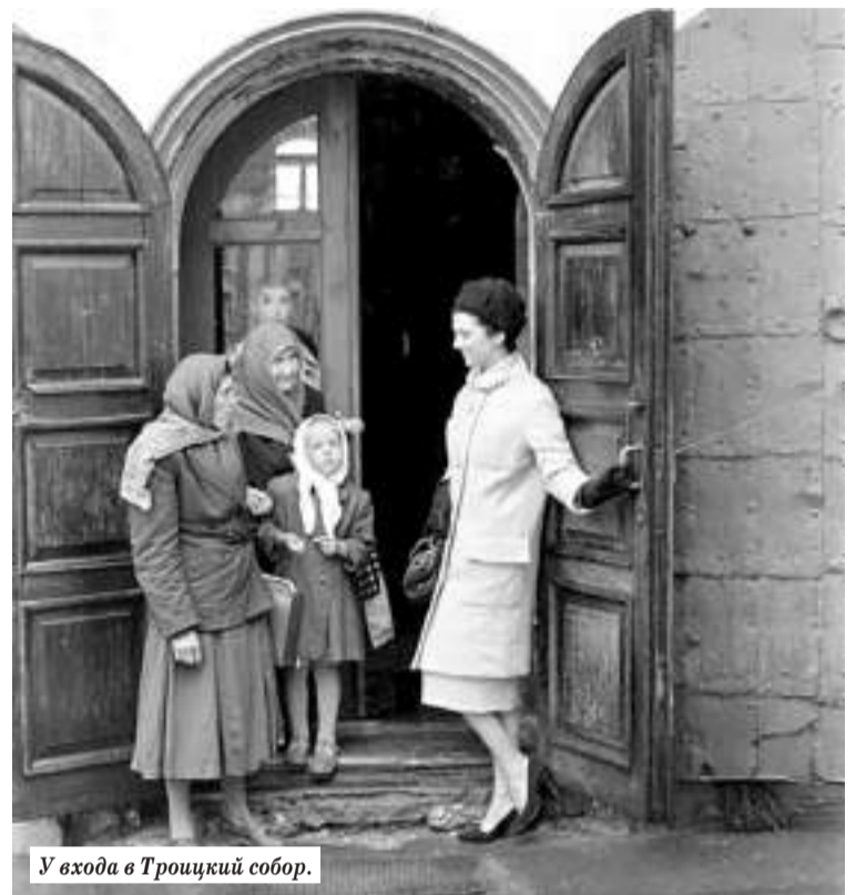
У входа в Троицкий собор.

В предновогодние дни не только происходят, но и вспоминаются всевозможные добрые и интересные истории. Одну из них расскажем сегодня.