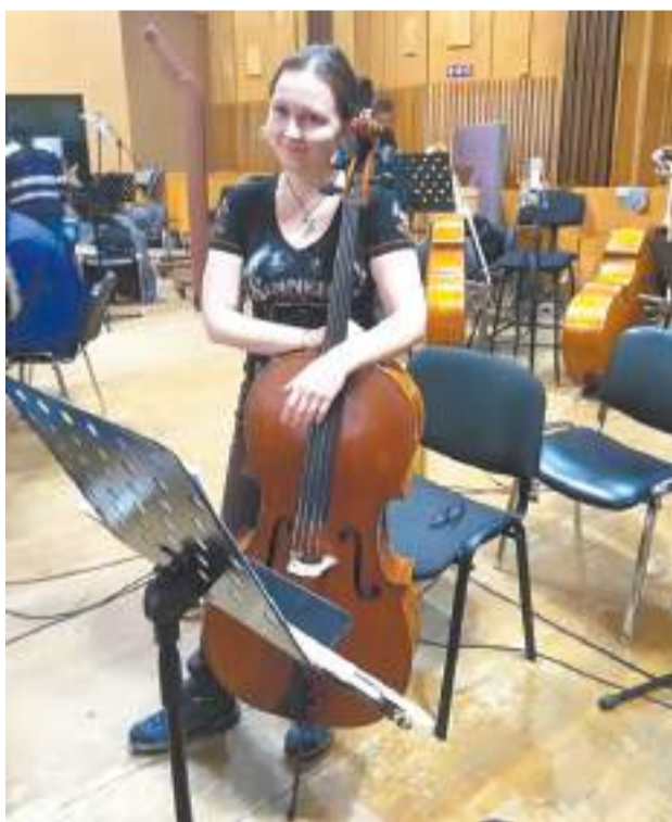
Запись на «Мосфильме».

В академию она поступила без проблем, но с бытом снова всё не как у людей. «Я хотела остановиться у парня через каучсёрфинг, а он начал ко мне приставать. Обещал отдельное место, но начал юлить — типа у него на втором этаже ремонт, так что давай спать в одной кровати. Я тут же ушла».