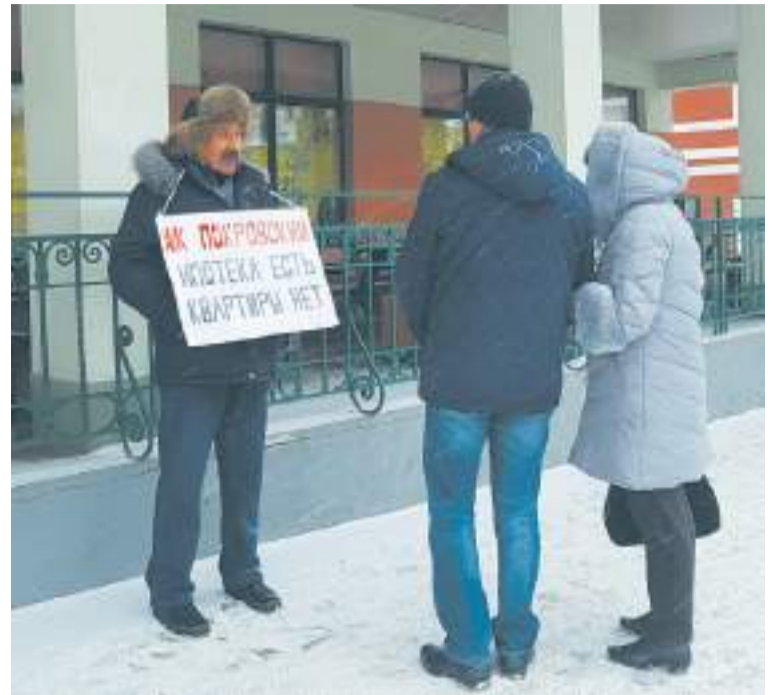
Одиночный пикет, 2018 год

Дом.рф — финансовый институт развития в жилищной сфере. Создан в 1997 году постановлением Правительства РФ для содействия проведению жилищной политики. Среди прочего занимается решением проблем долгостроев