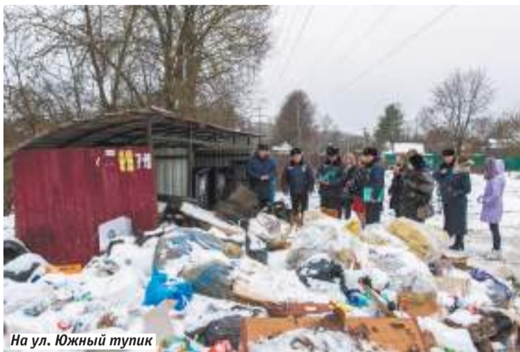
На ул. Южный тупик

Доказательство тому нашли на одной из следующих площадок — у многоквартирных домов на улице Симоненкова. Здесь завалены и сами контейнеры, и территория рядом с ними. Главный государственный административно-техни-