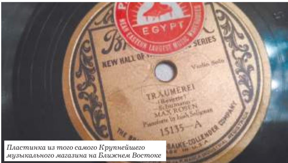
Пластинка из того самого Крупнейшего музыкального магазина на Ближнем Востоке

В зарубежной литературе все приборы этого класса называются граммофонами. Имя «патефон» присвоили младшему брату трубастого певца в России, потому что главными поставщиками сконструированного в Англии перед самой Первой мировой войной прибора была французская фирма Pathe («Патэ»).