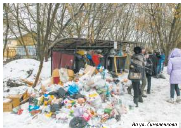
На ул. Симоненкова

и внутриквартальные проезды. Что касается снега, мы увидели, что всё, в принципе, своевременно убирается. Побывали и у нескольких контейнерных площадок. Там имеется ряд недостатков: не соблюдается график вывоза, навалы мусора, недостаточное количество контейнеров. По итогу дали рекомендации органам местного самоуправления по установке площадок, а региональному оператору — по введению в эксплуатацию новых баков. К сожалению, 50 % площадок округа не соответствует стандартам».