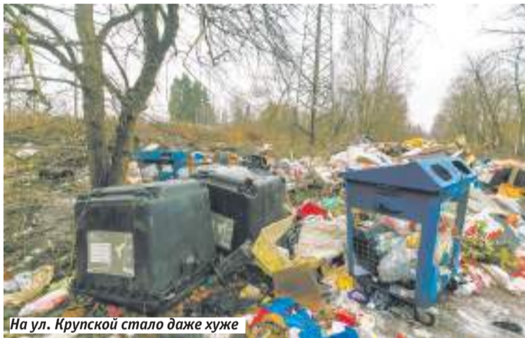
На ул. Крупской стало даже хуже

ческий инспектор Московской области резюмировал ёмко: «Полное безобразие».