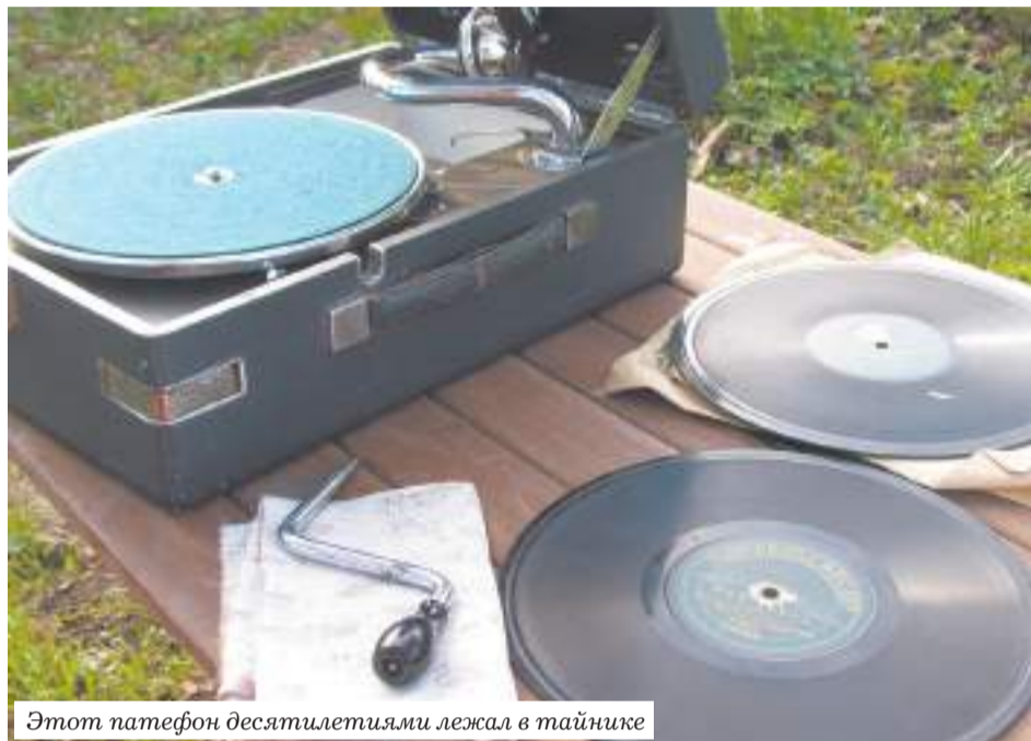
Этот патефон десятилетиями лежал в тайнике

Мы по традиции будем пользоваться названием «патефон». Этот звуковоспроизводящий компактный аппарат в форме чемоданчика в первую очередь был предназначен для нужд военных. Всё при нём! Выдвижная коробочка для игл (более коротких, чем у старшего брата), гнездо для ручки завода, встроенная акустическая камера, даже держатель для минимального количества пластинок! В российской печати тех лет он получил название «походный» или «офицерский» граммофон. Продавали его в начале XX века примерно за 40 рублей.