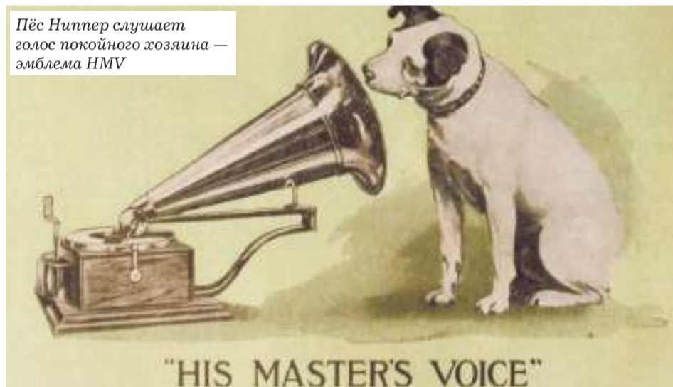
Пёс Ниппер слушает голос покойного хозяина — эмблема НМВ

Фрэнсис изобразил собаку, которая, склонив голову у трубы, слушает запись голоса Марка. Знакомые звуки чрезвычайно интересуют Ниппера, он сосредоточенно внимает граммофону, словно там скрывается хозяин.