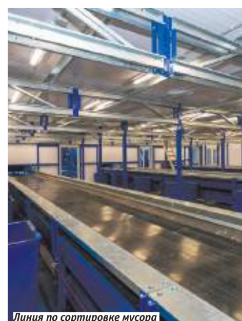
Линия по сортировке мусора