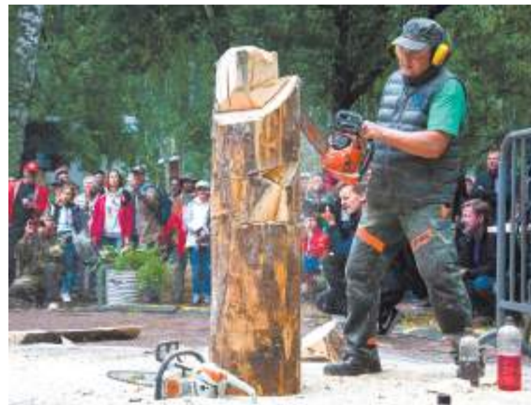
Праздник топора в Томске.

составные скульптуры, склеивают, стягивают — то есть идут наперекор всем законам, которыми учат у нас, считая, что массив дерева неприкосновенен в своей целостности.