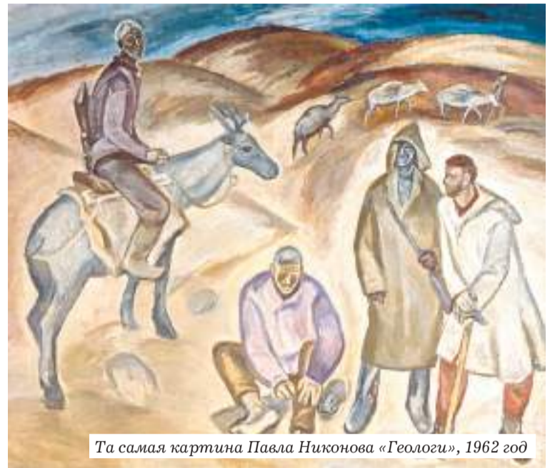
Та самая картина Павла Никонова «Геологи», 1962 год