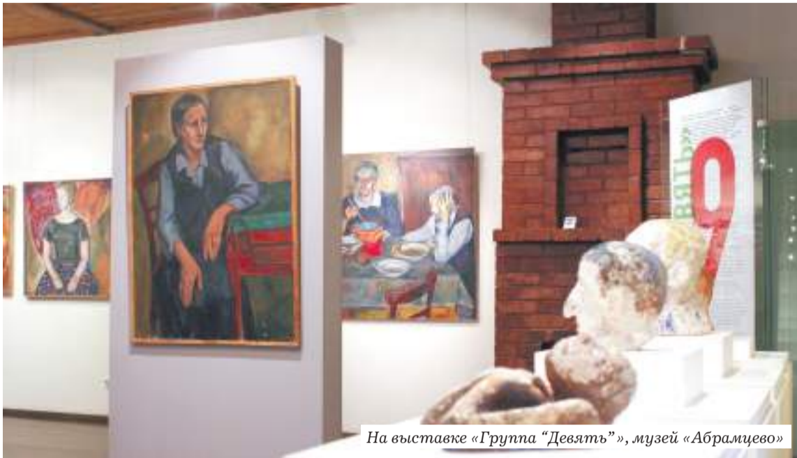
На выставке «Группа «Девять»», музей «Абрамцево»