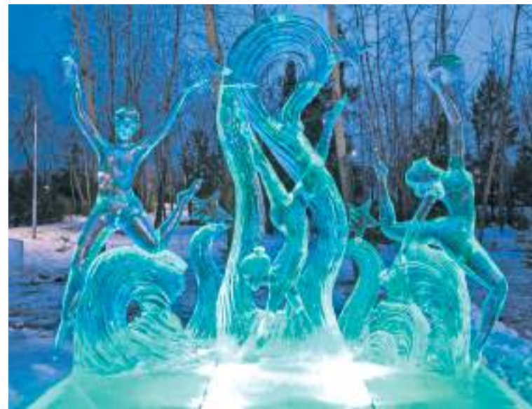
«Путь к победе», Красноярск, фестиваль «Волшебный лёд Сибири»

Мы считаем резьбу традиционно русским жанром и редко задумываемся, какие ещё шко-