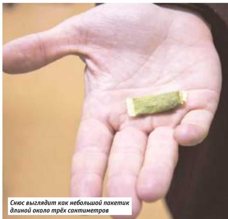
Снюс выглядит как небольшой пакетик длиной около трёх сантиметров

То есть даже при правильном использовании снюса можно получить серьёзное отравление, а