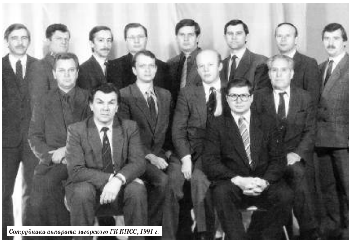
Сотрудники аппарата загорского ГК КПСС, 1991 г.

В интервью освещались и другие животрепещущие вопросы: кому достались три автомобиля ГК КПСС (передавались местным властям в Загорск, Краснозаводск и Хотьково) и «правда ли, что накануне своего закрытия горком перевёл 50 тысяч рублей на счёт одного из коммерческих предприятий?» (правда, но деньги обеща-