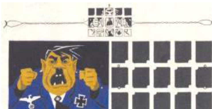
«Посади Гитлера за решётку», 1942 год