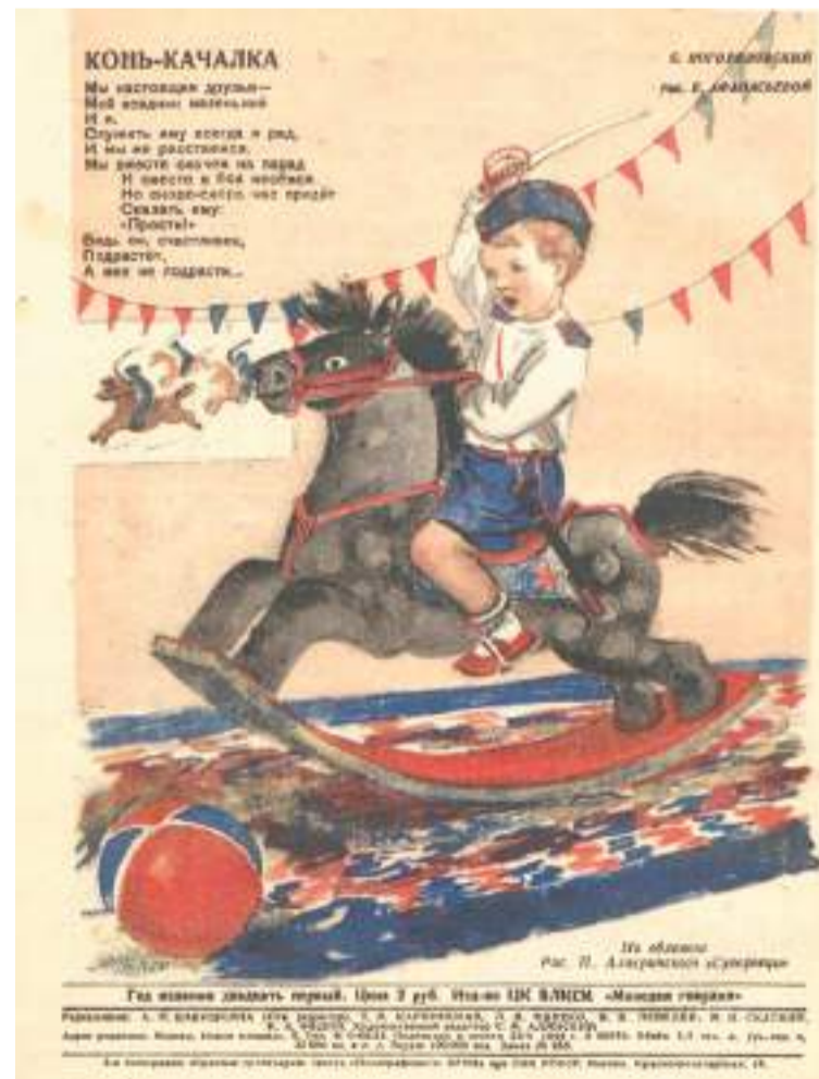
Журнал «Мурзилка», 1944 год

С итуация резко меняется в 1943 году. Происходит массовая демобилизация мастеров народных промыслов, возобновляет свою работу