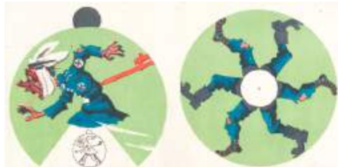
«Немцы под Москвой», 1942 год

Институт игрушки, директором которого (правда, на короткое время) стал художник Юрий Васнецов. Возобновляется производство игрушек. Перед предприятиями встали многочисленные трудности — более чем вдвое сократились производственные площади, не хватало квалифицированных рабочих, оборудование приходилось собирать с нуля. В публикациях периодической печати постоянно возникает тема рационализаторов, «с колена» создававших простейшую технику.