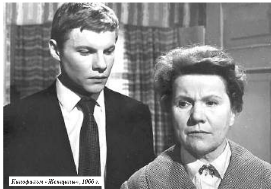
Кинофильм «Женщины», 1966 г.