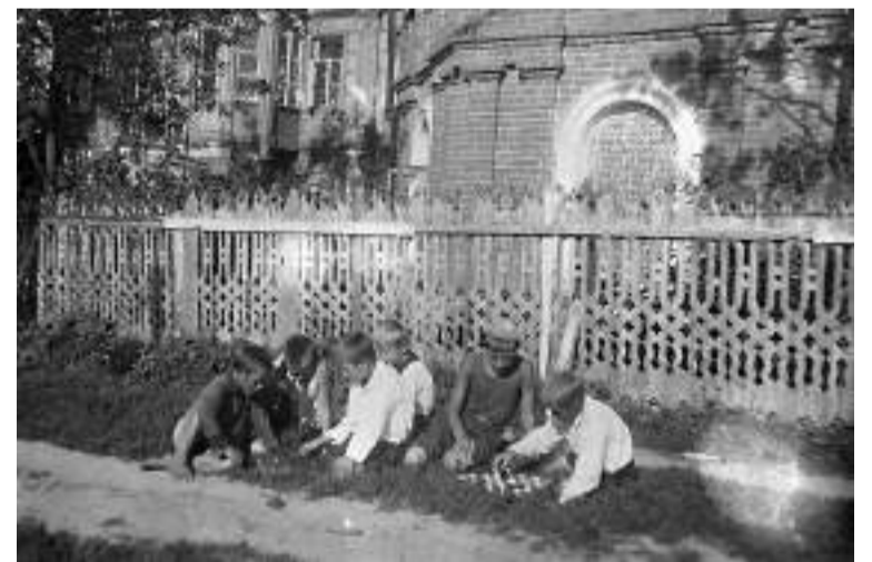
В советское время в закрытом храме располагалась школа, а летом — пионерский лагерь. Фото 1937 г.

После школы я поступил в медицинское училище. Окончил его с красным дипломом. Работал в МОНИКИ в отделении физиотерапии методистом по лечебной физкультуре. Некоторое время учился в медицинском институте. В 1978 году поступил на работу в издательский отдел Московской патриархии на должность референта. Стал иподиаконом у владыки