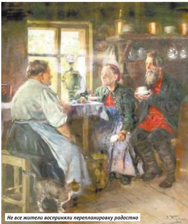
Не все жители восприняли перепланировку радостно

Вот так, с жалобами, с затруднением и утруждением просьбами начальства присутственных мест Посада и Москвы и даже самого генерал-губернатора жители справлялись со свалившейся на них перепланировкой-перестройкой родного им Сергиевского посада.