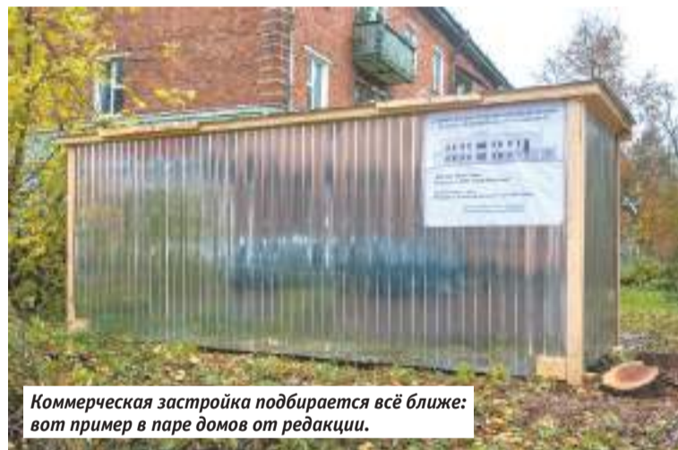
Коммерческая застройка подбирается всё ближе: вот пример в паре домов от редакции.