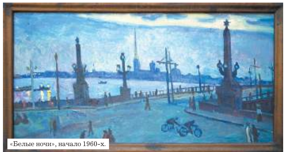
«Белые ночи», начало 1960-х.