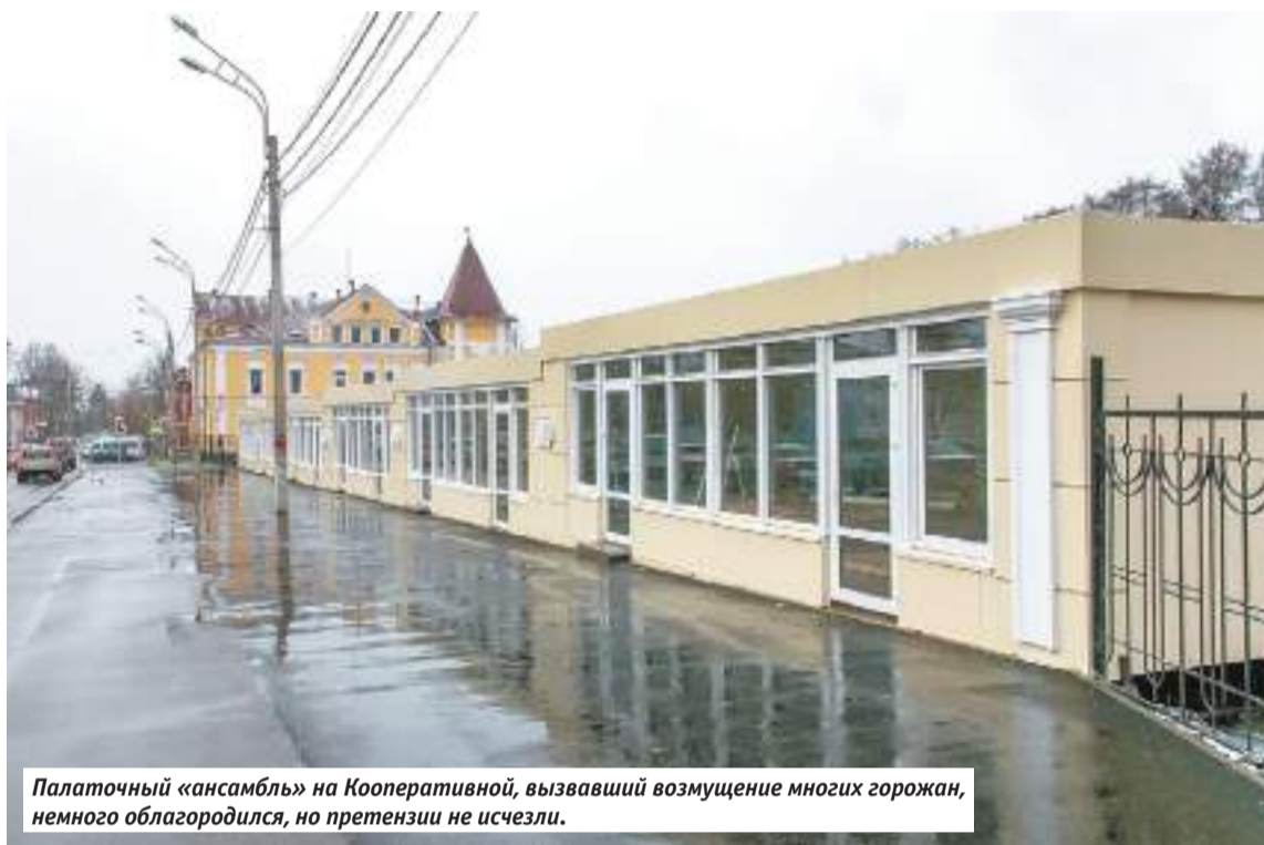
Палаточный «ансамбль» на Кооперативной, вызвавший возмущение многих горожан, немного облагородился, но претензии не исчезли.

Примерно та же ситуация с крупными магазинами, но есть разница: для их строительства необходимо разрешение. Но не местных властей, а Министерства строительного комплекса Московской области, которое делиться планами не спешит. Отсюда возникают казусы вроде строительства ещё одного магазина прямо перед дверями другого сетевого на Новоуличском, 57. Кстати, узнать, что там будет, без мучительно долгих запросов, можно по кадастровой карте. Так, например, некая коробка, очень напоминающая офисную, напротив Дружбы, 9а по данным реестра, оказывается, строится на земле для индивидуального жилищного строительства. Поживём, увидим.