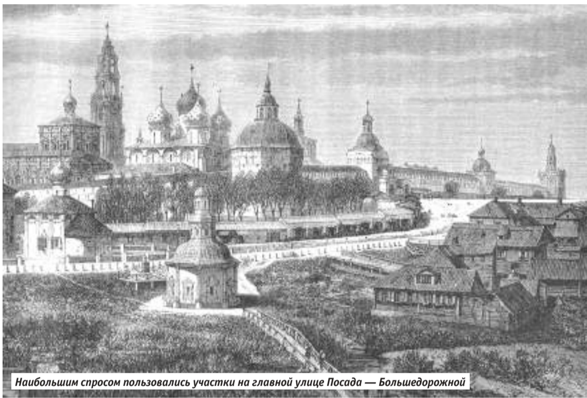
Наибольшим спросом пользовались участки на главной улице Посада — Большедорожной

Многое изменило учреждение в 1782 году Сергиевского посада (в современной терминологии поселению присвоили статус посёлка городского типа. — Прим. ред. ). Начатая спустя десять лет перепланировка нарушила устоявшуюся жизнь обитателей Посада. Перед большинством встала необходимость бросать свои обжитые ещё дедами и прадедами дворные места, перебираться на новые, нести немалые расходы на постройку новых или перенос старых домов. Между тем, далеко не все имели необходимые средства. Имелись и другие причины, которые замедляли преобразование сложившейся за столетия планировочной структуры.