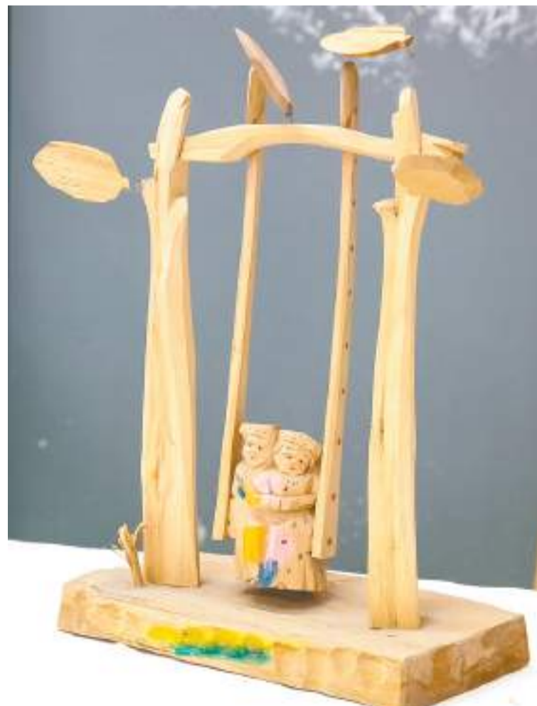
работы представлены в магазине «Посадская матрёшка»

Народная игрушка непрофессиональная, добавляет Светлана, но мастер может увидеть в любом образе суть и передать её минимальными средствами, максимально точно. У Варганова, считает она, это получалось удивительным образом.