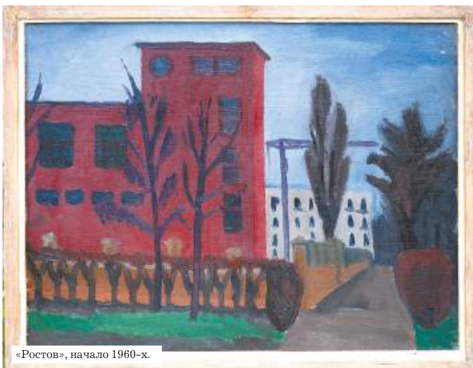
«Ростов», начало 1960-х.

Он? — задира, непокорный, несмирный, алкал и воинствовал всё сделать лучше всех, за какой бы стиль не хватался с ходу и чей бы флаг в искусстве (как исходно и исконно свой) над собою