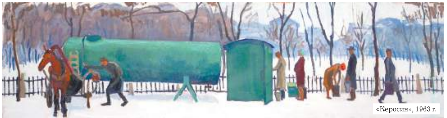
«Керосин», 1963 г.