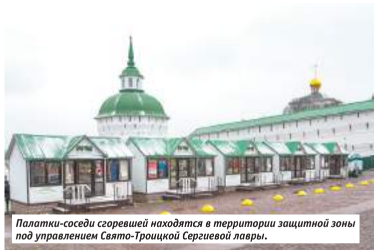
Палатки-соседи сгоревшей находятся в территории защитной зоны под управлением Свято-Троицкой Сергиевой лавры.

Дело в том, что по всему городу возникают торговые точки разных площадей и формата: большинство объектов не вызывает у жителей ни малейшего воодушевления, если судить по обсуждениям в социальных сетях. Так кому же всё-таки нужны новые палатки и продуктовые магазины?