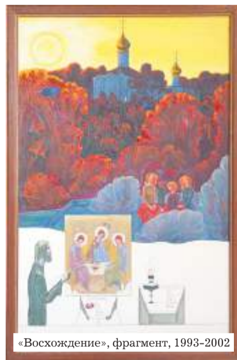
«Восхождение», фрагмент, 1993-2002