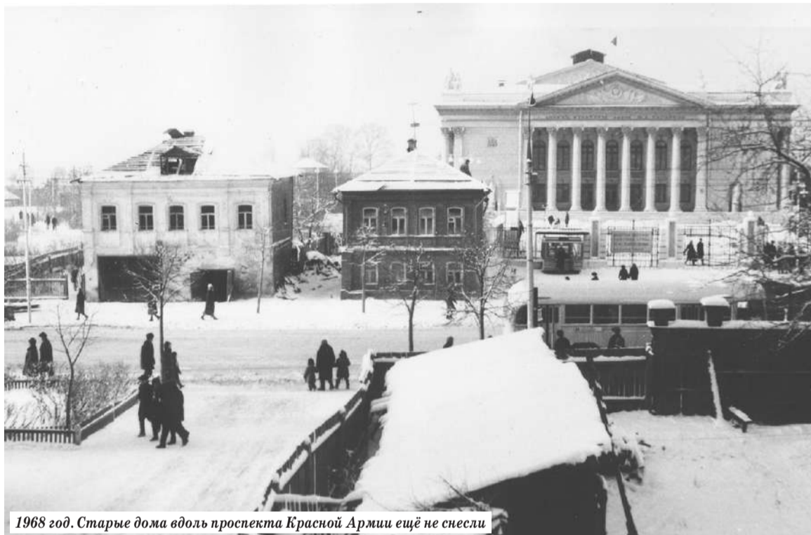
1968 год. Старые дома вдоль проспекта Красной Армии ещё не снесли

Двумя годами ранее для богослужений была вновь открыта Троице-Сергиева лавра. Возможно, эти события связаны. Существует неподтверждённая, но красивая легенда, что решение о строительстве Дворца принималось на самом верху: патриарх Алексей I обра-