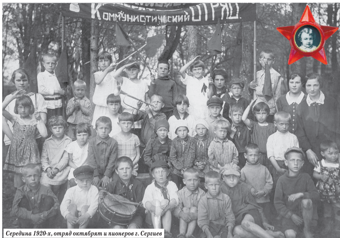
Середина 1920-х, отряд октябрят и пионеров г. Сергиев