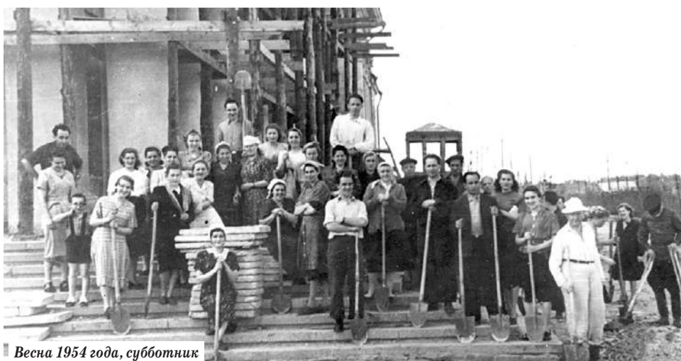
Весна 1954 года, суббота

Из воспоминаний известно, что сводный хор в сопровождении духового оркестра исполнил песню