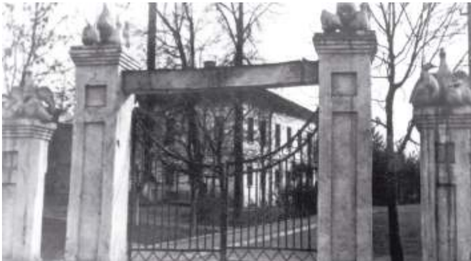
Ворота птицеводинститута. Обращают на себя внимание фигуры птиц сверху