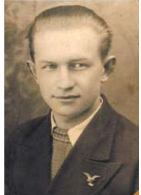
После окончания Мытищинского аэроклуба.