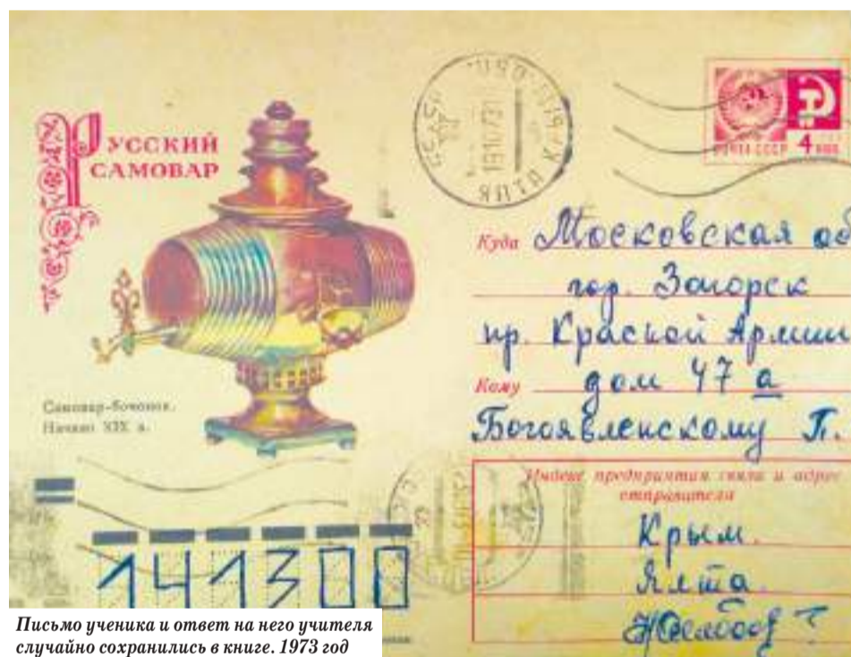
Письмо ученика и ответ на него учителя случайно сохранились в книге. 1973 год