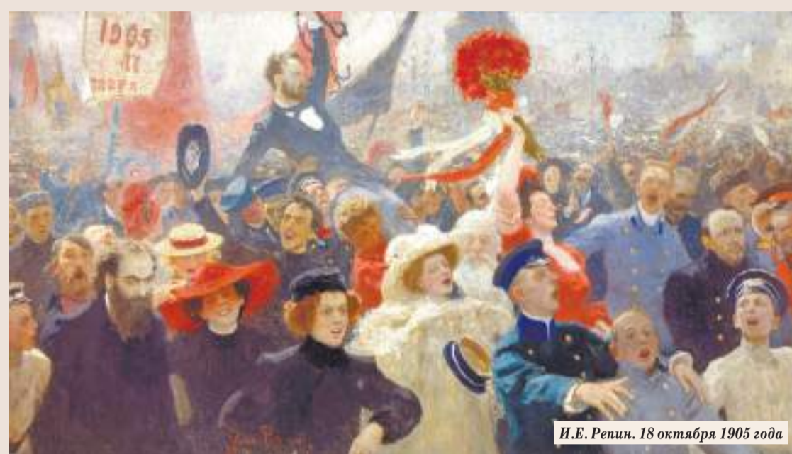
И.Е. Репин. 18 октября 1905 года

♦ 22 октября (3 ноября) 1860 года (160 лет назад) в Спасо-Преображенском соборе училищного Вифанского монастыря во время всеобщего бдения произошло неприятное событие. Стоявшая рядом с семинаристами женщина вдруг всплеснула руками и, закричав «страшным сильным и диким голосом», упала на соседку, которая также страшно закричала. Затем обе женщины столь сильно ударились об пол, что в соборе зазвенели стекла. Среди семинаристов началась паника. Одни по-