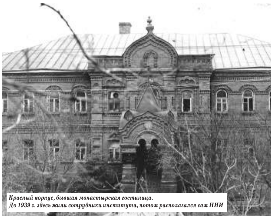
Красный корпус, бывшая монастырская гостиница. До 1939 г. здесь жили сотрудники института, потом располагался сам НИИ

В сентябре 1930 года, 90 лет назад, в стенах бывшего Спасо-Вифанского монастыря начал свою деятельность Всесоюзный научно-исследовательский институт птицеводства и птицепромышленности. При нём планировалось создать обширный птицеводхоз с «батарейным производством» (т. е. с инкубатором), получивший тогда название Московского производственного научно-опытного комбината в г. Загорске.