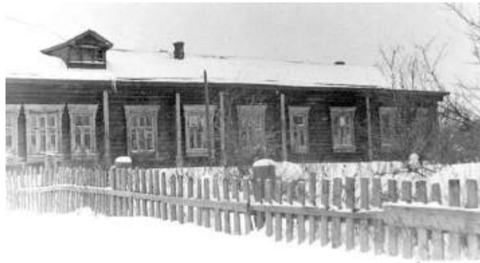
Здание школы было перевезено из Туракова и собрано на новом месте