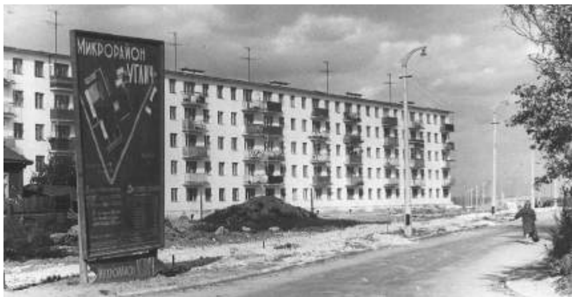
Строится микрорайон Углич