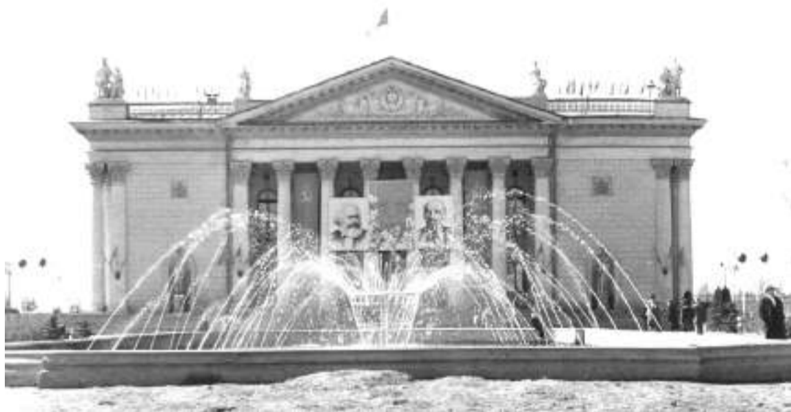
Дворец культуры им. Ю. А. Гагарина