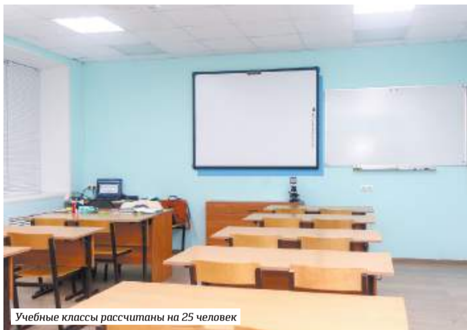
Учебные классы рассчитаны на 25 человек