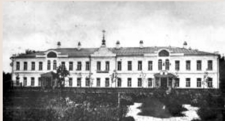
В 1876 году прогимназия переехала в специально для неё построенное здание

Амфитеатров начал с малого — с того, чтобы добиться открытия четырёхклассной прогимназии, а уж затем расширить её до полной гимназии из восьми классов. Дума поддержала план и выделила 3000 рублей на финансирование. Остальные 11 500