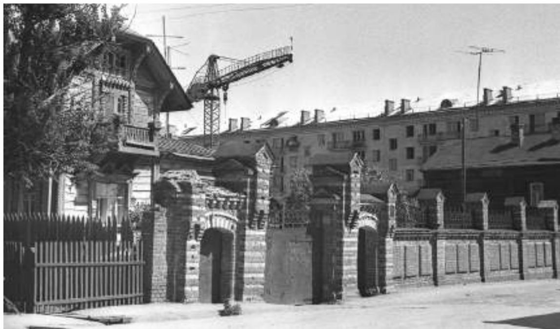
Строительство домов на ул. Шлякова, 1967 г.

КАК МЕНЯЛСЯ ОБЛИК ЗАГОРСКА В СОВЕТСКОЕ ВРЕМЯ