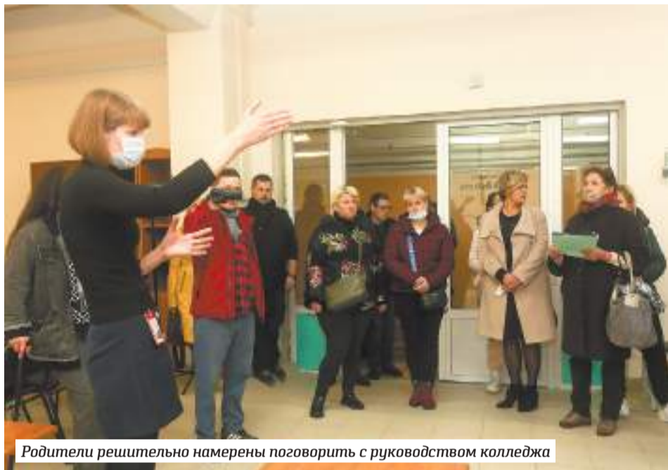
Родители решительно намерены поговорить с руководством колледжа

Студенты ВАКЗО три недели отучились на площадях Сергиево-Посадского колледжа