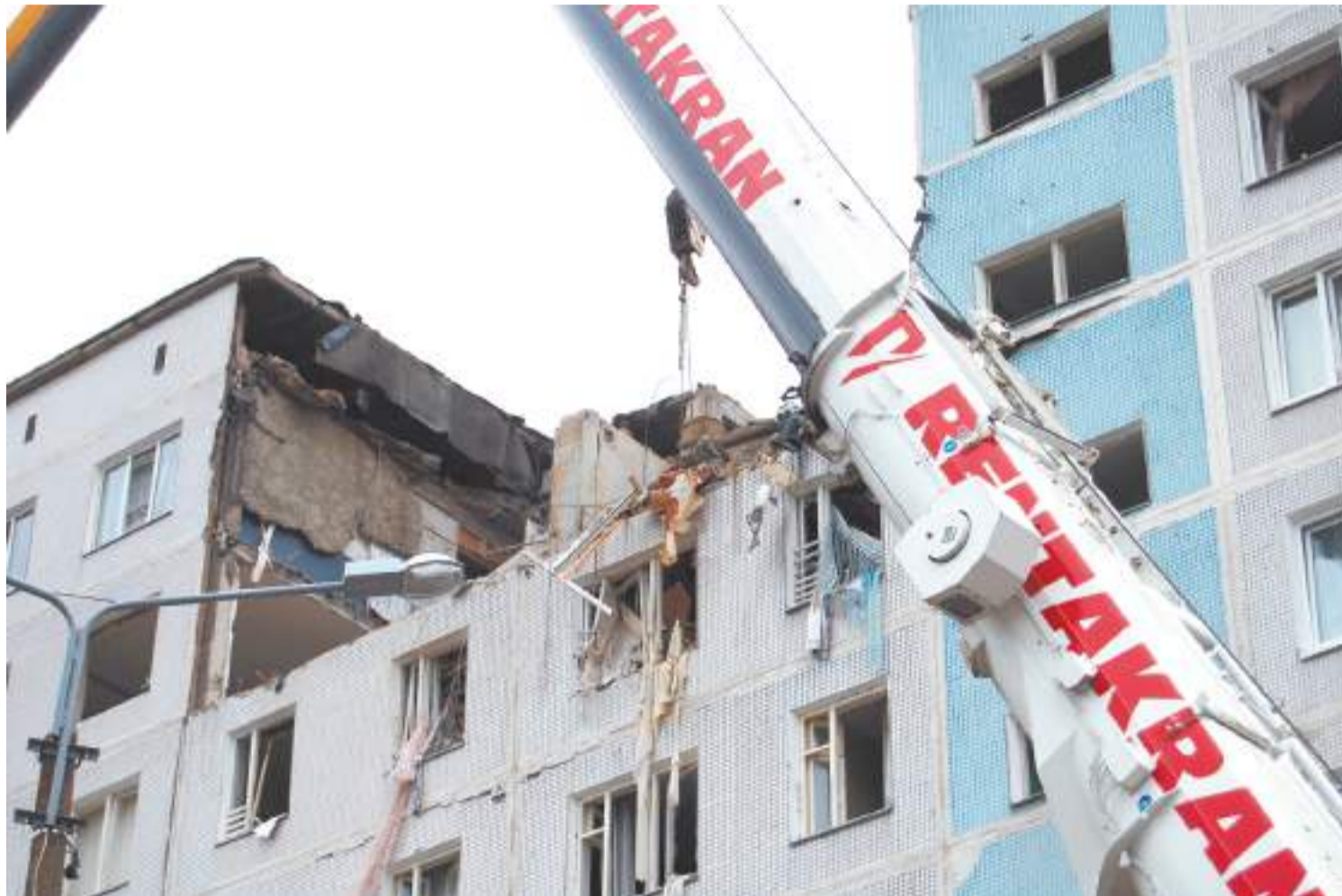
Последствия взрыва газа в пос. Загорские Дали, ноябрь 2013 г.

Ещё один взрыв на минувшей неделе произошёл в Ельце, что в Липецкой области. В двухэтажном доме обрушились перекрытия, в результате чего погибли три человека, а шестеро серьёзно пострадали.