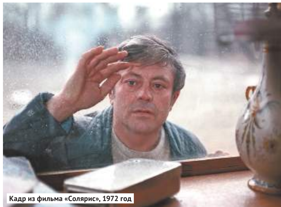
Кадр из фильма «Солярис», 1972 год

Говорю «казалось бы» — потому что, если внимательно читать роман, можно найти источник этой концептуальной идеи, подхваченной Тарковским. Один из героев, Снаут, говорит: «...Мы совсем не хотим завоевывать космос, мы просто хотим расширить землю до его пределов (...) Мы не ищем никого, кроме человека. Нам не нужны другие миры. Нам нужно наше отражение» (пер. Г. А. Гудимова, В. А. Перельман). Для Лема поиск человеком человека — только часть дискуссии о