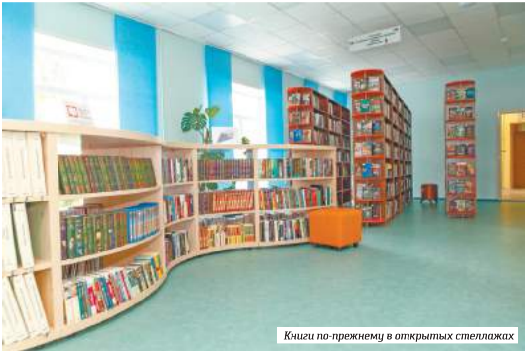
Книги по-прежнему в открытых стеллажах

Насколько модернизация библиотеки увеличит число посетителей?