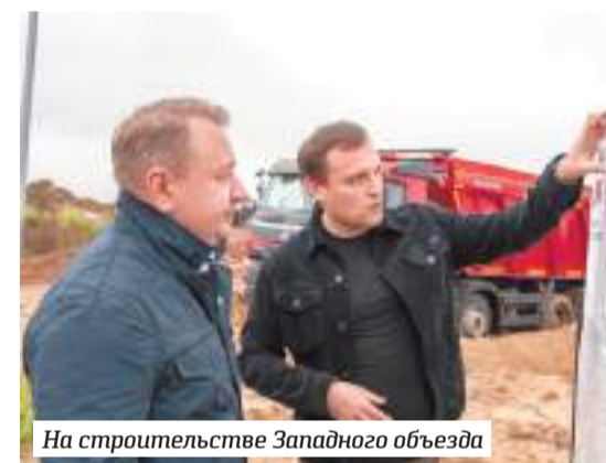
На строительстве Западного объезда