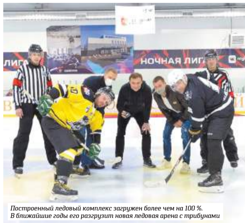
Построенный ледовый комплекс загружен более чем на 100 %. В ближайшие годы его разгрузит новая ледовая арена с трибунами