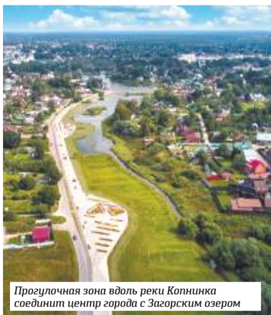
Прогулочная зона вдоль реки Копнинка соединит центр города с Загорским озером