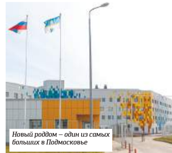
Новый роддом – один из самых больших в Подмосковье