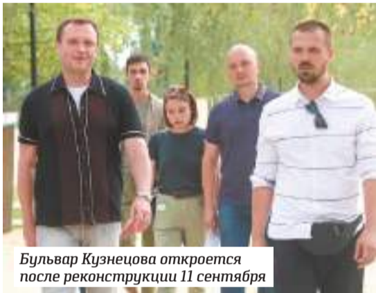
Бульвар Кузнецова откроется после реконструкции 11 сентября

С 2014 по 2021 годы Сергиев Посад совершил гигантский рывок из депрессии в новую реальность