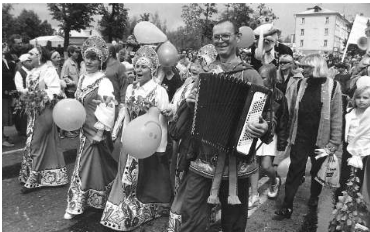
Празднование первого Дня города, 1988 год

Далее площадки в слободах работали по принципу simultaneity, то есть одновременности, чтобы на протяжении всего праздника там проходили мероприятия, что называется, на любой вкус и цвет, с использованием разных форм и жанров сценического искусства. Ещё важно, что всё происходящее мы наполняли смыслом, определённой