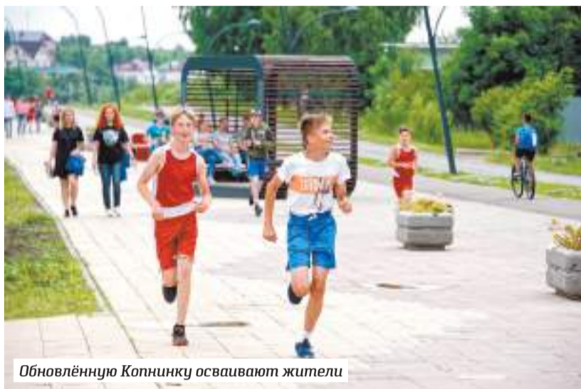
Обновлённую Копнинку осваивают жители