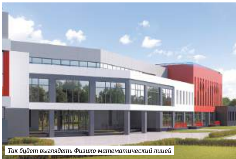
Так будет выглядеть Физико-математический лицей