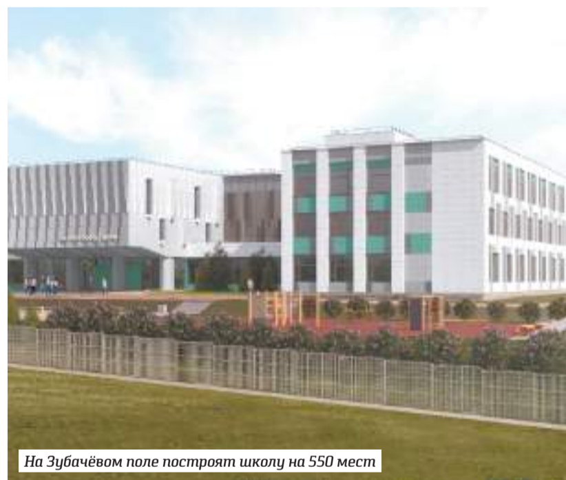
На Зубачёвом поле построят школу на 550 мест