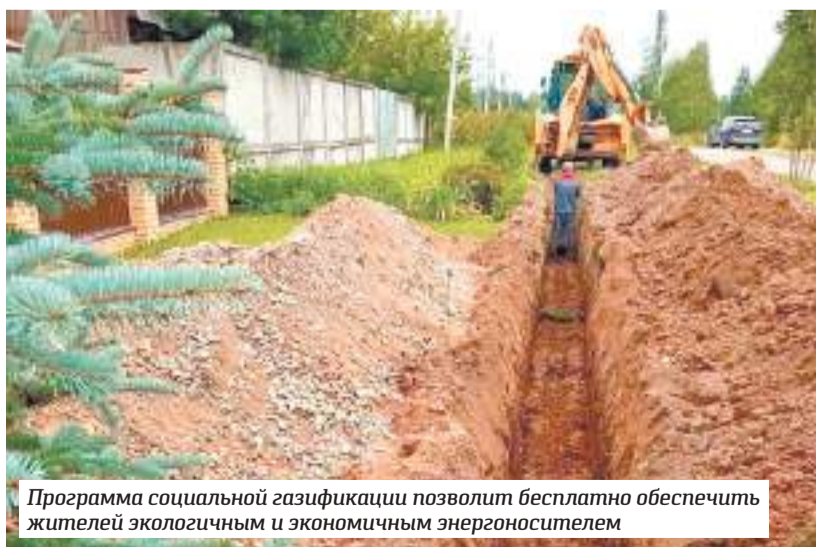
Программа социальной газификации позволит бесплатно обеспечить жителей экологичным и экономичным энергоносителем

З а последние пять лет Сергиево-Посадский округ сильно изменился, и с этим утверждением вряд ли кто-то будет спорить. Мы получили современные парки, новые пешеходные маршруты, отремонтированные дороги. Сделали первые шаги к модернизации коммунальной инфраструктуры, что невероятно важно для дальнейшего развития муниципалитета. Но впереди ещё очень много дел, задач, проектов. Реализуем их — получим современную и ещё более комфортную территорию. Задел для дальнейшей работы есть, финансирование — тоже. Настало время поделиться планами на будущее.