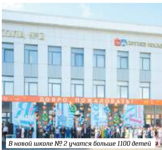
В новой школе №2 учатся больше 1100 детей