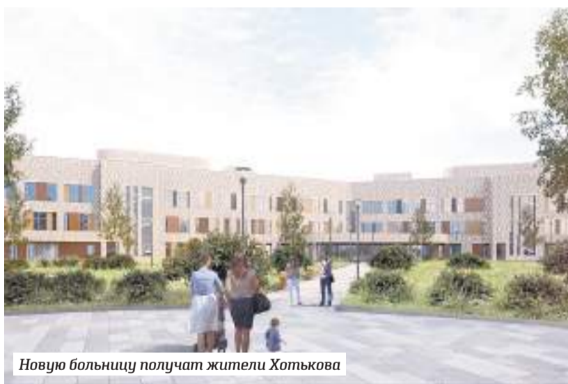
Новую больницу получают жители Хотькова