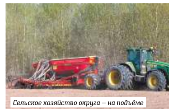
Сельское хозяйство округа – на подъёме