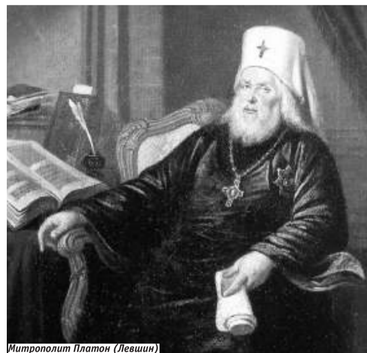
Митрополит Платон (Левшин)

Переписка духовного и светского руководителей Московской губернии напрямую или через канцелярии Московского Губернского правления продолжалась около года. У Главнокомандующего в Москве и губернии было немало иных дел; кроме того, временами он отлучался в свои имения. Так же и митрополит Платон был загружен немалым числом дел по вверенной его попечению епархии, управлением Троице-Сергиевой лаврой и своим любимым Спасо-Вифанским монастырём.