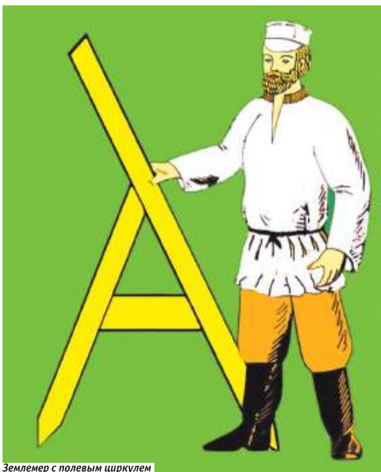
Землемер с полевым циркулем