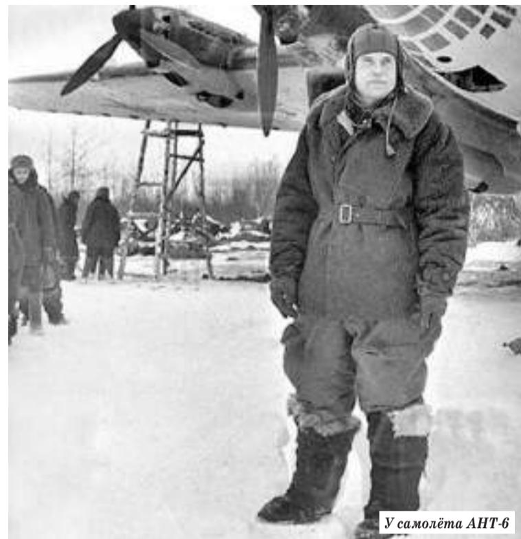
У самолёта АНТ-6