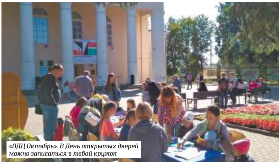
«ОДЦ Октябрь». В День открытых дверей можно записаться в любой кружок

ОДЦ «Октябрь» ждёт в первую очередь молодёжь от 14 лет. Здесь это объясняют тем, что до 14 лет дети с удовольствием ходят на вокал и в другие студии, но потом начинается учёба, репетиторы, подготовка в вузы. Казалось бы, рассказывают в