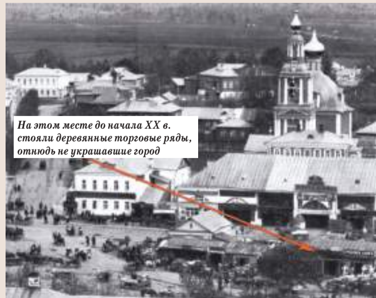
На этом месте до начала XX в. стояли деревянные торговые ряды, отнюдь не украшавшие город

◆ 23 сентября (6 октября) 1916 года (105 лет назад) власти Посада утвердили стоимость проезда в извозчицких экипажах, «чтобы ограничить аппетиты» извозчиков. Для этого Посад был условно разделён на два кольца. В первом кольце радиусом от Лавры до железной дороги, плата за проезд в экипаже с одной лошадию определялась в 40 копеек, а в парном экипаже в 60 копеек. Проезд от Лавры до Вифанского монастыря оценивался, соответственно, в 60 и 90 копеек. В ночное время плату разрешалось увеличивать в 1,5 раза.