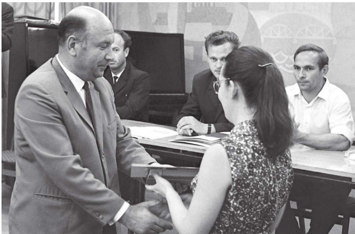
Вручение дипломов об окончании ВЗМИ. ЗОМЗ, 1971 г.

В 1950-х годах Загорск остро нуждался в инженерных кадрах: для крупных предприятий, оптико-механического и электромеханического заводов, требовались квалифицированные сотрудники. Выходом стало образование без отрыва от производства: после смены рабочие и техники садились за парты Всесоюзного заочного машиностроительного института (ВЗМИ). В истории нашего города он сыграл заметную роль.