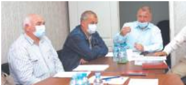
Очередная встреча депутатов окружного Совета с жителями посёлка Реммаш

Евгения НИКОЛАЕВА