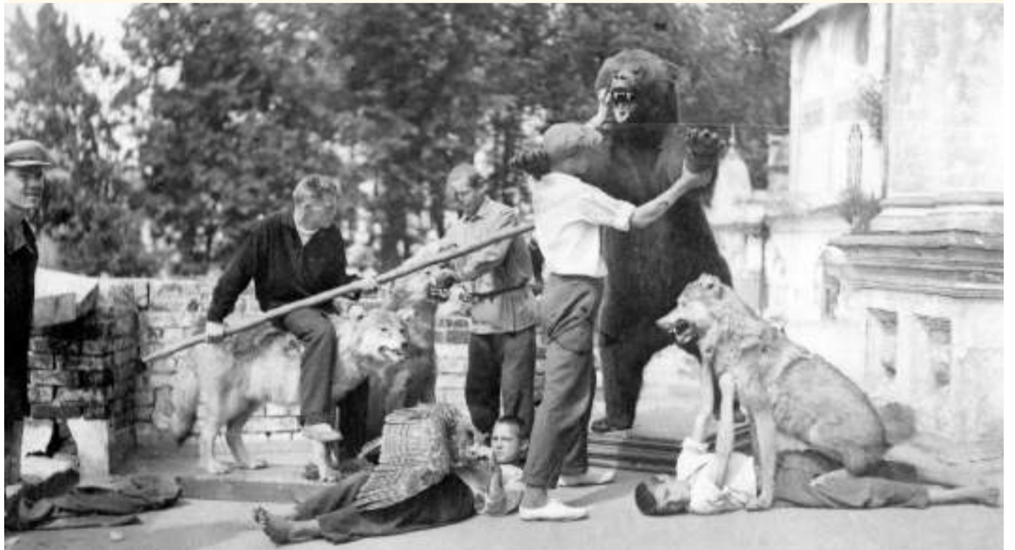
Чучело «последнего медведя Радонежья» на крыльце Краеведческого музея в Трапезной Лавры. Фото 1930-х годов

НОВАЯ КНИГА О СЕРГИЕВОМ ПОСАДЕ ПРЕВРАЩАЕТ ИСТОРИЮ ГОРОДА В ОСТРОСЮЖЕТНЫЙ ДЕТЕКТИВ