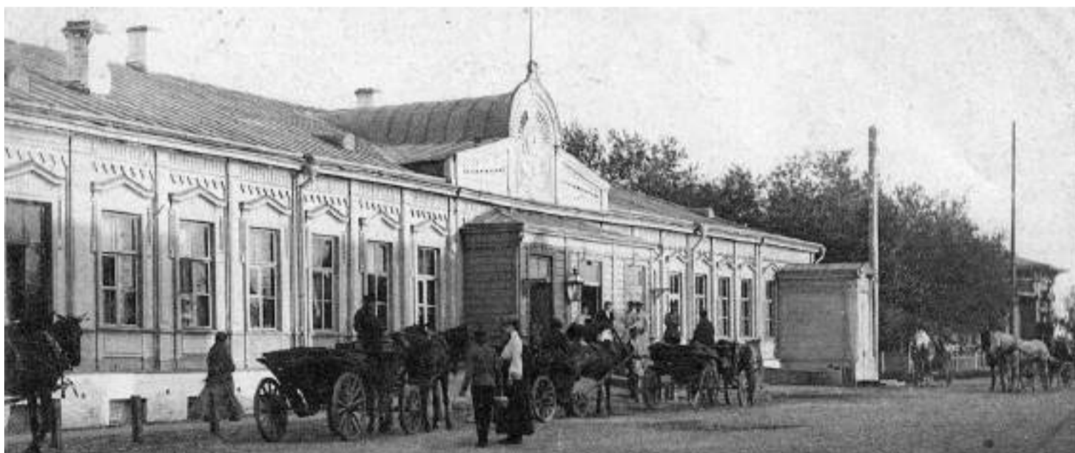
В деревянном вокзале было два зала ожидания и буфет

► Комиссия заключила: «...рельсовый путь хорош, мосты прочны. Водоснабжение обеспечено. На Троицкой станции водопровод оканчивается. Телеграф в действии, станционные дома удовлетворительны для приёма пассажиров...»