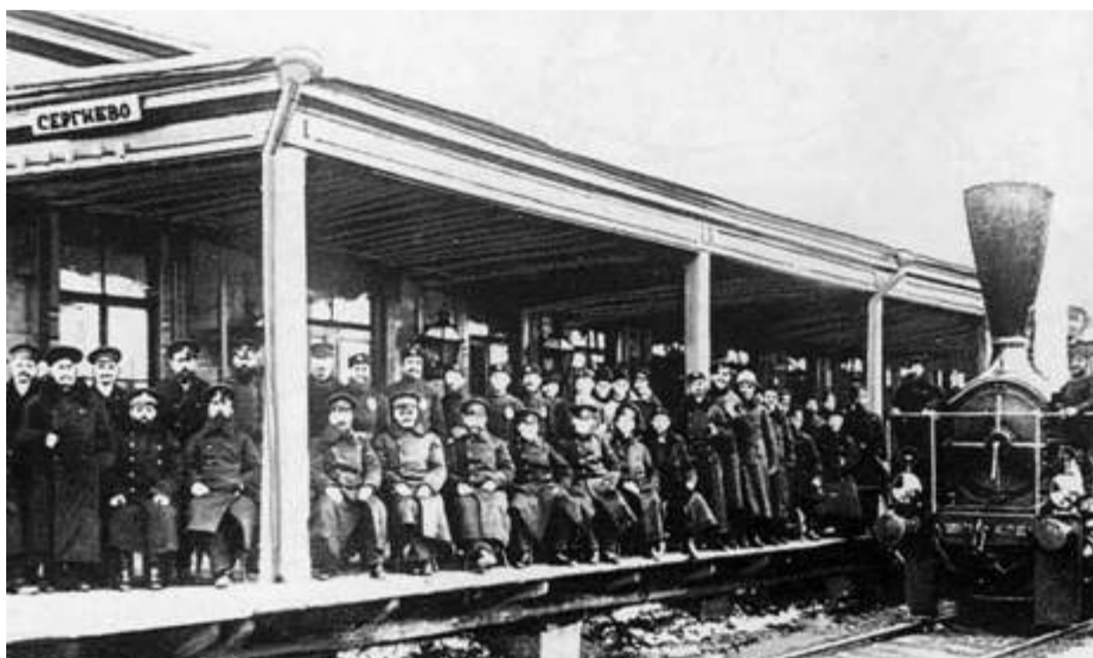
Прибытие первого поезда на станцию Сергиево, 1862 год

К ак мы помним, при учреждении в 1782 году Сергиевский посад получил статус именно посада, то есть поселения с отдельными городскими привилегиями. Значительную часть его дальнейшей дореволюционной истории можно обобщённо представить как процесс постепенного превращения в полноценный город. Этому способствовало умножение числа жителей, экономическое развитие, обретение собственной полицейской части, улучшение сообщения с Москвой. В последнем случае важным шагом к статусу города, живого и развивающегося, стало открытие регулярно железнодорожного сообщения Сергиевского посада с Москвой и Ярославлем. Строительство железной дороги — важная страница в истории нашего города.