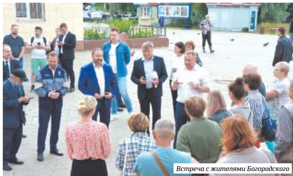
Встреча с жителями Богородского