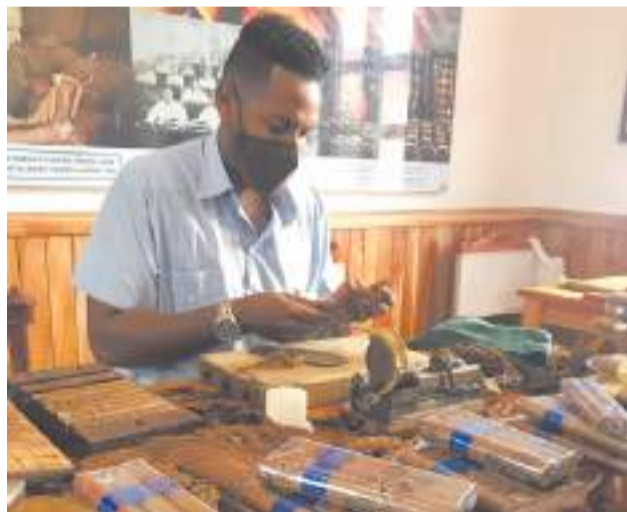
Самые дорогие кубинские сигары делают вручную

Мужчины на Кубе все сухощавые, дамы в теле, причём многие весьма округлые. Правильное и сбалансированное питание для кубинцев обходится очень дорого. Говорят, что в основном рацион жителей страны составляют яйца, рис, бананы и другие недорогие и калорийные