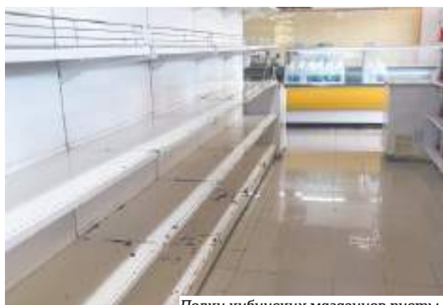
Полки кубинских магазинов пусты