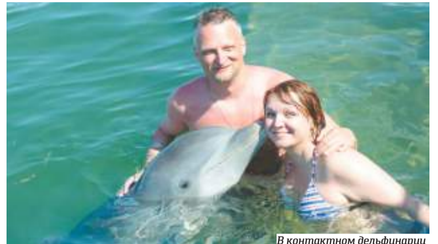
В контактном дельфинарии

продукты. Мясо, фрукты и овощи для большей части населения остаются недоступными.