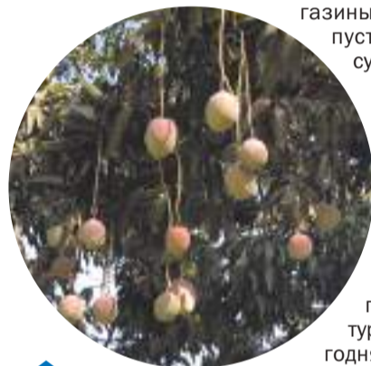
Манго на Кубе растут, как у нас яблоки

Кубинский народ очень гордый, но при этом крайне бедный. Из-за экономической блокады и скудости финансов у населения продуктовые ма-