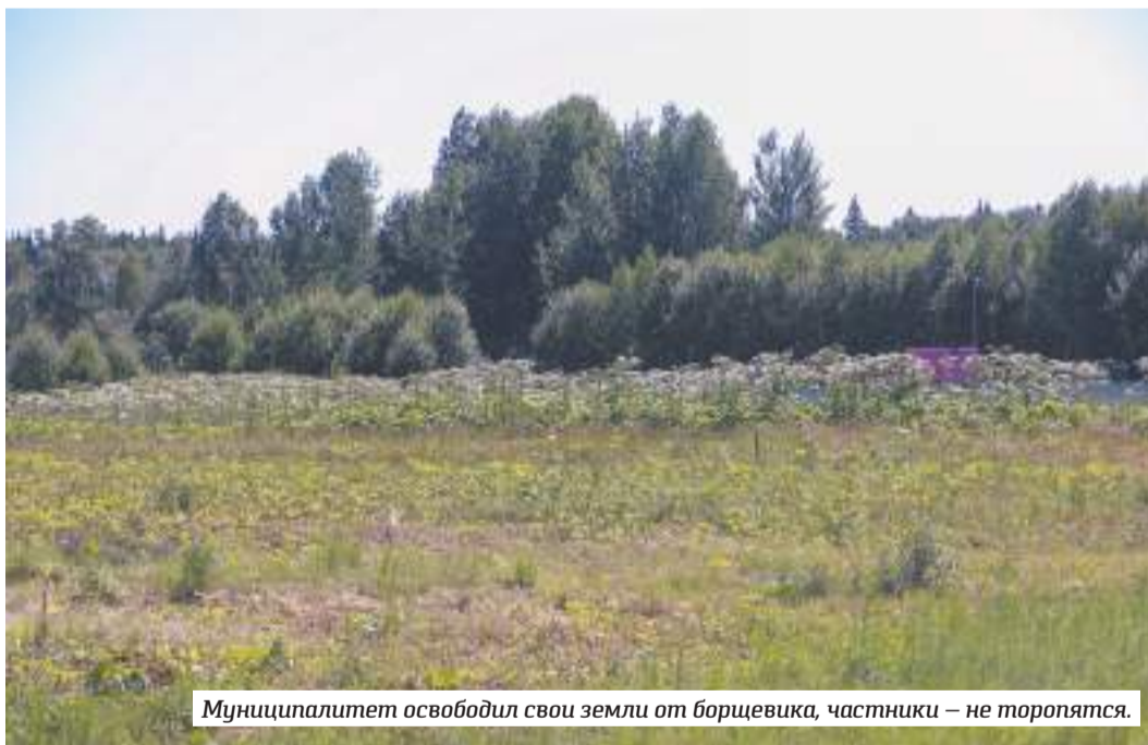
Муниципалитет освободил свои земли от борщевика, частники — не торопятся.