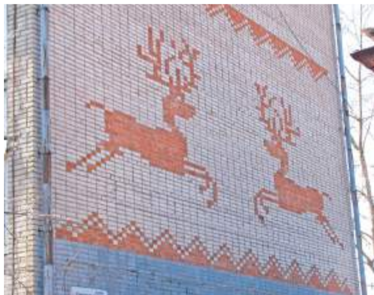
Олень. Симоненкова, 21