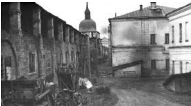
Жилые помещения в стенах Лавры, военные годы