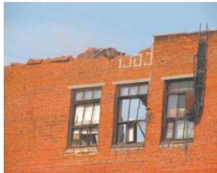
«1963» — стена, разрушенная при строительстве гипермаркета на Вифанской

В самом здании — прекрасная мозаика, которая, к счастью, находится под охраной сотрудников библиотеки. Говорят, в ней сто тысяч кусочков смальты, а Ломоносов неспроста стоит на фоне Дворца культуры: и дворец, и библиотеку строило одно предприятие, ЗОМЗ. Эмблему