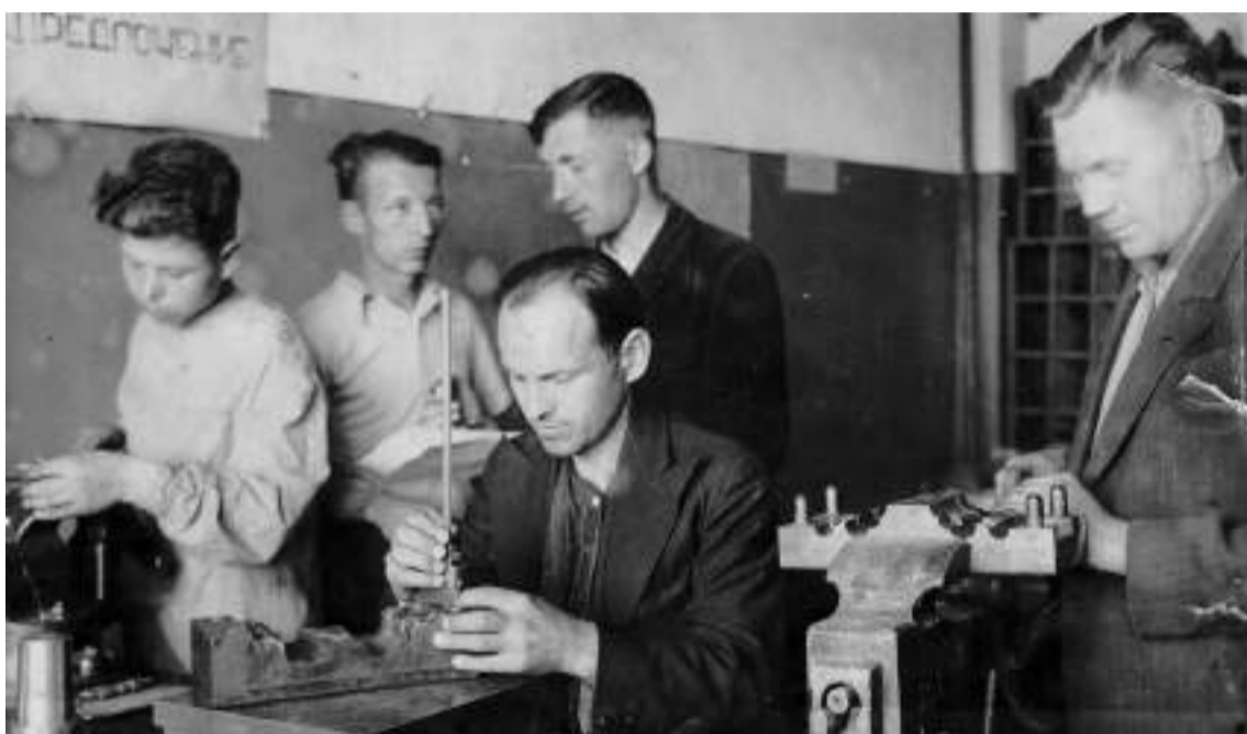
ЗОМЗ, 48-й цех, 1944 год