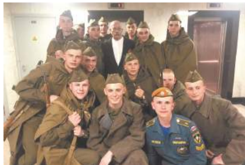
Участник концерта «Будем жить!» в Кремле, 2 ряд, 1-й слева, 2019