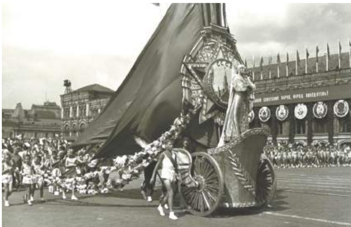
Парад. Идут спортсмены ЗИЛа