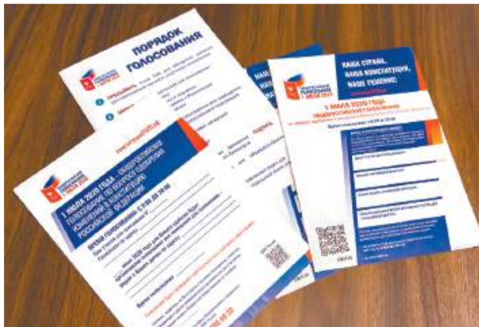
График работы ТИКа в помещении: с 25 по 29 июня — с 16 до 20 часов, 30 июня — с 11 до 15 часов и 1 июля — с 8 до 20 часов. В каждом избирательном участке

для обеспечения социальной дистанции будет нанесена разметка и указано направление движения.