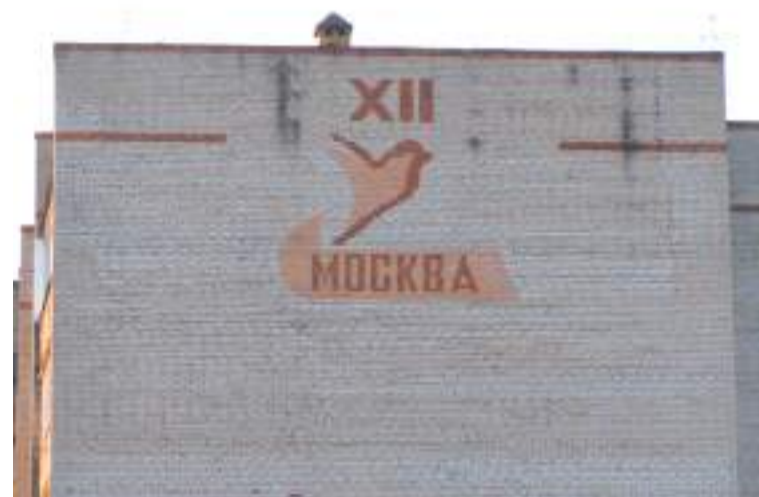
После Фестиваля-85 на глухих кирпичных кладках селились голуби. Симоненкова, 25

завода можно найти в соседнем квартале, у дома 24 на Вальной улице — в кирпичной версии, и на ограде стадиона за ДК — в металлической.