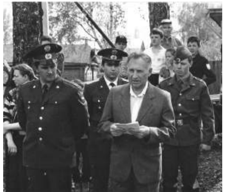
На закладке Парка памяти

До самой своей смерти ветеран самоотверженно создавал свой Парк памяти. Собирал семена,