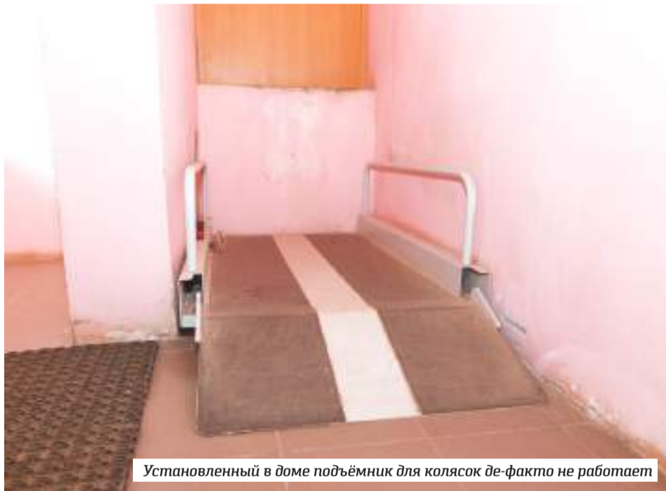
Установленный в доме подъёмник для колясок де-факто не работает