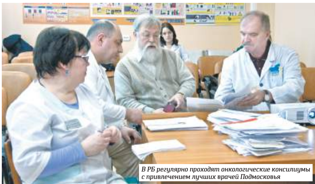
В РБ регулярно проходят онкологические консилиумы с привлечением лучших врачей Подмосквы