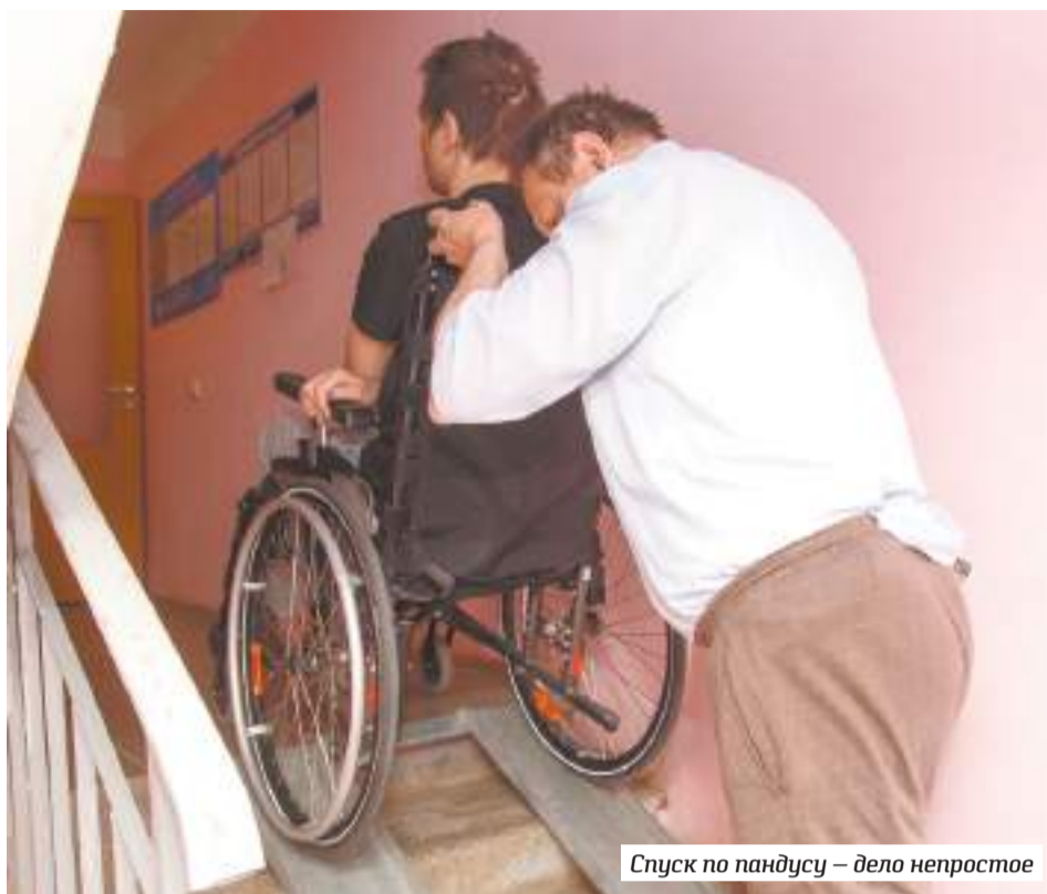
Спуск по пандусу — дело непростое

Представители УК «НКС участок № 1» приглашение на заседание проигнорировали, но по телефону юрист объяснил позицию компании так: