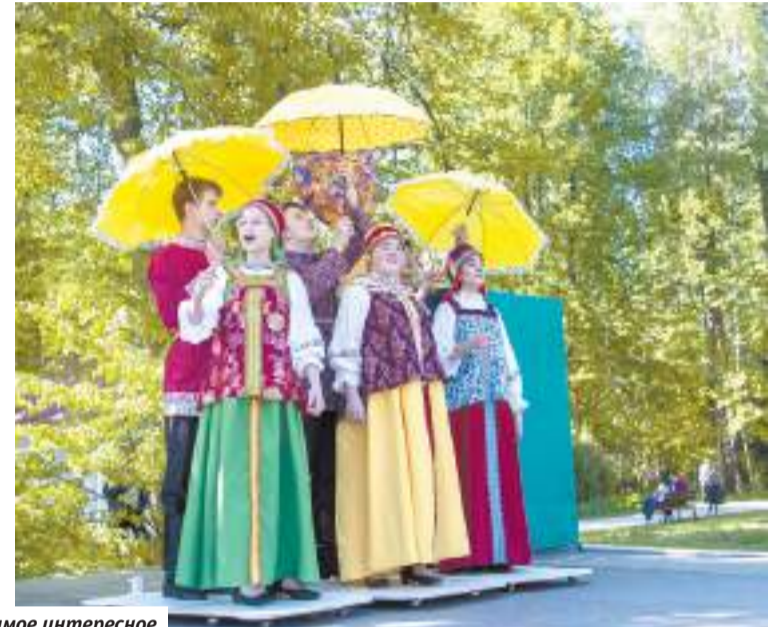
«Абрамцево»: самое интересное происходит в парке

О КОЛО 400 ЧЕЛОВЕК ПРИШЛИ В СЕРГИЕВО-ПОСАДСКИЙ МУЗЕЙ-ЗАПОВЕДНИК В СУББОТУ ВЕЧЕРОМ, КОГДА ПО ВСЕЙ СТРАНЕ НАЧАЛАСЬ АКЦИЯ «НОЧЬ МУЗЕЕВ», И ЭТО КАК МИНИМУМ ВДВОЕ БОЛЬШЕ ТОГО ЧИСЛА ПОСЕТИТЕЛЕЙ, ЧТО МУЗЕЙ ПРИНИМАЕТ В ОБЫЧНЫЕ ВЫХОДНЫЕ.