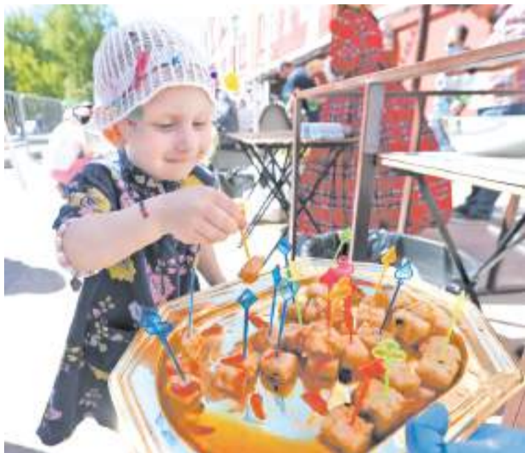
В субботу на улице Карла Маркса в Сергиевом Посаде прошёл уже второй в этом сезоне фестиваль «Трикотажка фест».

Нынешняя «тусовка» была посвящена Международному дню музеев, который отмечается 18 мая.