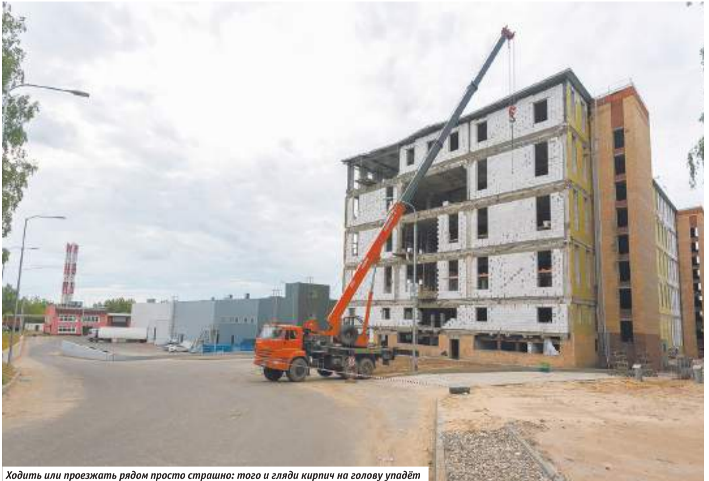
Ходить или проезжать рядом просто страшно: того и гляди кирпич на голову упадёт

Но оказалось, что к маю эти сведения (а запрос в кадастр администрация, как мы поняли, делала в марте) уже устарели. В ЗАО «Центральная трастовая компания», куда мы дозвонились, нам сообщили, что несколько месяцев назад продали недвижимость, которую они приобрели у ООО «Завод № 6» 16 ноября 2015 года.