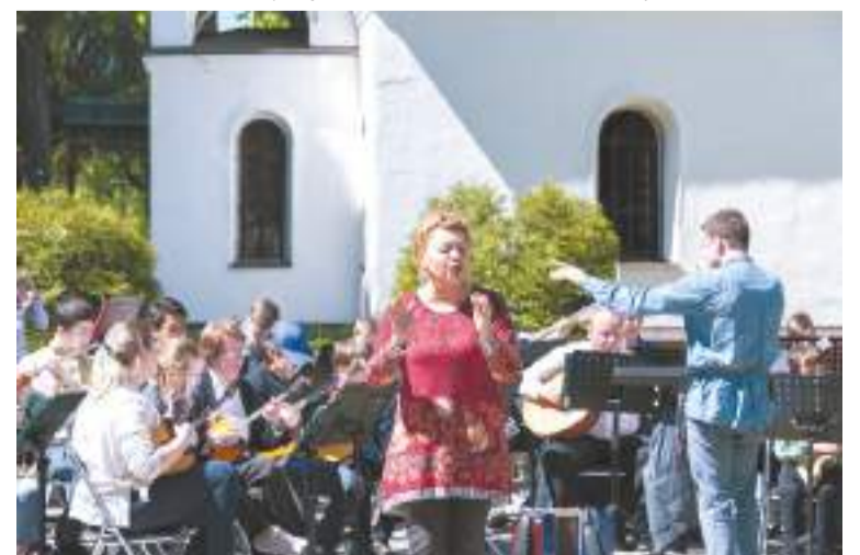
Впервые в этом году к акции присоединились Музей дороги и Музей А. Меня в Семхозе