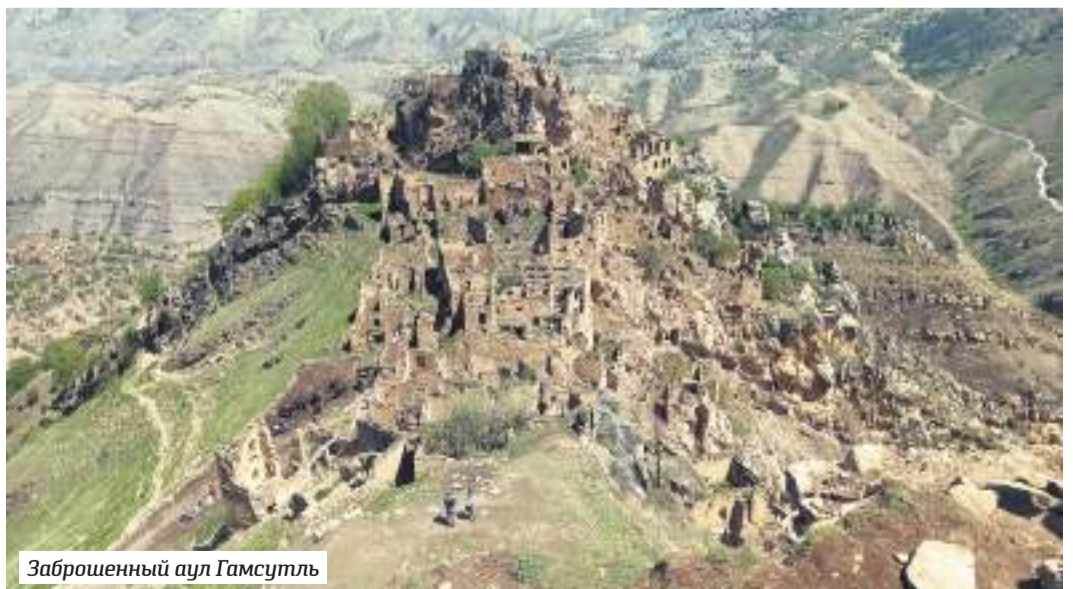
Заброшенный аул Гамсутль