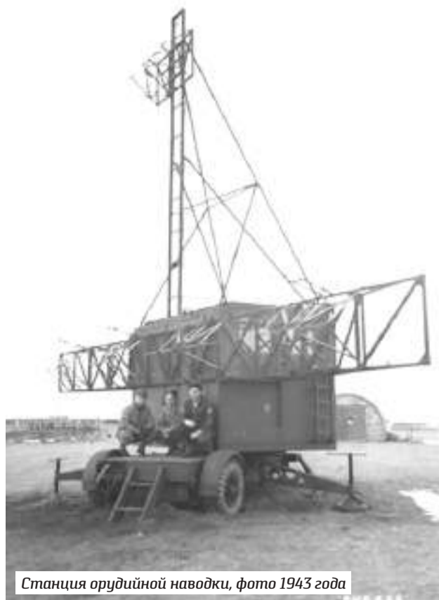
Станция орудийной наводки, фото 1943 года