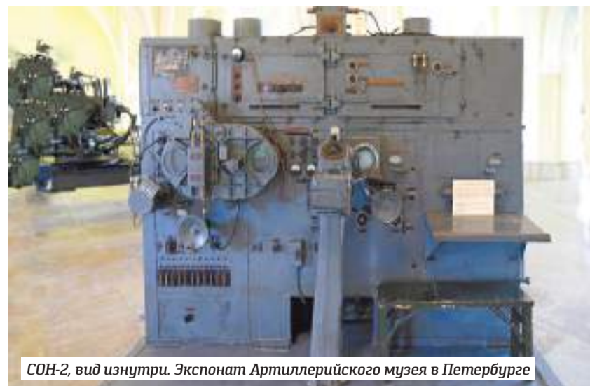
СОН-2, вид изнутри. Экспонат Артиллерийского музея в Петербурге