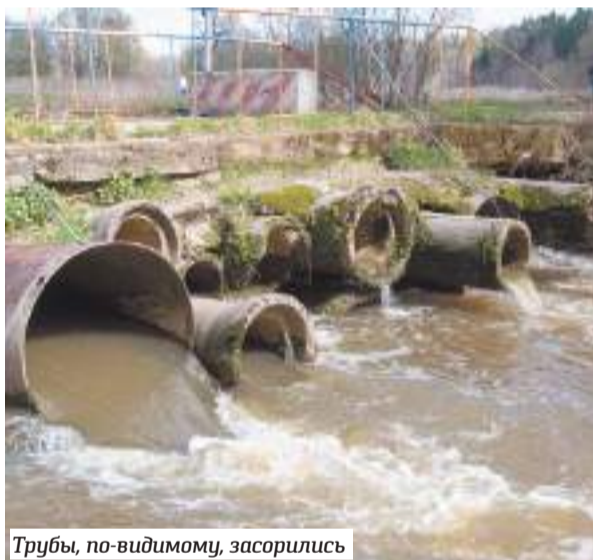
Трубы, по-видимому, засорились