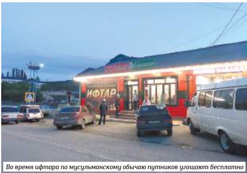
Во время ифтара по мусульманскому обычаю путников угощают бесплатно

Кто не знает, у мусульман это разговение, вечерний приём пищи во время месяца Рамадан. Для путников на трассах здесь специально оборудуют столовые, где бесплатно поят и кормят всех желающих. Нас усадили