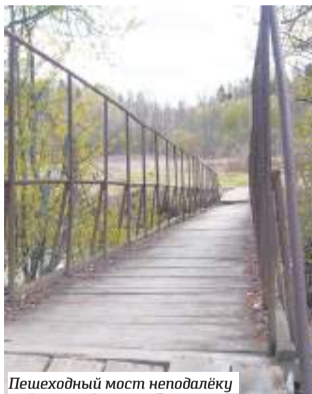
Пешеходный мост неподалёку

По-научному эта переправа называется «трубопереездом»: инженерное сооружение при устройстве дороги над водотоком, который проходит через трубы. Можно предположить, что подмывать её стало неспроста: трубы, по-видимому, чистились нерегулярно и постепенно забивались. Вода искала себе путь и нашла — в обход моста. Берег со стороны Зубцова обрушился, а с ним «ушла» и часть переправы. Передвигаться по остаткам моста сейчас очень опасно. Кто-то набросал куски шифера и доски, но бабушкам, что вполне понятно, здесь путь заказан. Чуть поодаль есть пешеходный мост, но он также нуждается в ремонте.