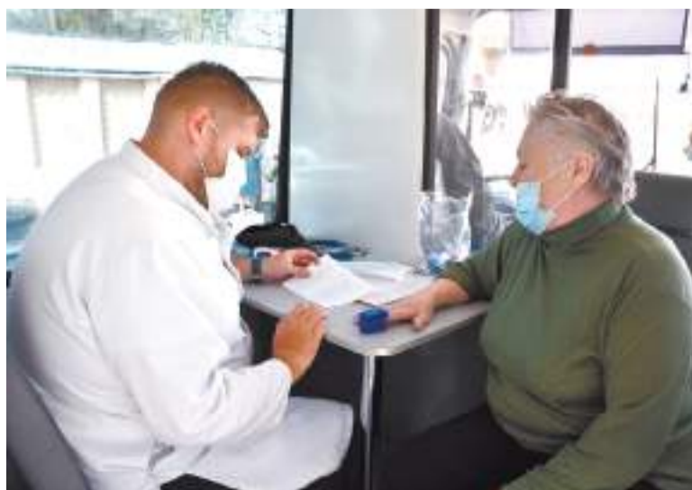
График работы мобильных бригад по вакцинации с 12 по 15 мая