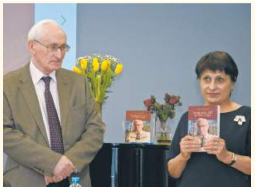
Презентация книги прошла в библиотеке им. А. Горловского