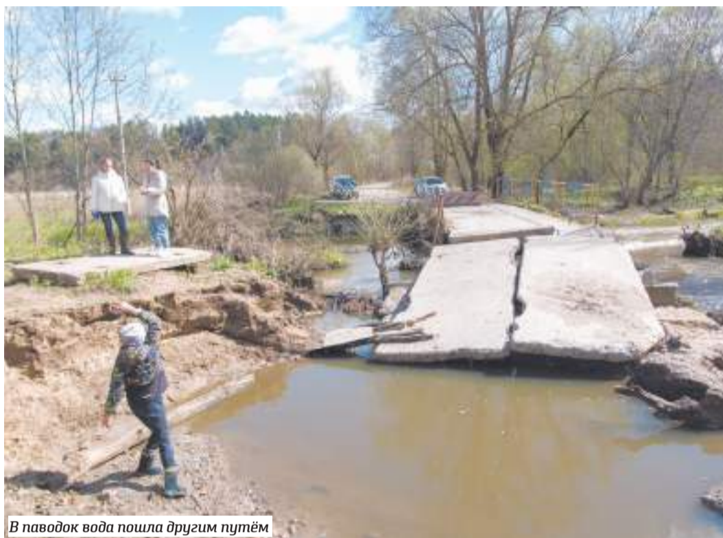
В паводок вода пошла другим путём

Учитывались ли при постройке какие-то строительные нормы? Сказать сложно. Местные жители утверждают, что существуют некие документы, подтверждающие законность возведения моста, но пока вживую их никто не видел.