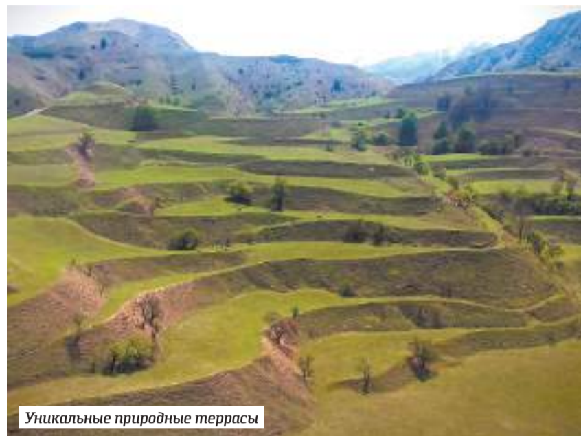
Уникальные природные террасы

Удобнее всего ехать до каньона из Махачкалы, расстояние составляет