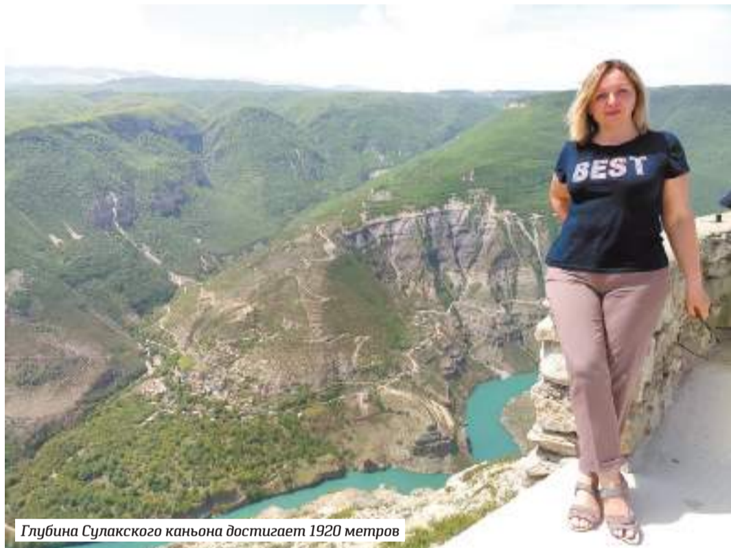
Глубина Сулакского каньона достигает 1920 метров

Начнём с того, что месяц Рамадан – не самое удачное время для гастроуторов. Большинство мест общественного питания днём в Дагестане закрыты, так как приём пищи и воды от рассвета до заката постящимся запрещён. Нам даже рекомендовали, если уж очень захочется днём покушать или попить, делать это не прилюдно.