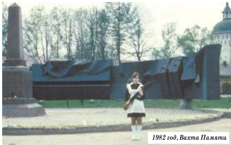
1982 год, Вихта Памяти