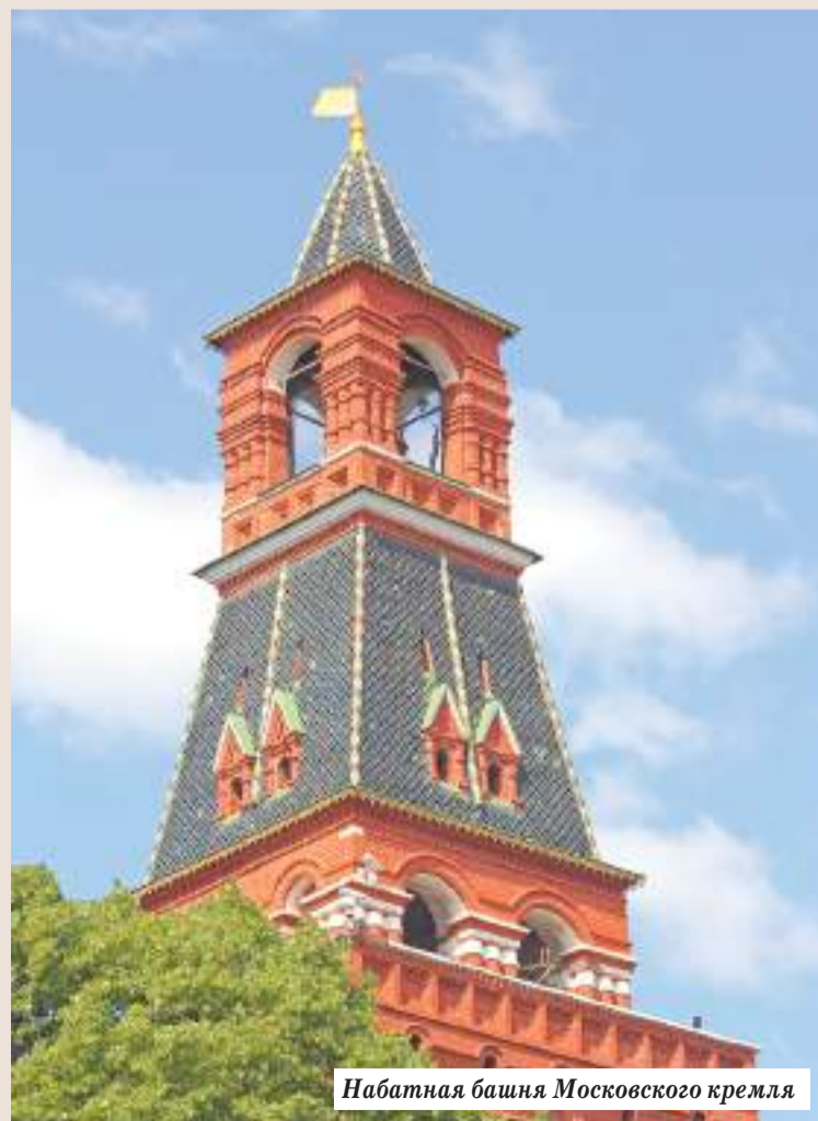
Набатная башня Московского кремля

Высота Каличьей башни — около сорока метров. В её нижнем двухсветном ярусе устроены ворота и белокаменная винтовая лестница с выходом на ограждённое парапетом гульбище. Второй ярус и шатёр пронизывает возобновленная в 1978 году деревянная винтовая лестница с четырьмя «выходными для отдохновения площадками». Последняя площадка устроена в небольшом световом фанаре. Отсюда открывается панорама Троице-Сергиевой лавры и Сергиева Посада.