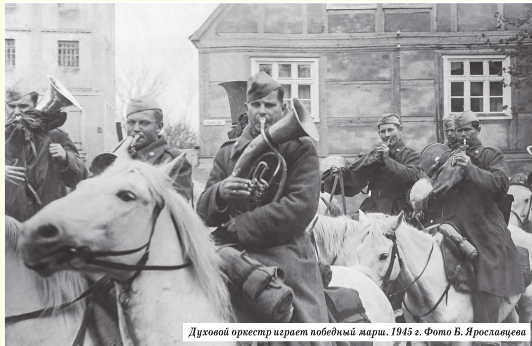
Духовой оркестр играет победный марш. 1945 г.