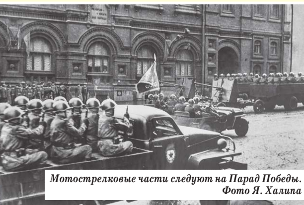
Мотострелковые части следуют на Парад Победы.