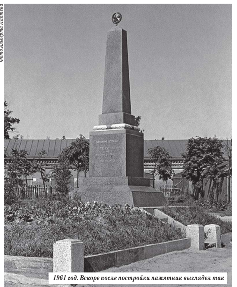
1961 год. Вскоре после постройки памятник выглядел так

талях Загорска. 21 солдат, похороненный в этом месте, — в общем списке павших.