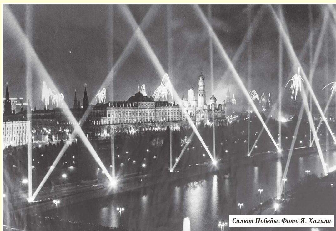
Салют Победы.