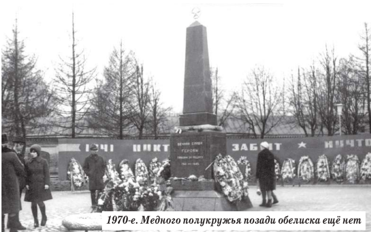
1970-е. Медного полукружья позади обелиска ещё нет

К сожалению, по сей день остаётся неясной судьба братских воинских захоронений, существовавших (и, вероятно, до сих пор существующих) на закрытом Никольском кладбище в Сергиевом Посаде. Во время войны там хоронили воинов, умерших в госпиталях, в том числе во время Московской битвы 1941 года. Старожилы вспоминали, что таких могил там было несколько, и вплоть до 1960-х годов за ними централизованно ухаживали. Сегодня их точное местонахождение неизвестно — только предполагается... Долг памяти обязывает нас когда-либо поставить точку в этом вопросе. Напомним, что в 2016 году Никольское кладбище занесено в реестр объектов культурного наследия Московской области и, как минимум, его застройку можно теперь не опасаться.