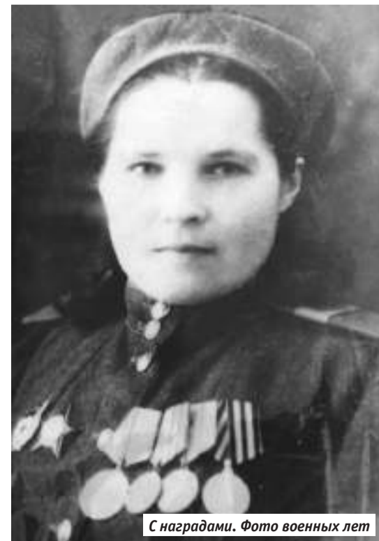
С наградами. Фото военных лет