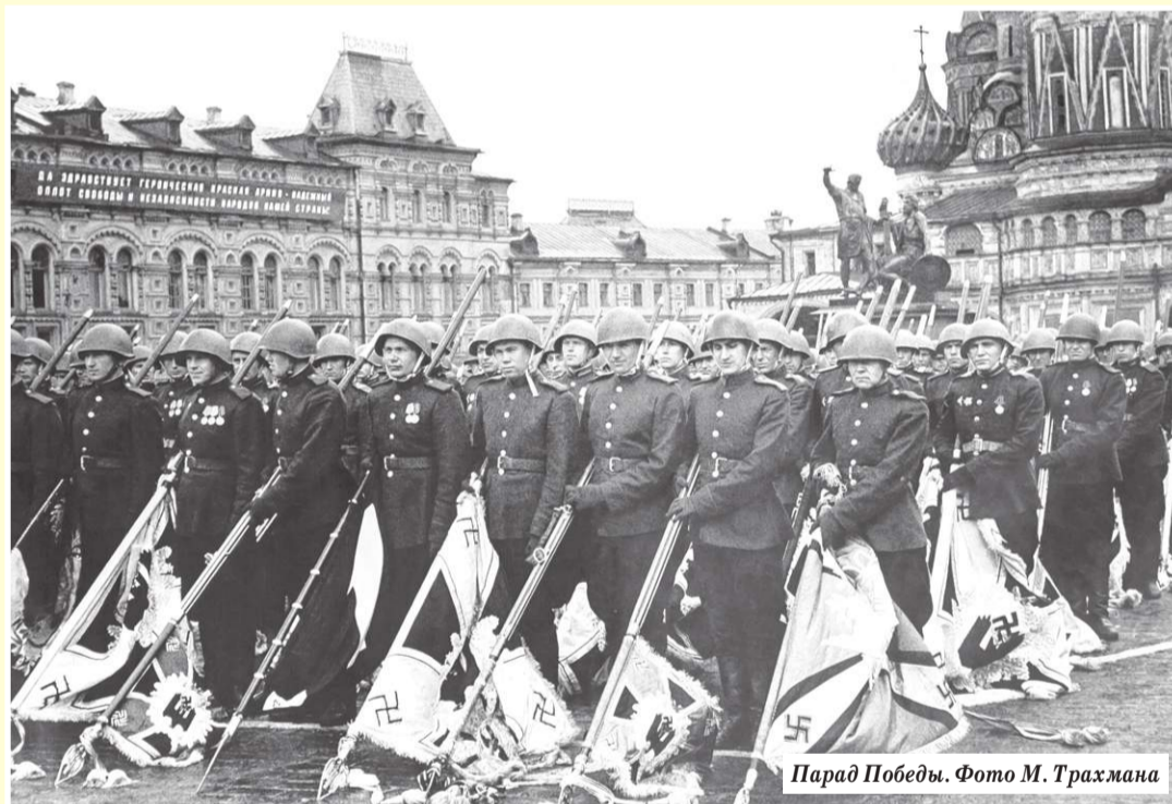
Парад Победы.