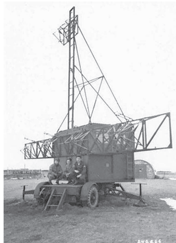
Станция орудийной наводки, фото 1943 года