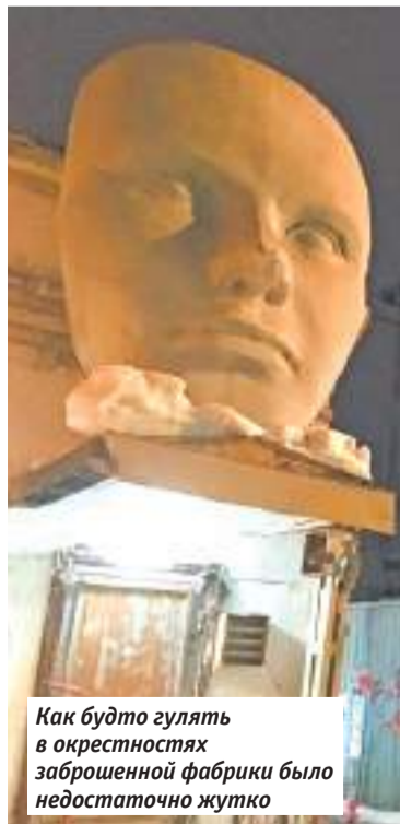
Как будто гулять в окрестностях заброшенной фабрики было недостаточно жутко

Закончим описание хронологически правильно: современностью. С самого начала город вызывает ощущение «1000 и 1 ночи» в форме комикса — восточных сказок, рассказанных на языке жёсткого маркетинга. Создали такую картинку совсем недавно, рисуя