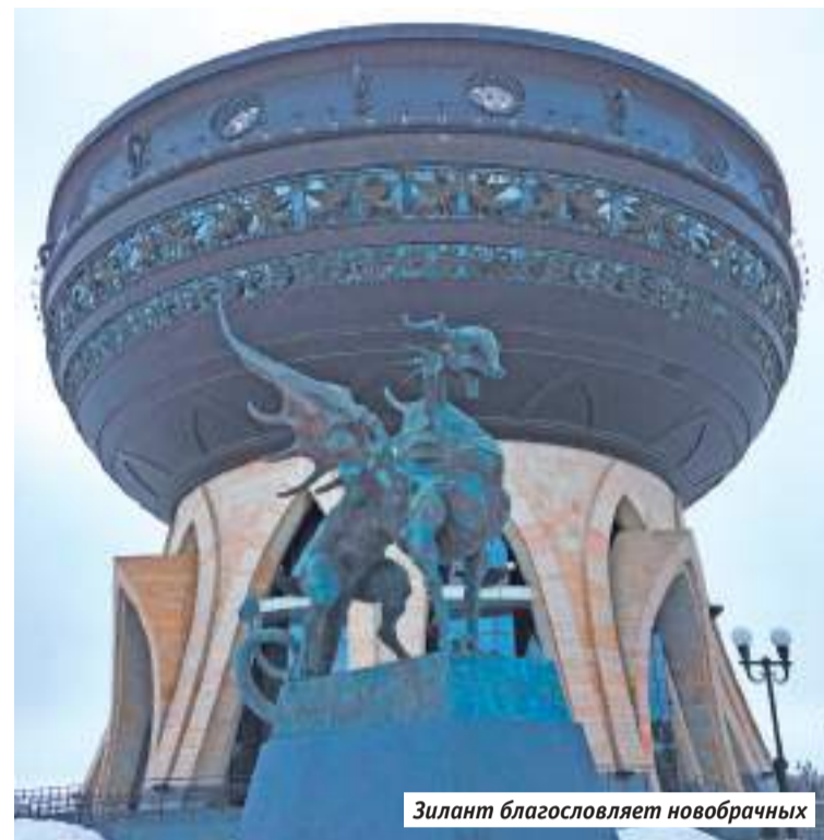
Зилант благословляет новобрачных

Венец же современной кичевой сказочности — похожий на летающую тарелку дворец бракосочетания Казань. «Чашу», говорят, строили под что-то другое, но в итоге её отдали молодожёнам, а для украшения добавили скульптуры. Одна из них стала предметом шуток всех казанских свадеб. Зилант — чёрный мифический змей, символ города, внезапно обрёл подружку. Причём Зилантиха, по версии скульпторов, получила потомство, а заодно внезапные для рептилии молочные железы.