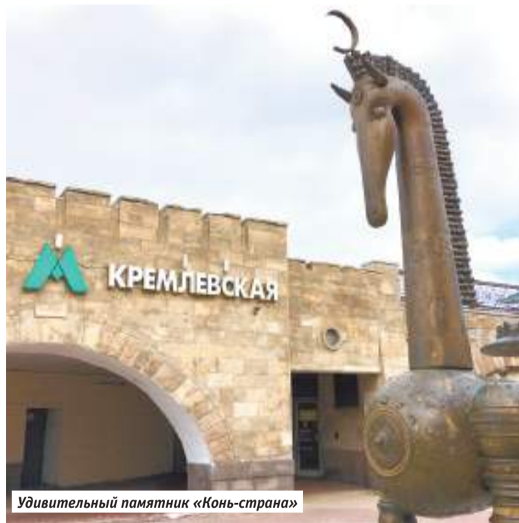
Удивительный памятник «Конь-страна»

Уезжал отсюда по мосту «Миллениум», построенному к тысячелетию города, а заодно, как в шутку говорят местные, намекающему на нынешний правящий клан Казани — буква «М» на момент строительства была первой в имени президента и фамилии премьера республики.