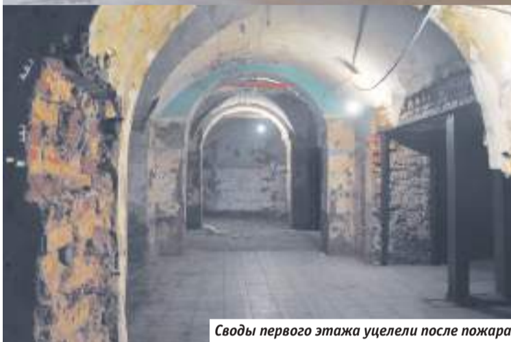
Своды первого этажа уцелили после пожара