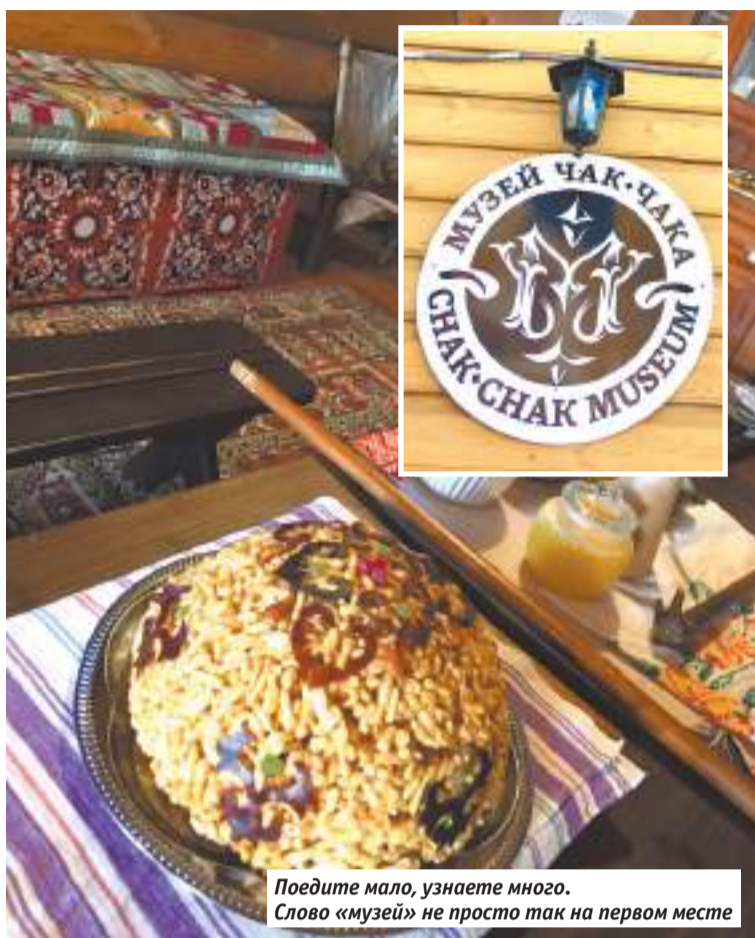
Поешьте мало, узнаете много. Слово «музей» не просто так на первом месте