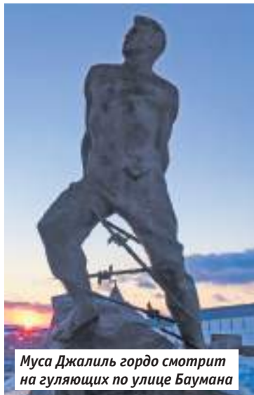
Муса Джалиль гордо смотрит на гуляющих по улице Баумана