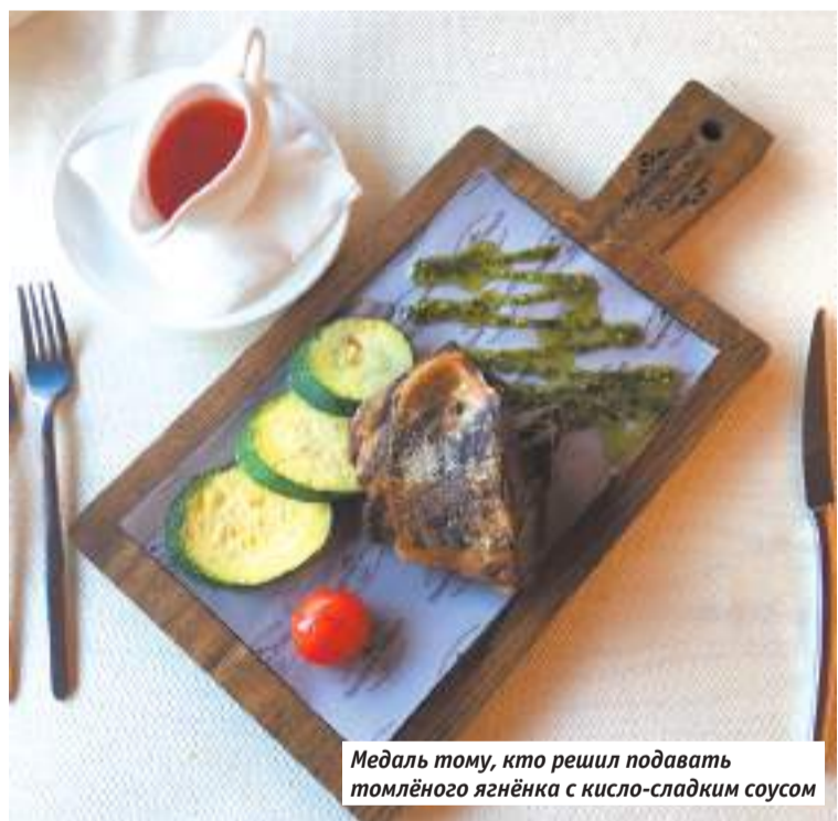
Медаль тому, кто решил подавать томлёного ягнёнка с кисло-сладким соусом

Район чуть ли не полностью отведён под всё «традиционно татарское» — здесь вы быстро погрузитесь в национальный быт (вроде музея чак-чака в одном из старых купеческих домов) и культуру. Музей Габдуллы Тукая, «татарское всё» по аналогии с Пушкиным, располагается неподалёку от центральной районной площади, а за ней жилые кварталы с характерным стрит-артом на стенах.