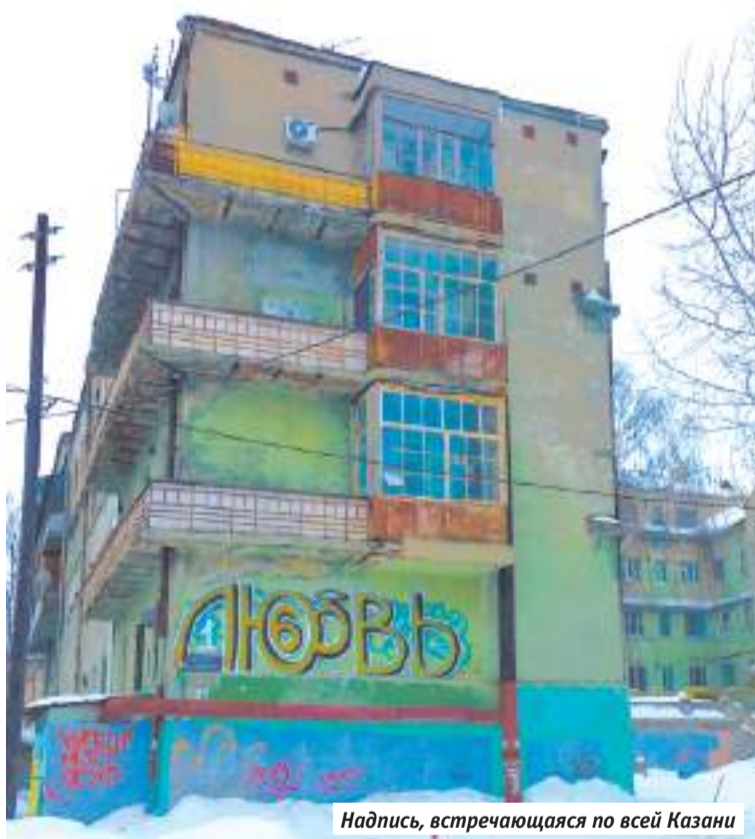
Надпись, встречающаяся по всей Казани

«жидким золотом» — на город в последнее десятилетие пролился настоящий денежный дождь.