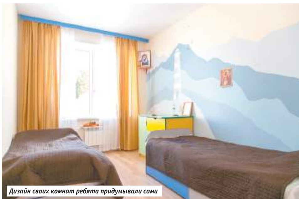
Дизайн своих комнат ребята придумывали сами