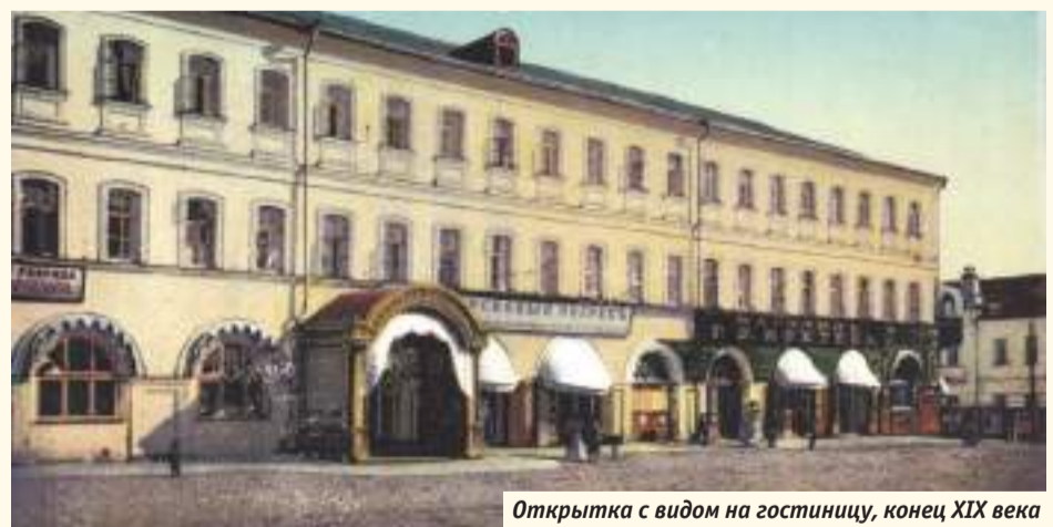
Открытка с видом на гостиницу, конец XIX века

Распад СССР никак не сказался на его судьбе: бывшая гостиница осталась в собственности города, её обслуживанием занимался МУП «Дом». Под этим именем (Муниципальное предприятие «Дом» (Новая