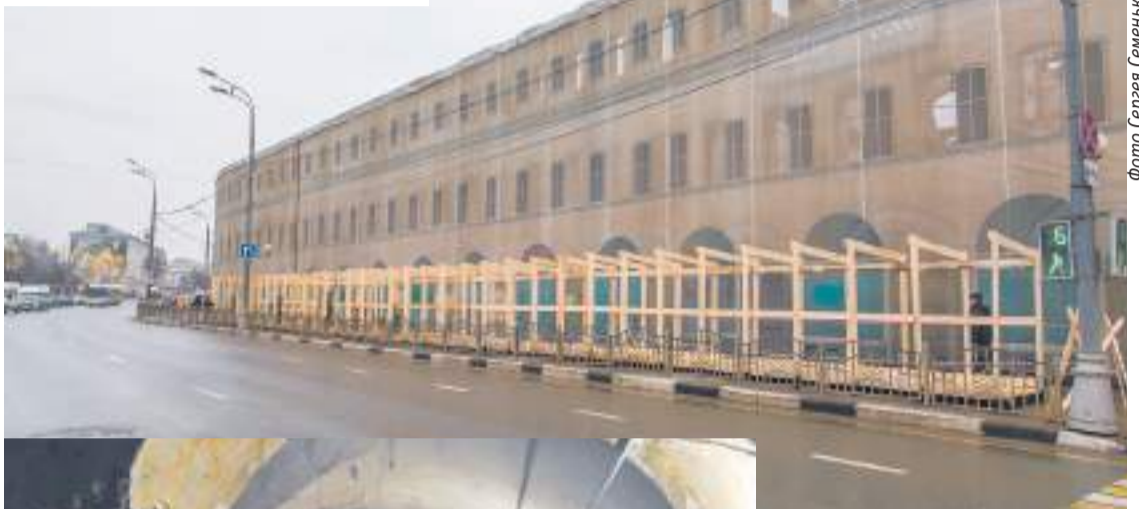
Здание окружат строительными лесами