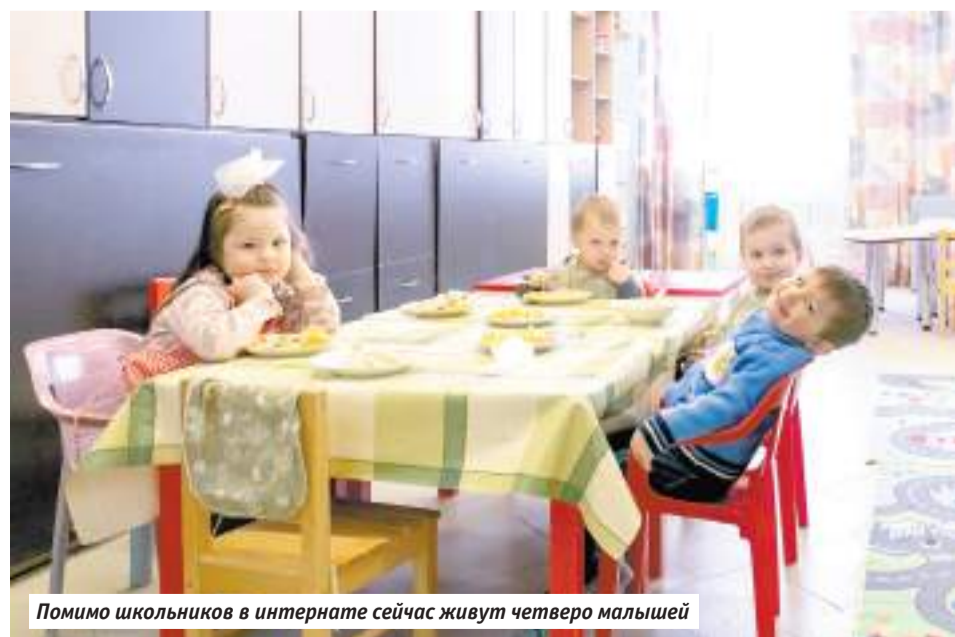
Помимо школьников в интернате сейчас живут четверо малышей