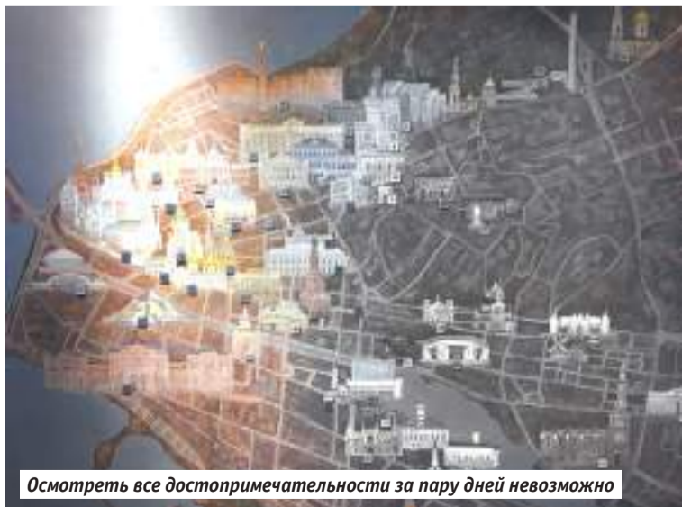
Осмотреть все достопримечательности за пару дней невозможно