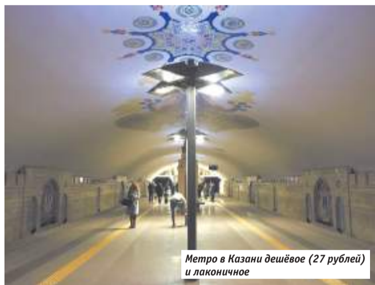
Метро в Казани дешёвое (27 рублей) и лаконичное