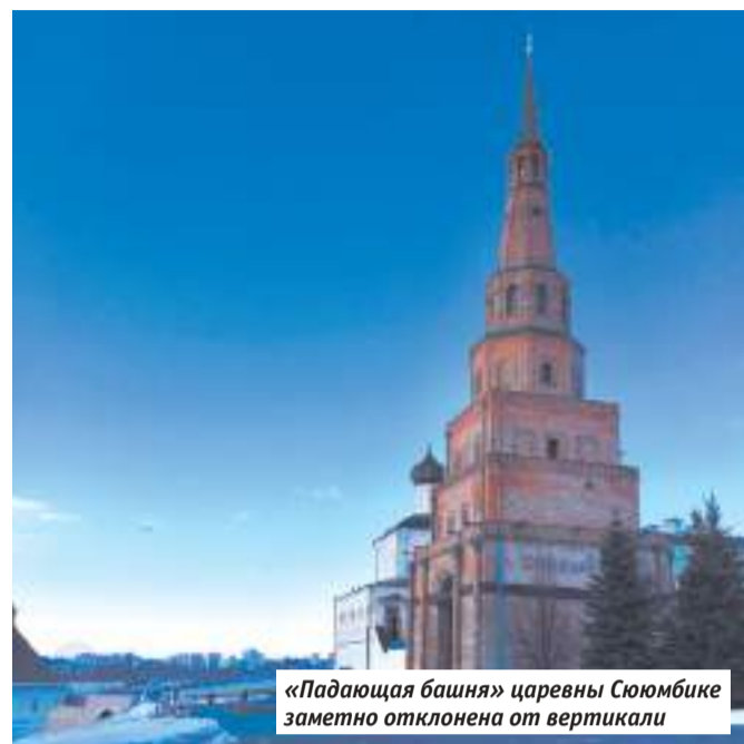
«Падающая башня» царевны Сююмбике заметно отклонена от вертикали