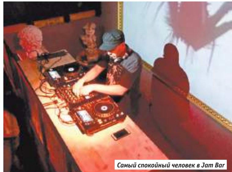
Самый спокойный человек в Jam Bar