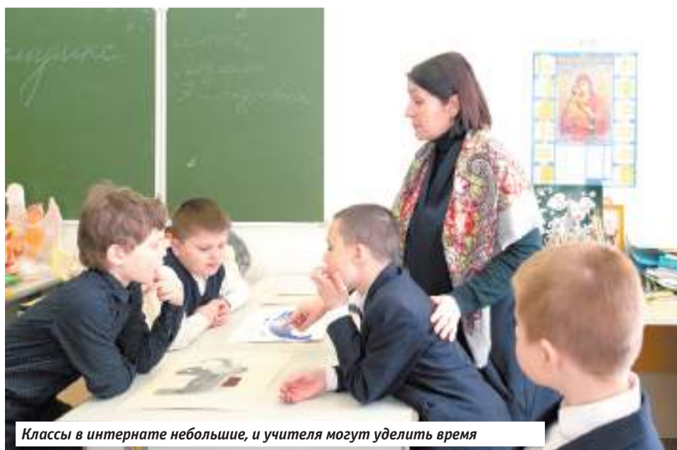
Классы в интернате небольшие, и учителя могут уделить время

Евгения Кинтушева