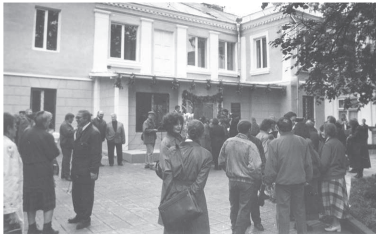
Открытие Краеведческого корпуса в Овражном переулке. 1998 г.

Сотрудники отдела много внимания уделяют литературному краеведению, обращаясь к творчеству поэтов и писателей, которые были тесно связаны с Сергиевым Посадом. Особое место занимает творчество М. М. Пришвина. В загорский период своей деятельности он раскрылся не только как писатель, но и как эколог, фотограф и краевед. Ак-