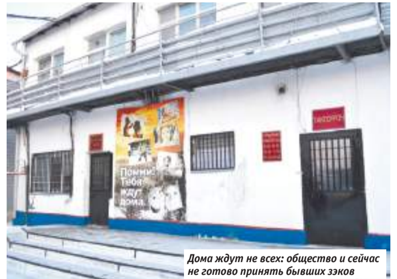
Дома ждут не всех: общество и сейчас не готово принять бывших эзков

И не слишком ли это идиллическая картинка — маленькое кафе на территории колонии, где даже есть автоматы с мороженым? Но и такое видели в российских коло-