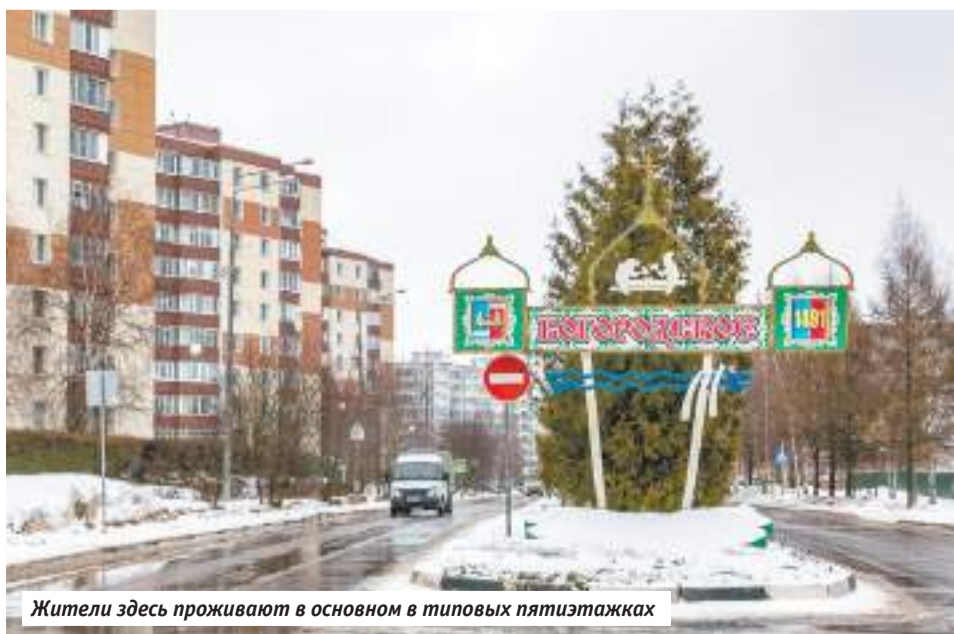
Жители здесь проживают в основном в типовых пятиэтажках