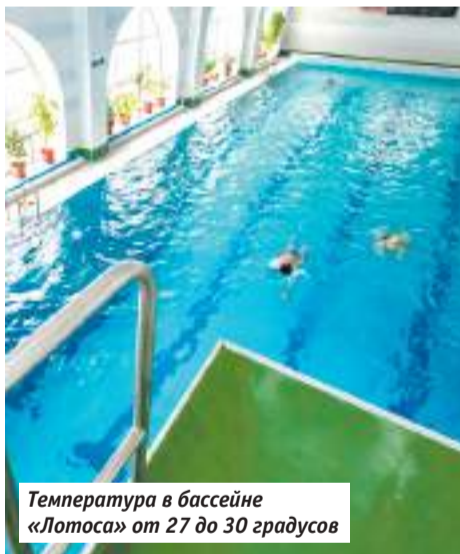
Температура в бассейне «Лотоса» от 27 до 30 градусов

С виду затея нехитрая, однако, чтобы мой сладкоежка резво барабанил лапами по бочке с мёдом, нужно знать, как грамотно крепить отвес. При условии, что инструктаж прослушан внимательно, с работой справляются все. А вот к росписи многие подходят уже творчески. Китайцы, например, часто красят бурого медведя под панду и вместо коворотки рисуют галстук и костюм. Такие вот метаморфозы со зверем.