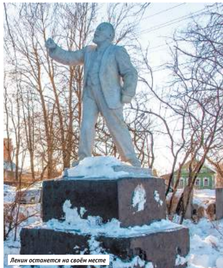
Ленин останется на своём месте