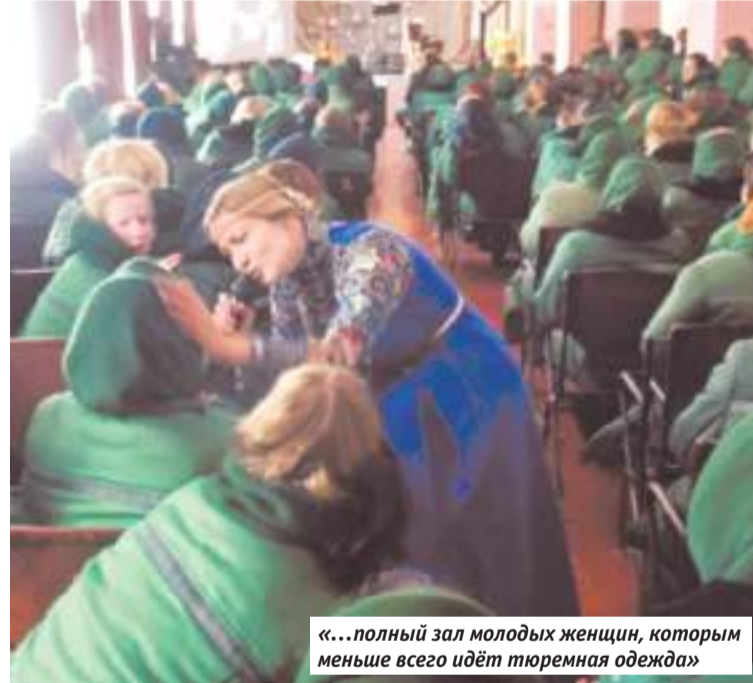
«...полный зал молодых женщин, которым меньше всего идёт тюремная одежда»

На литургии заключённые в мужской колонии молятся более истово, но на концертах ведут себя скованно, раскаты мужскую аудиторию в тюрьмах намного сложнее, чем женскую. Проявлять эмоции для этих мужчин — если не признак слабости, но что-то такое, для