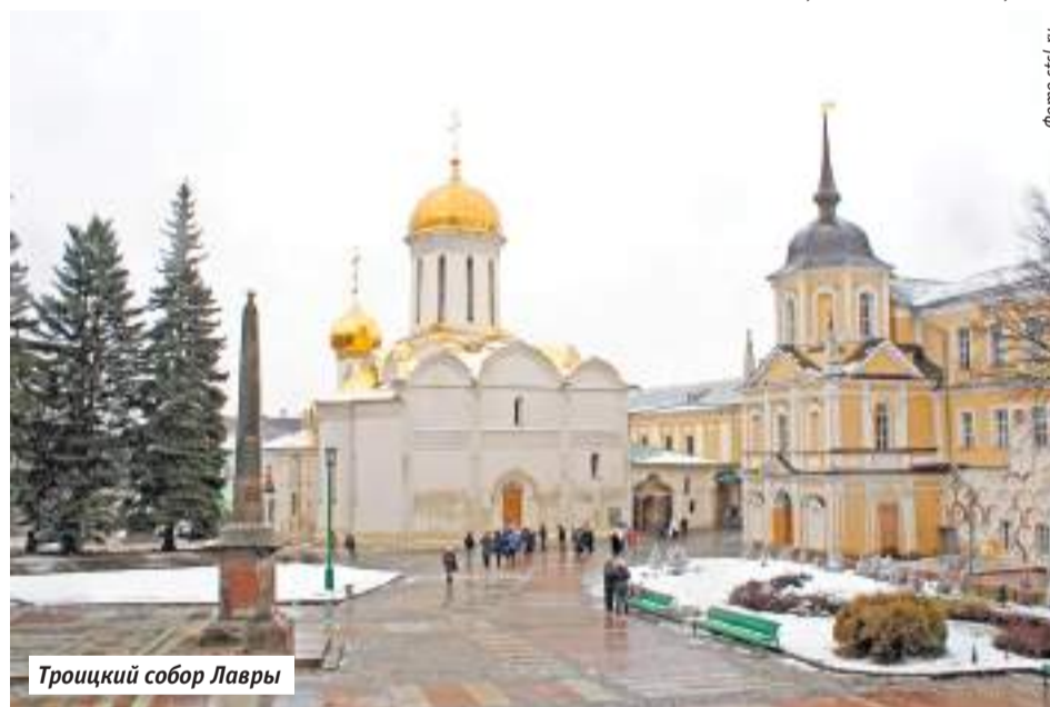
Троицкий собор Лавры