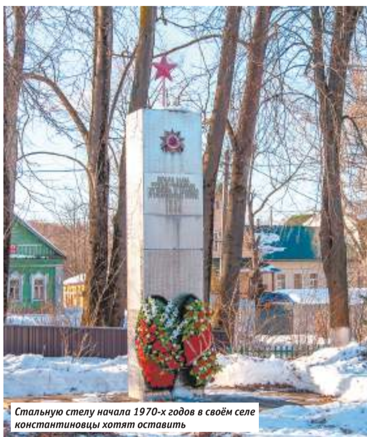
Стальную стелу начала 1970-х годов в своём селе константиновцы хотят оставить

Стальную стелу начала 1970-х годов в своём селе константиновцы хотят оставить, но не в прежнем виде, а дополнив табличками с именами земляков, вернувшихся