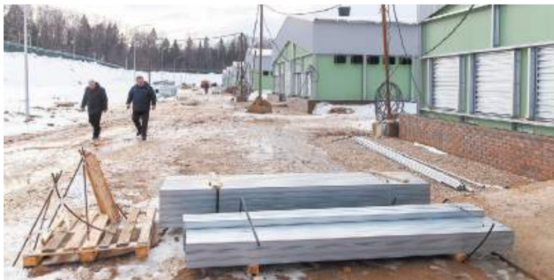
Дамир ШАБАЛЕЕВ | © «Вперёд»