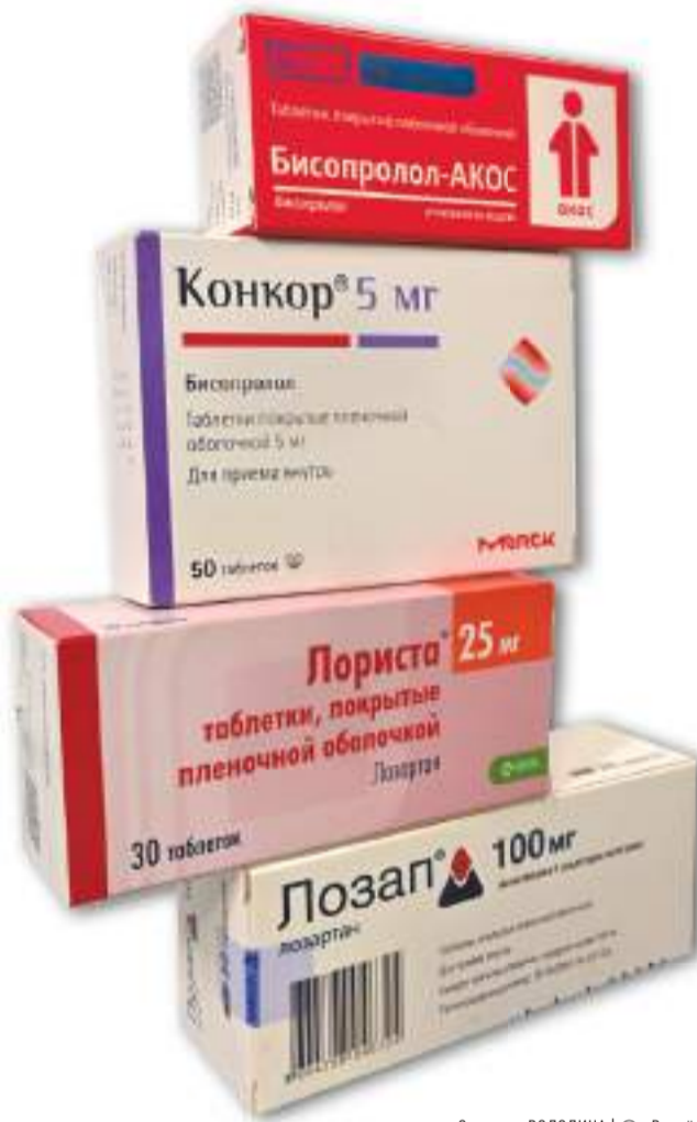
Светлана ВОЛОДИНА | © «Вперёд»

— Вспомогательные вещества в дженериках действительно отличаются от оригиналов, а потому иногда могут сами по себе вызывать разные побочные эффекты. Различные примеси способны вызывать аллергические и токсические действия. Однако препараты, которые выходят на российский рынок, всегда подвергаются обязательной