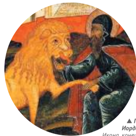
▲ Герасим Иорданский. Икона, конец XVII в.

Почему изображения животных на иконах такие необычные?