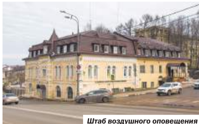
Штаб воздушного оповещения

Наш путь начался с одного из самых высоких мест в Сергиевом Посаде, на подъёме у пересечения проспекта Красной Армии и Рыбной улицы, что идёт в сторону вокзала. Если смотреть на Келарку, то по правую руку на проспекте окажется двухэтажный дом № 96, где жизнь сегодня довольно пёстрая: тут и хостел, и курсы иностранных языков, и косметический кабинет. В годы войны отсюда координировалась вся система наблюдения и оповещения в случае авианалётов. Другими словами, здесь объявляли воздушную тревогу, из этого здания управляли военными прожекторами и заградительными аэростатами.