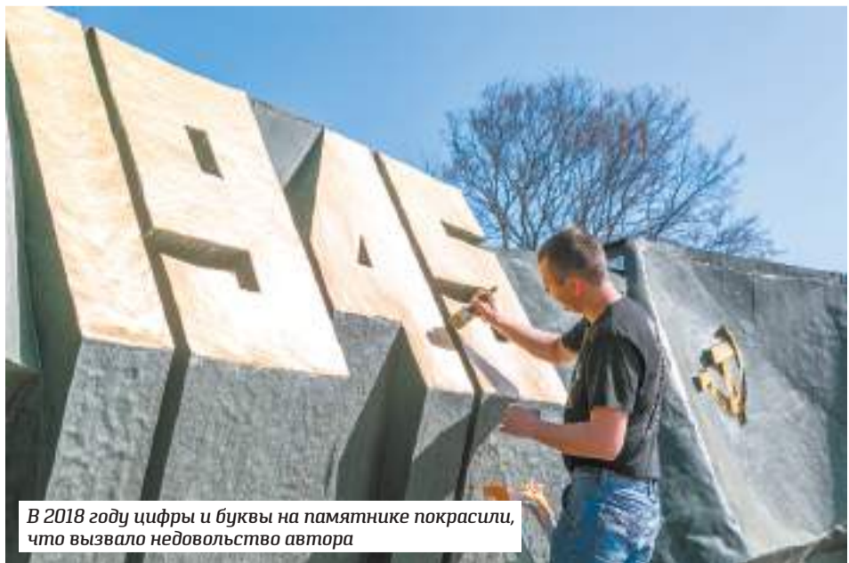
В 2018 году цифры и буквы на памятнике покрасили, что вызвало недовольство автора