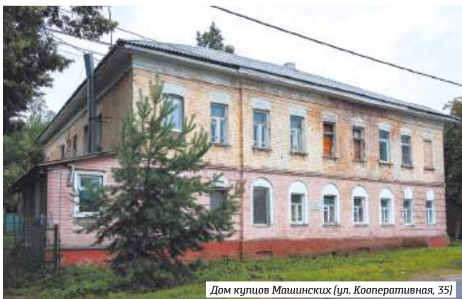
Дом купцов Машинских (ул. Кооперативная, 35)