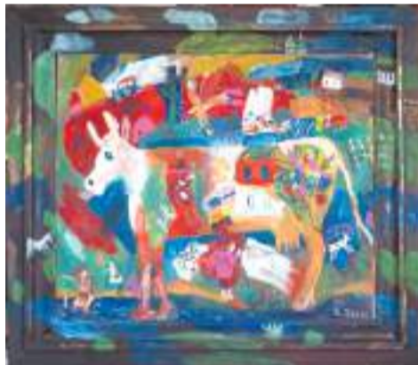
«Деревня», 2004 год