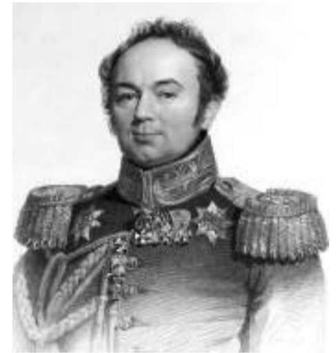
Граф А. А. Закревский

ской улице (ныне это улицы Карла Маркса и Вифанская. — Прим. ред. ). В её центре — дом, отделённый от улицы палисадником, за домом сад с прудом, по сторонам дома флигеля и службы. Усадьба построена в первой четверти XIX века представителями княжеского рода Голицыных. Сохранился лишь главный дом. Это одноэтажное строение в стиле «ампир» с мезонином и четырёхколонным портиком остаётся старейшим и наиболее интересным деревянным зданием нашего города.