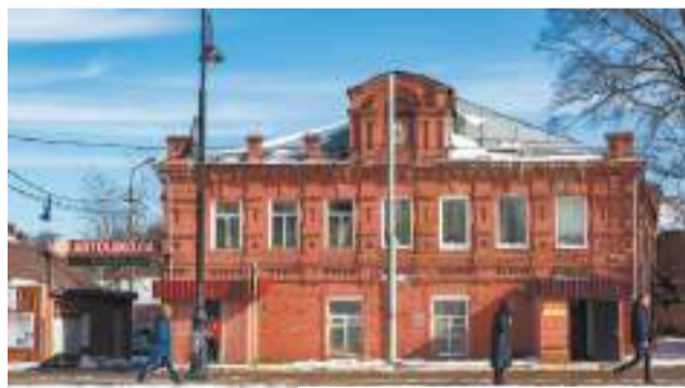
Военный механический завод

По другую сторону Лавры, под Блинной горой, есть здание, долгие годы ассоциировавшееся с обществом ДОСААФ, но сто лет здесь находился механический завод. И до войны там делали вентиляторы для танков, а после 1941 года литейный цех переоборудовали под отливку корпусов гранат и шрапнели. Форму для отливки делали тут же, из грунта с берегов Кончуры. Адрес — Вознесенская улица, 17.