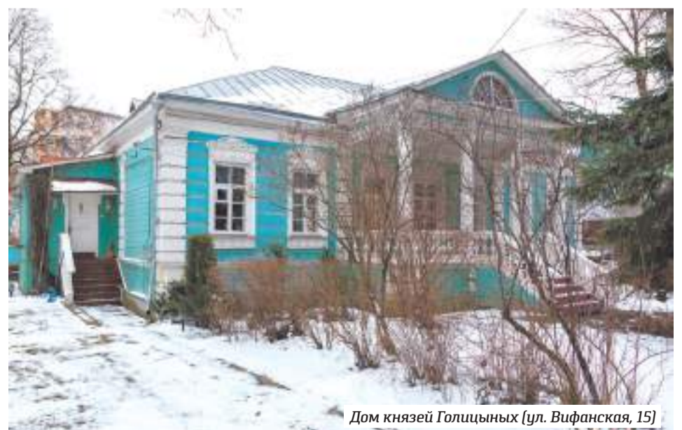
Дом князей Голицыных (ул. Вифанская, 15)