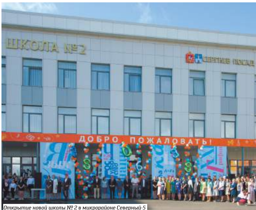
Открытие новой школы № 2 в микрорайоне Северный-5

Не секрет, что увесистая часть расходов муниципального бюджета по статье «социальная сфера» идёт на образование. В 2013 году на эти нужды выделялось менее 2 миллиардов рублей. Спустя год ассигнования выросли почти вдвое — до 3,6 миллиарда. В 2015-м продолжился рост по этой важной статье — до 4 миллиардов. В 2016-м планку удалось сохранить и даже чуть повысить — примерно на 100 миллионов. С 2020 по 2024 годы на нужды образования предполагается тратить по 4,5 миллиарда рублей ежегодно, из которых более 3 миллиардов — средства Московской области.