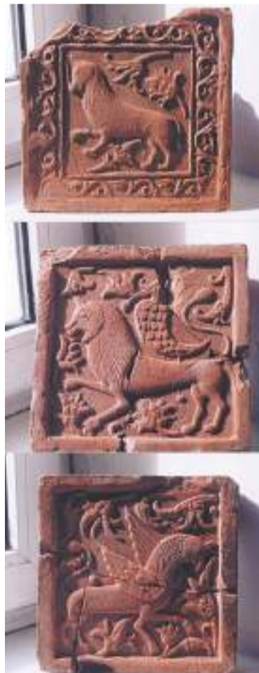
Изразец из Царицыных палат Троице-Сергиева монастыря, XVII век

В августе прошлого года музею-заповеднику пришлось провести целую выставку, чтобы показать все находки археологов, извлечённые за последние годы на поверхность в окрестностях Лавры.