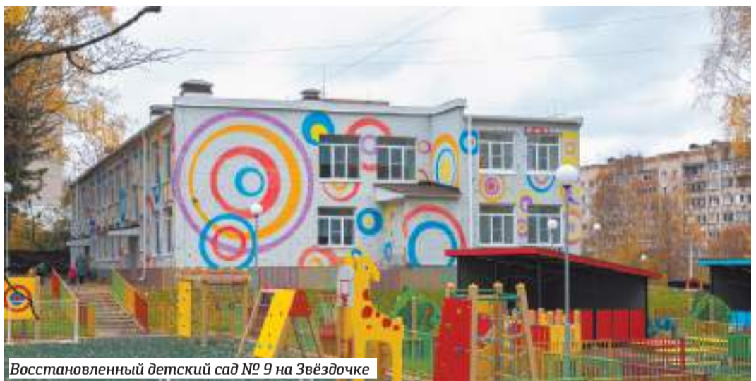
Восстановленный детский сад № 9 на Звёздочке

О кризисе среднего профессионального образования в последние лет 30 не говорил только ленивый. На рынке труда в России возникла в чём-то парадоксальная ситуация: предприятия жаловались на нехватку прямых умелых рук и одновременно не брали на работу выпускников училищ и техникумов. Детальный анализ проблемы говорил о том, что прежняя система подготовки профи на базе девяти классов морально и физически устарела. Требовались принципиально новые подходы и учебные заведения.