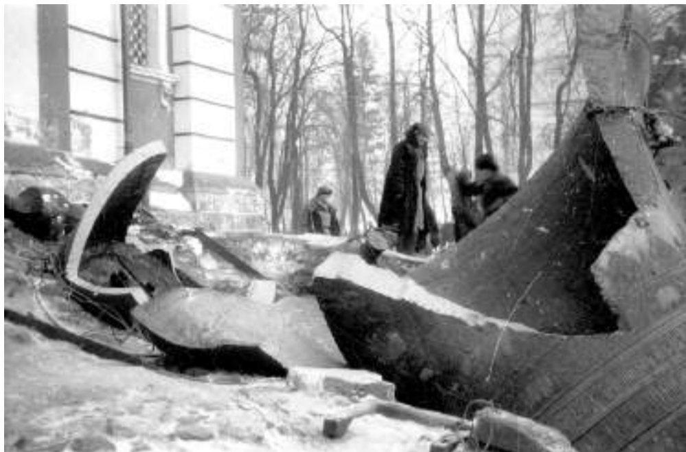
Серия фотографий М. Пришвина «Когда били колокола» действительно уникальна