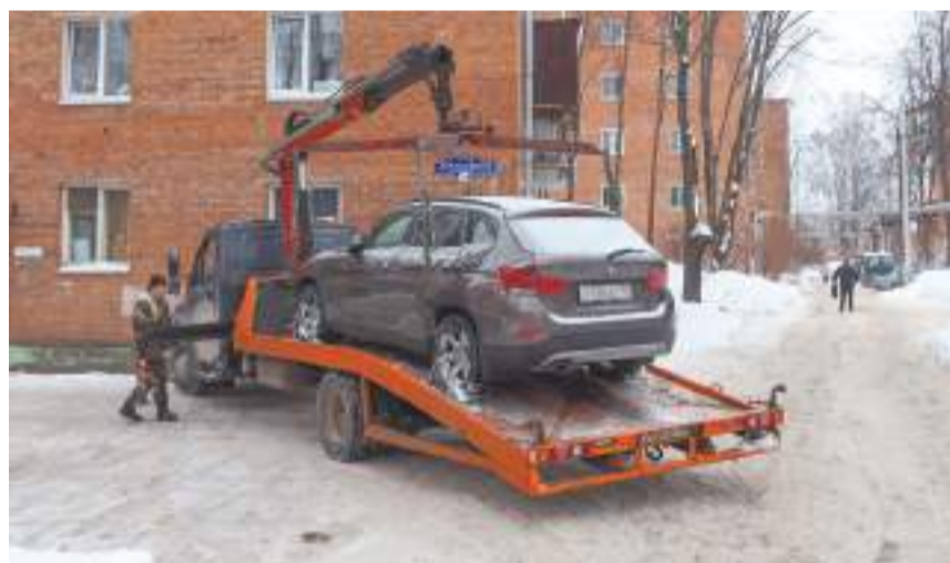
Дамир ШВАЛБЕЕВ | © «Вперёд»