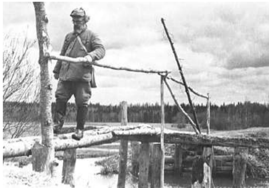
Будучи заядлым охотником, писатель обошёл все окрестные леса на много километров вокруг. Полученные впечатления потом отражались в книгах