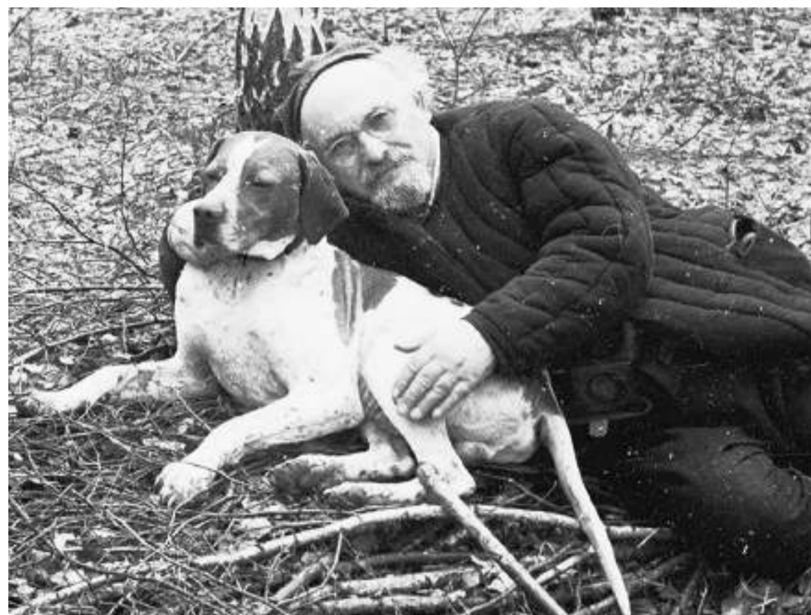
«Собаки вывели меня в люди», — говорил М. Пришвин