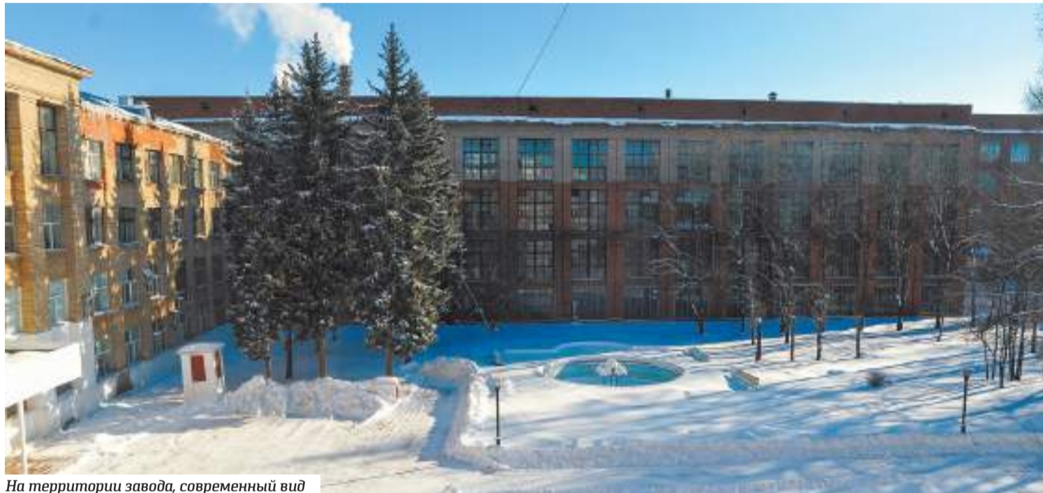
На территории завода, современный вид

М ы начинаем серию публикаций, посвящённую предприятиям Сергиево-Посадского округа — ныне существующим и уже ушедшим в Историю. Когда-то Загорский район был одним из самых промышленно развитых в Московской области, а на расположенных в нашем городе гигантах индустрии трудились десятки тысяч человек. Что стало с этими заводами и фабриками? Кто смог пережить лихие девяностые и найти себя в новом мире рыночных отношений? Наш первый очерк посвящён ЗОМЗу, когда-то одному из крупнейших в СССР предприятий оптической промышленности.