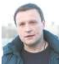
Сергей ПАХОМОВ, депутат Государственной Думы:

М одернизация коммунальных сетей в Сергиевом Посаде — стратегическая задача, которую мы выполняем. К сожалению, сразу исправить всё, что 40 лет не приводилось в порядок, невозможно. Мы начинаем с самых важных с точки зрения работы системы узлов. Нас в этом поддерживает и региональное, и федеральное правительство. Реконструкция главного коллектора, строительство современных очистных сооружений, изменение принципов обслуживания ливнёвой канализации — всё это звенья одной цепи, которая должна быть максимально крепкой. Всем скептикам хочу сказать: мы не мечтаем, а делаем. Потратили несколько лет на проектную документацию, согласования и обоснования, но в данном случае лучше всё сделать один раз и основательно.