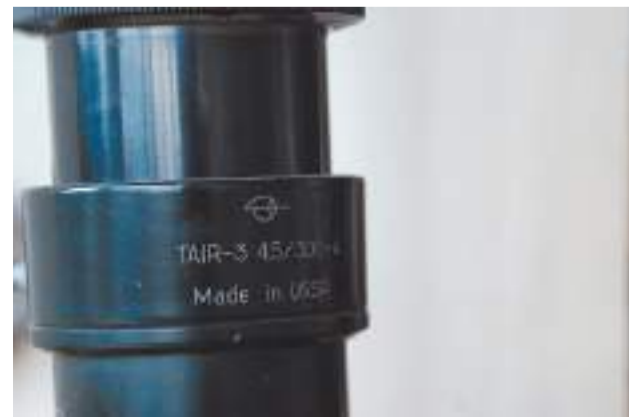
Знаменитый объектив «Таир-3»