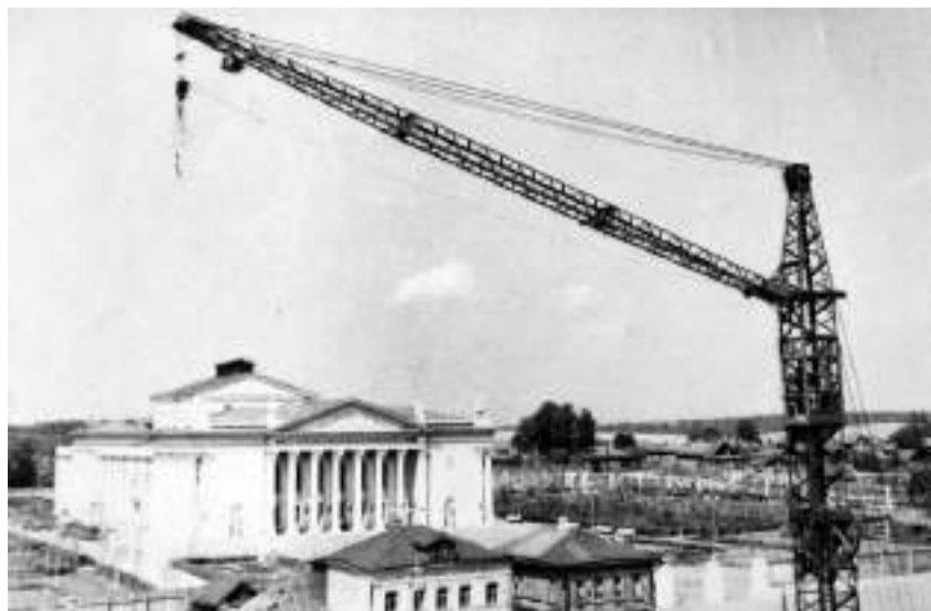
Дворец культуры вскоре после постройки

Пока шла стройка, первые цеха оптического производства открылись на территории Троице-Сергиева монастыря. А 7 ноября в честь 18-й годовщины Октябрьской революции праздничная демонстрация переросла в митинг и торжественную закладку камня в фундамент оптического завода. Этот день принято считать днём рождения ЗОМЗа.