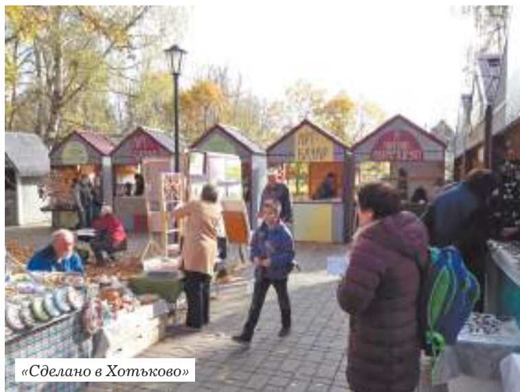
«Сделано в Хотьково»