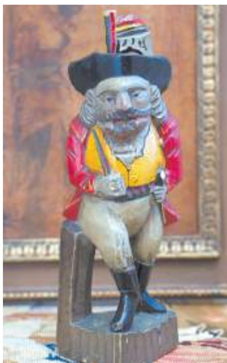
Щелкун. XIX век. Работа сергиевских мастеров

Щелкунчик получил небывалую популярность благодаря знаменитой сказке Эрнста Теодора Амадея Гофмана. По сюжету игрушку дарят девочке Мари (Ма-