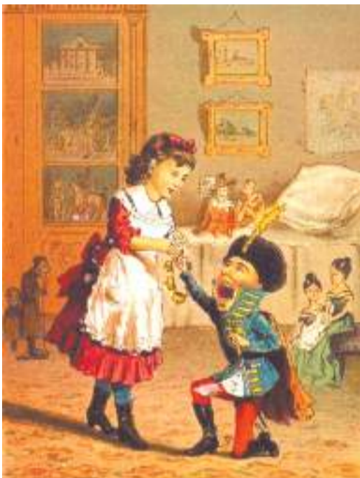
Иллюстрация В. Маковского

В немецком Нойхаузене существует музей щелкунчиков. Их там почти четыре тысячи, из разных стран мира, за всё время существования игрушки. Рост от 5 миллиметров до 6 метров. Считается, что это символ защиты дома.