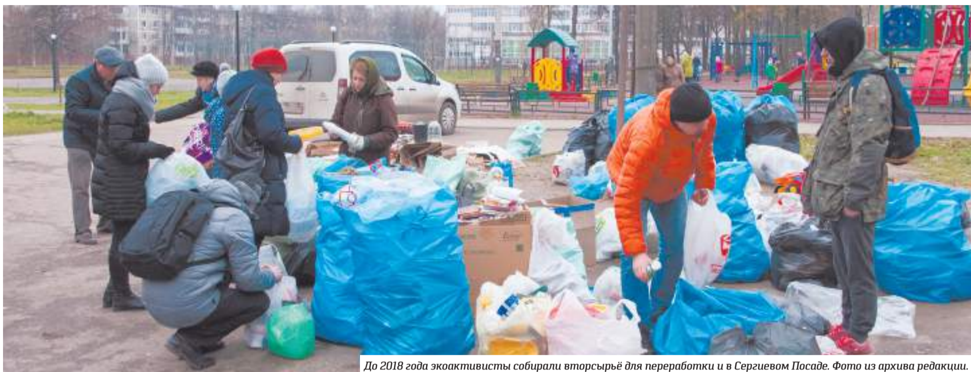
До 2018 года экоктивисты собирали вторсырьё для переработки и в Сергиевом Посаде.