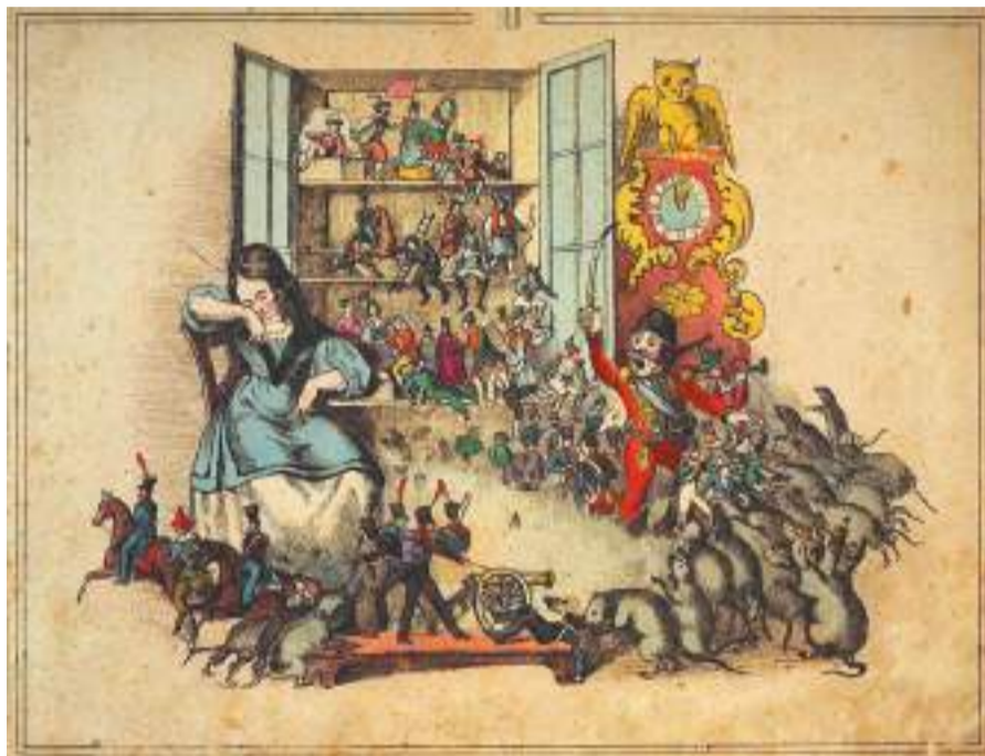
Петер Карл Гайсслер. «Сражение»

ИЗ РУДНЫХ ГОР — В СЕРГИЕВСКИЙ ПОСАД И БОГОРОДСКОЕ