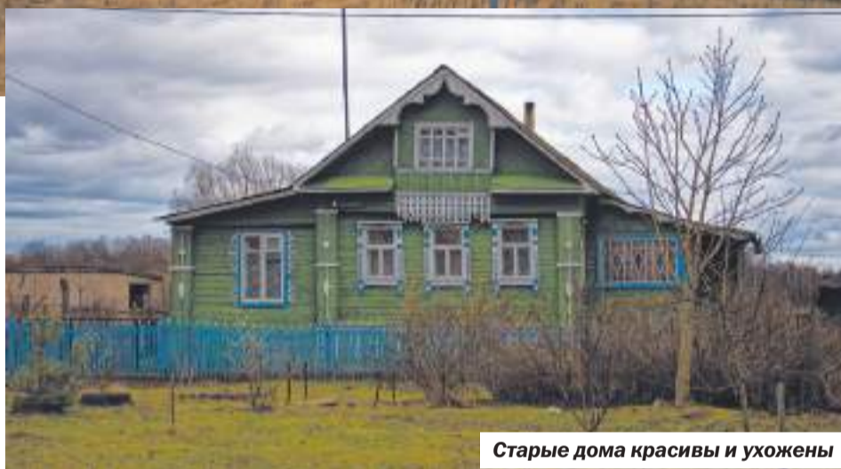
Старые дома красивы и ухожены