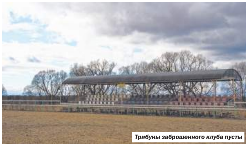
Трибуны заброшенного клуба пусты

Спортивный сезон в этом году был рекордно коротким. Он открылся далеко после новогодних праздников и закончился, по сути, в начале марта. Одним из самых заметных событий начала зимы стал забег «Николов Перевоз» на лыжной трассе