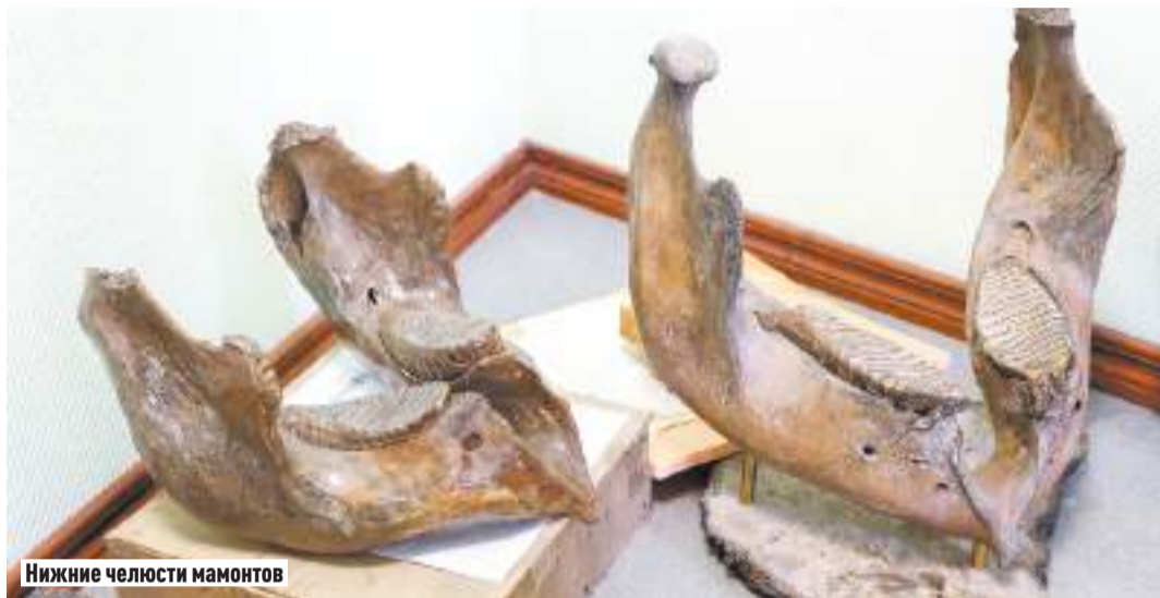
Нижние челюсти мамонтов