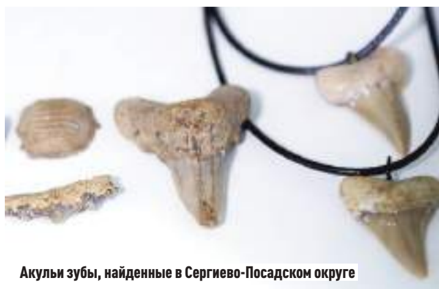
Акулы зубы, найденные в Сергиево-Посадском округе