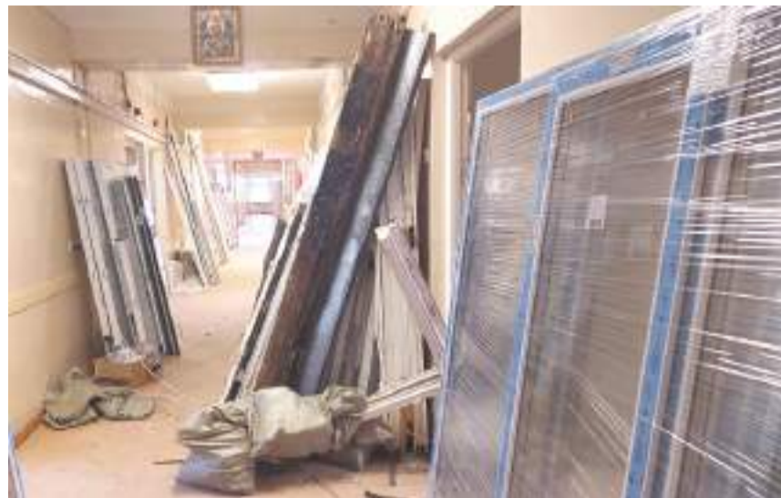
Татьяна МЕЛЬНИКОВА | © «Вперед»