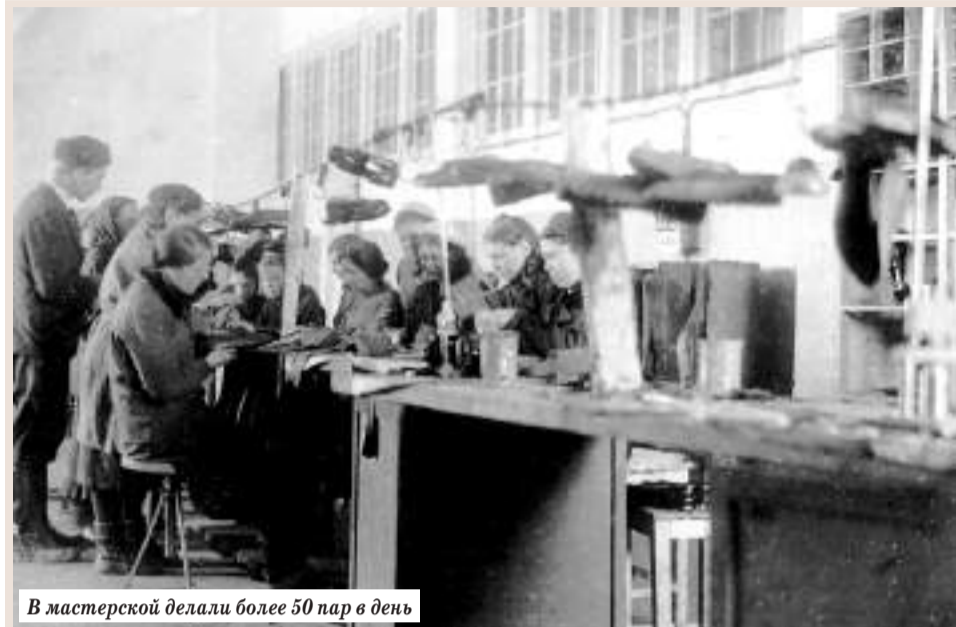
В мастерской делали более 50 пар в день

♦ 24 января 1969 года постановлением Совета Министров РСФСР город Загорск был включён в число городов «Золотого кольца России».