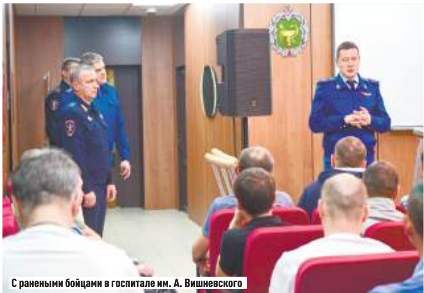
С ранеными бойцами в госпитале им. А. Вишневого

— Стрелок «Гранд-Парка» уже несколько месяцев держит в страхе жителей квартала. На его счету несколько жертв, но дело так и оста-