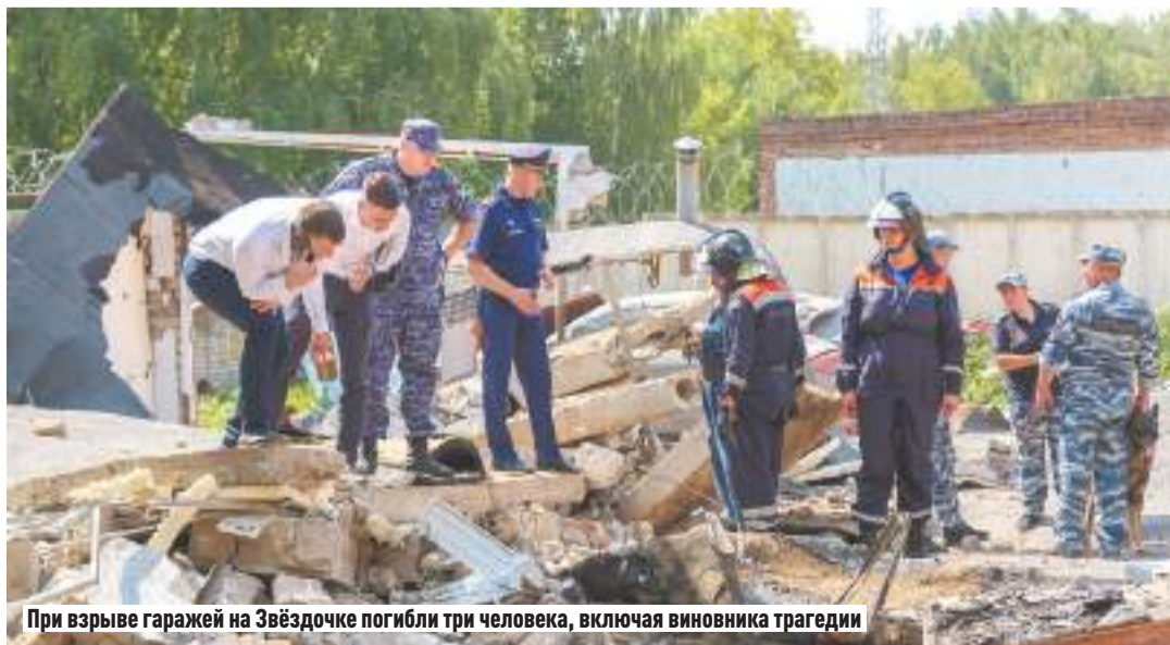
При взрыве гаражей на Звёздочке погибли три человека, включая виновника трагедии