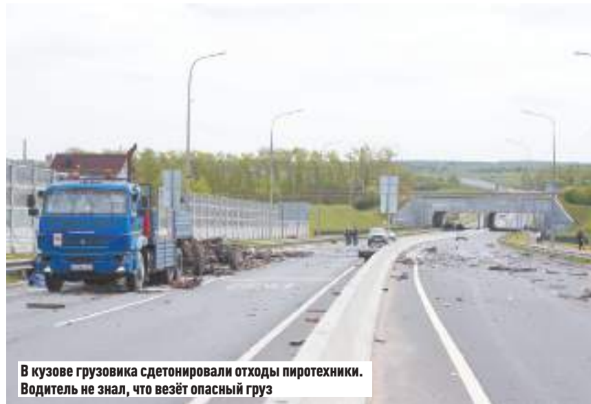
В кузове грузовика сдетонировали отходы пиротехники. Водитель не знал, что везёт опасный груз

В результате сани угодили под него, а водитель на большой скорости ударился головой о раму и получил травму, несовместимую с жизнью. Прибывшим на место ЧП сотрудникам экстренных служб оставалось только констатировать смерть.