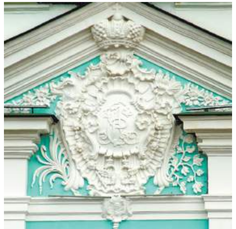
Картуш с императорской монограммой на первом ярусе колокольни.

Вероятно, тогда же под картушами в филленчатых рамах появились