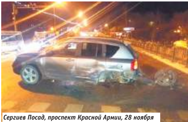
Сергиев Посад, проспект Красной Армии, 28 ноября

Полиция задержала 44-летнего жителя Краснозаводска. Возбуждено уголовное дело по статье «Кража».