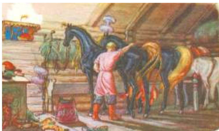
Большинство принятых в лаврский штат крестьян владели какой-либо профессией — например, конюхов (на илл.: «В царской конюшне», рис. Вл. Милашевского).

Под управлением Лавры осталась лишь сотня так называемых «штатных» служителей — крестьян экономического ведомства, добровольно приславшихся к обители для обслуживания её хозяйства. Жалованье им отпускалось из Коллегии экономии согласно утверждённому штату — отсюда и название этой новой группы населения. Штатные служители и члены их семей подчинялись монастырскому священноначалию. В случае выхода или исключения из штата следовало их автоматическое возвращение в число крестьян государственной Коллегии экономии. Большинство принятых в лаврский штат крестьян владели какой-либо профессией — например, конюхов (на илл.: «В царской конюшне», рис. Вл. Милашевского).