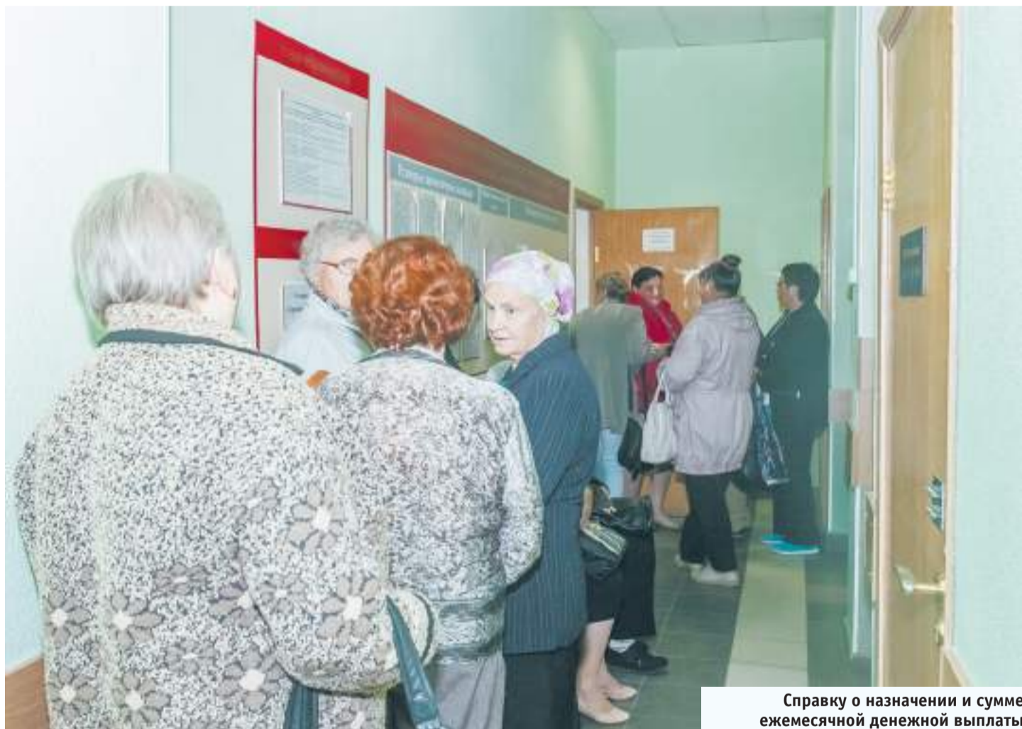
Справку о назначении и сумме ежемесячной денежной выплаты федеральные льготники получают в Управлении пенсионного фонда

— Ребёнок учится в колледже ВАКЗО. Работаю я одна, муж — инвалид 3 группы, пенсионер, не работает. Положена ли ребёнку социальная стипендия?