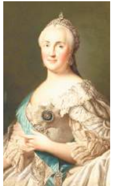
Реформу по изъятию церковных владений провела Екатерина II.

К этому времени в Троице-Сергиевой лавре близились к завершению работы на колокольне, начатые четверть века тому назад. Собственно говоря, колокольня в три яруса к 1764 году уже могла быть завершена, но московский архитектор Дмитрий Ухтомский ещё одиннадцатью годами ранее предложил увеличить её высоту на два яруса и завершить постройку не обычным куполом, а короной «весьма хитрой фигуры». Императрица Елизавета Петровна утвердила проект, и работы продолжались.