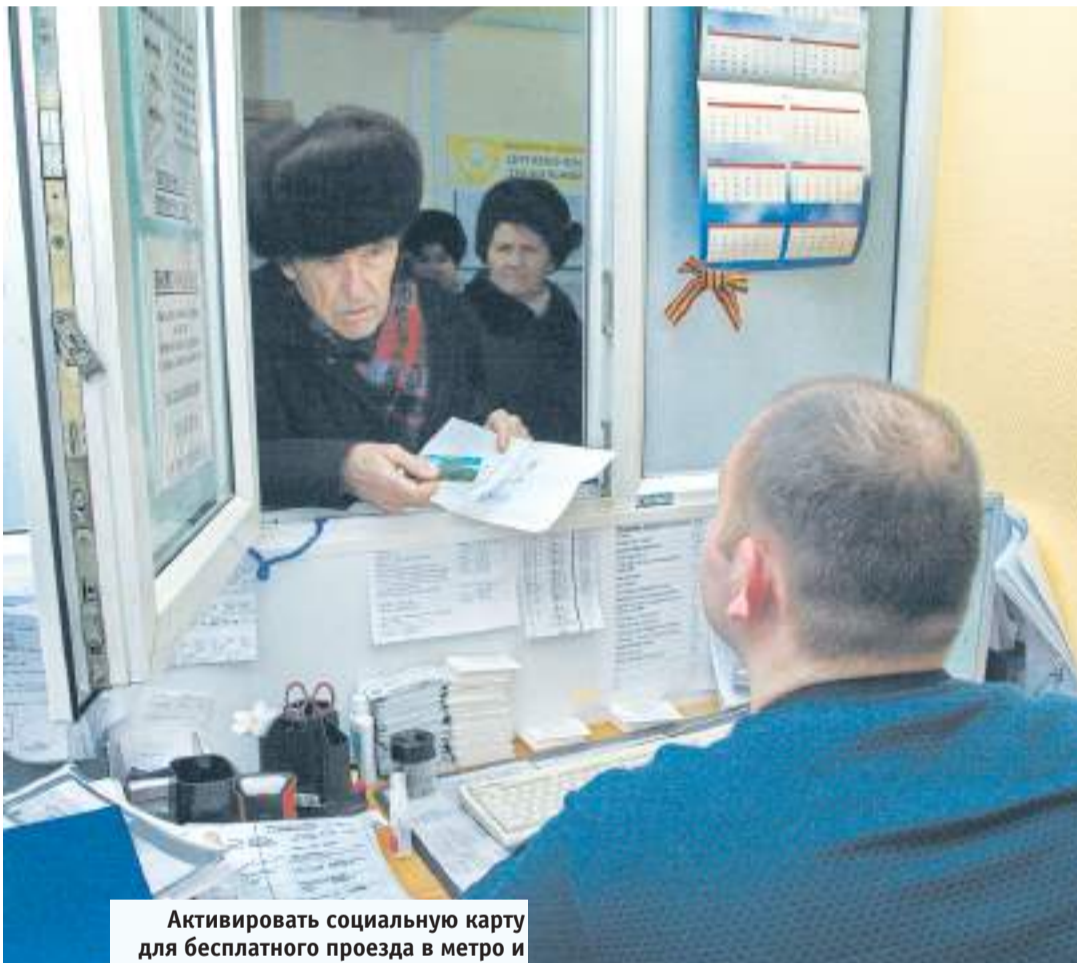
Активировать социальную карту для бесплатного проезда в метро и наземном транспорте города Москвы можно в Управлении социальной защиты населения или в МФЦ