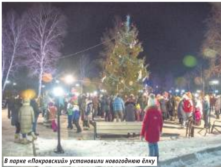
В парке «Покровский» установили новогоднюю ёлку

■ в номинации «Новогодние краски» — детский сад № 62; ■ в номинации «Ёлочный серпантин» и «Счастливый сундучок» — коллектив хотьковской школы-интерната; ■ в номинации «Морское волшебство» — коллектив школы искусств им. Е. Д. Поленовой. С 28 декабря в 16.00 в парке «Покровский» можно будет кататься на коньках.