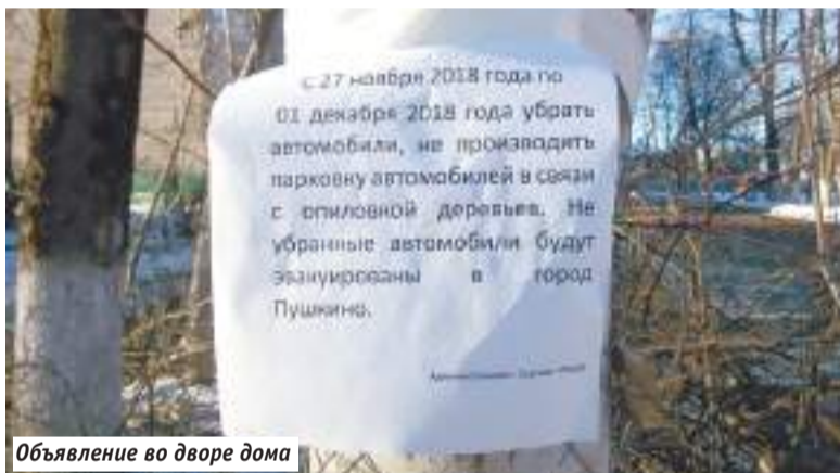
Объявление во дворе дома

Инцидент произошёл днём 30 ноября на улице Воробьевской в Сергиевом Посаде. Возле дома