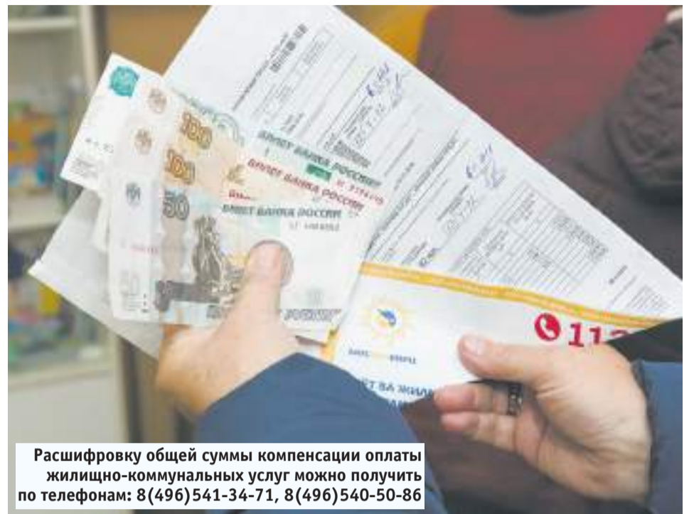
Расшифровку общей суммы компенсации оплаты жилищно-коммунальных услуг можно получить по телефонам: 8(496)541-34-71, 8(496)540-50-86

Однако законом Московской области «О государственной социальной помощи и экстренной социальной помощи в Московской области» предусмотрено оказание экстренной социальной помощи семьям (одиноко проживающим гражданам), попавшим в трудную жизненную ситуацию, среднедушевой доход которых, определённый в целях оказания экстренной социальной помощи, ниже величины прожиточного минимума, установленного в Московской области на душу населения (в настоящее время он составляет 12 тысяч 229 рублей). Следовательно, если среднедушевой доход в вашей семье ниже указанной суммы, вы можете обратиться за помощью.