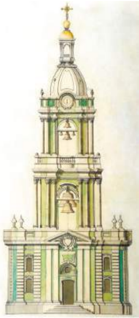
Лаврская колокольня строилась с 1741 по 1770 гг. Изначально предполагалось, что в ней будет три яруса.