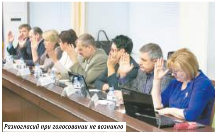
Разногласий при голосовании не возникло

Поддержку парламентариев нашло соглашение о передаче Контрольно-счётной комиссии района полномочий Контрольно-счётного органа Сергиева Посада по осуществлению внешнего