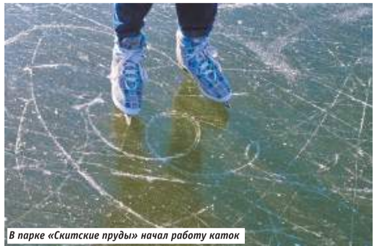
В парке «Скитские пруды» начал работу каток