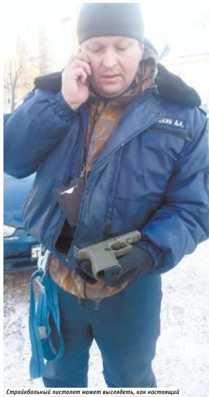
Страйкбольный пистолет может выглядеть, как настоящий

Полный текст поступившего в редакцию письма жителей будет доступен на сайте нашей газеты vperedsp.ru.