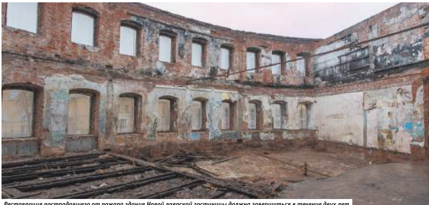
Реставрация пострадавшего от пожара здания Новой лаврской гостиницы должна завершиться в течение двух лет