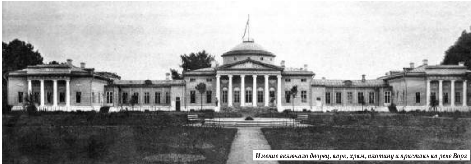
Имение включало дворец, парк, храм, плотину и пристань на реке Воря

В четырёх километрах от Хотькова на берегу Вори стоит село Ахтырка — в старину Дудкино. В XIX веке, когда Ахтыркой владели князья Трубецкие, в имении был выстроен большой усадебный комплекс, где в гостях бывали многие знаменитые русские музыканты и художники. Достаточно сказать, что эскизы к знаменитой «Алёнушке» Виктора Васнецова были написаны именно здесь.