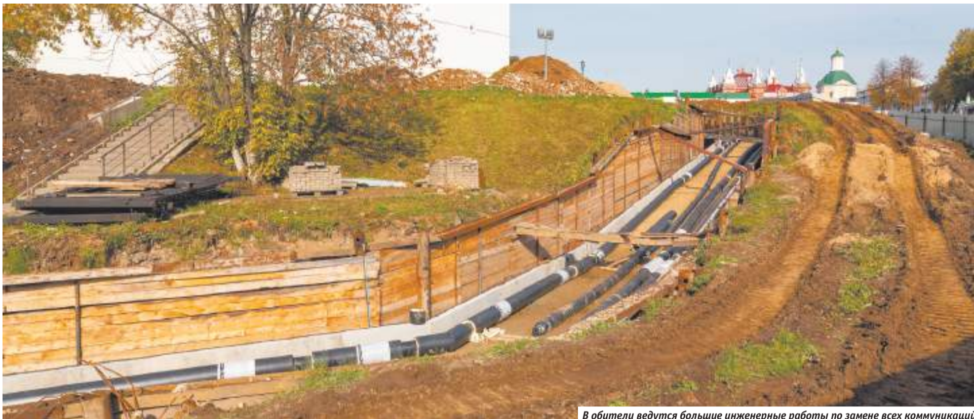
В обители ведутся большие инженерные работы по замене всех коммуникаций

— Вам наверняка не нравится эта формулировка — «православный Ватикан», но идея перестройки города существует. Планы есть разные, какое ваше видение?