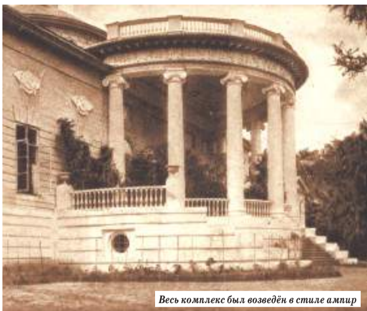
Весь комплекс был возведён в стиле ампир

В начале XX века, после установления советской власти, деревянный дворец сгорел дотла. До недавнего времени в среде краеведов не было единого мнения о дате указанного события. Теперь в этом вопросе можно поставить точку: в Центральном государственном архиве Московской области отыскан милицейский рапорт с описанием пожара.