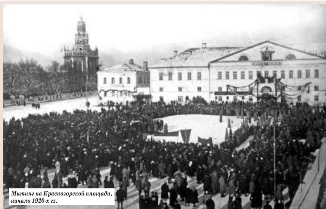
Митинг на Красногорской площади, начало 1920-х гг.

◆ 20 сентября (2 октября) 1899 года (120 лет назад) Собрание уполномоченных Сергиевского посада постановило обложить налогом хозяев собак в размере 1 рубль в год с собаки. Налог был введён по рекомендации губернского земства как одна из мер борьбы с чрезмерным распространением бродячих собак и эпидемией бешенства. В качестве вопиющего примера в рекомендации земства приводился случай, когда собака, заразившись бешенством в Тверской губернии, покусала 30 человек в двух уездах губернии Московской.