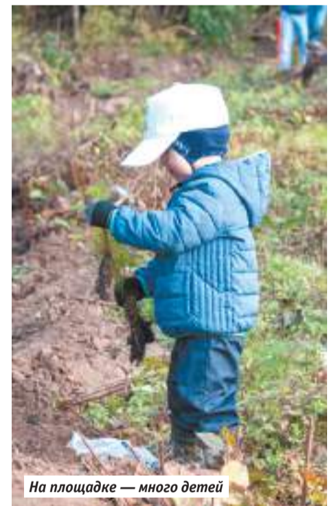
На площадке — много детей