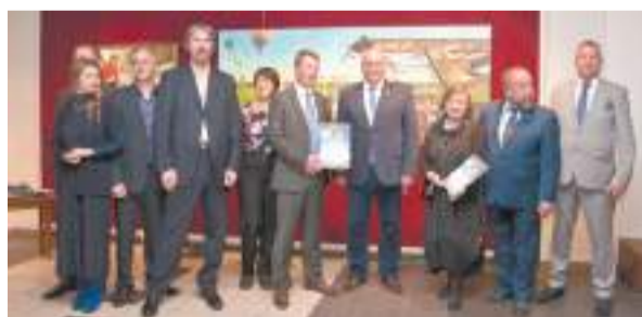
Вся область на холсте и в красках — художники Московской области участвуют в выставке, посвящённой 90-летию региона.