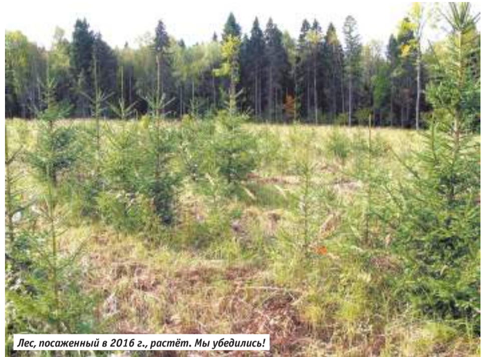
Лес, посаженный в 2016 г., растёт. Мы убедились!

Быстро всё посадив, мы успели на мастер-класс лесной кулинарии на горящем пне. За готовящейся яичницей вместе с нами заворожено наблюдал очень разнообразный состав приехавших. Вот, например, самое первое дерево на центральной площадке доверили сажать маленьким нович-