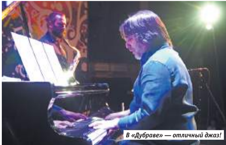
В «Дубраве» — отличный джаз!