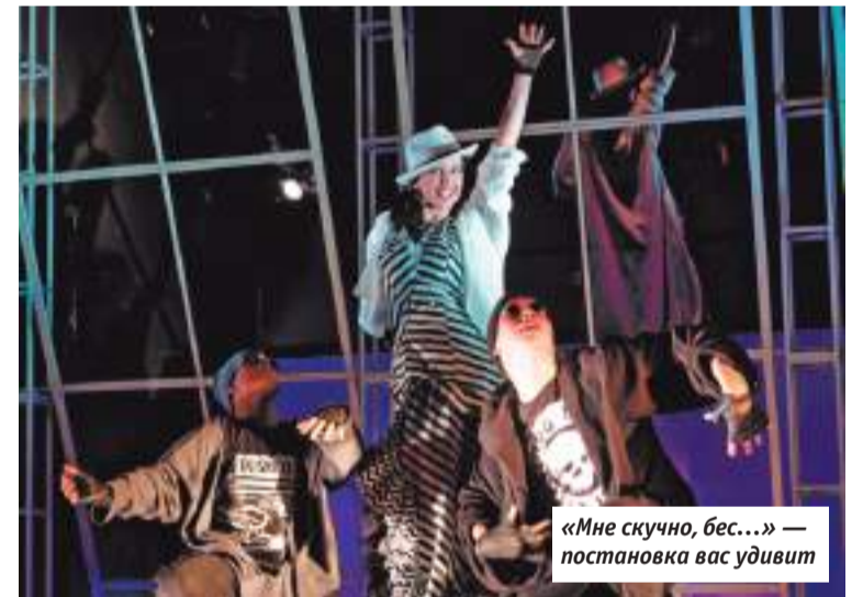
«Мне скучно, бес...» — постановка вас удивит

И ещё одна приятная новость, хотя и напрямую с спектаклями не связанная. Театр открыл обновлённое фойе — налево от главного входа — которое стало более уютным, и где, как показали первые дни работы, зрители остаются не только до спектакля, но и после — чтобы за чашкой кофе, на фоне приглушённой музыки обсудить увиденное.