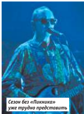
Сезон без «Пикника» уже трудно представить

Ирландское танцевальное шоу Celtica и Венский филармонический «Штраус-оркестр» — приятный способ попутешествовать по Европе ценой проезда на такси до ДК и обратно. И пусть фраза с афиши «шоу в лучших традициях Ирландии» намекает, что это не артисты Изумрудного острова вовсе,