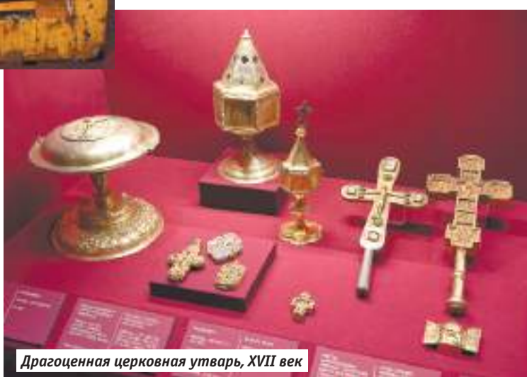
Драгоценная церковная утварь, XVII век

ском переулке, и готовы делиться своими наработками, как должен развиваться современный музей, повышать квалификацию сотрудников, которые работают в музеях Подмосковья», — подчеркнула Зельфира Трегулова.