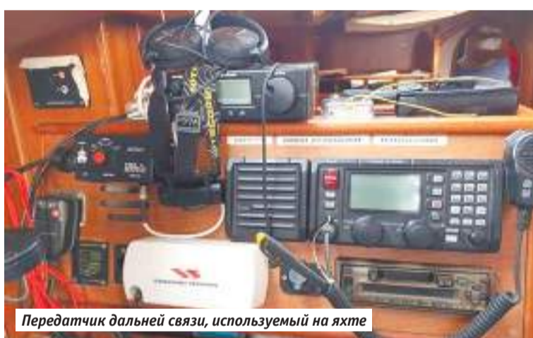
Передатчик дальней связи, используемый на яхте

Коротковолновый сигнал поначалу хрипит, кажется неразборчивым, но проходит несколько минут, и то ли это твоё ухо подстраивается, то ли трансивер (приёмопередатчик) находит нужный режим — и шум складывается в слова человека