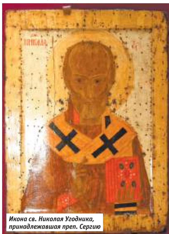
Икона св. Николая Угодника, принадлежавшая преп. Сергию