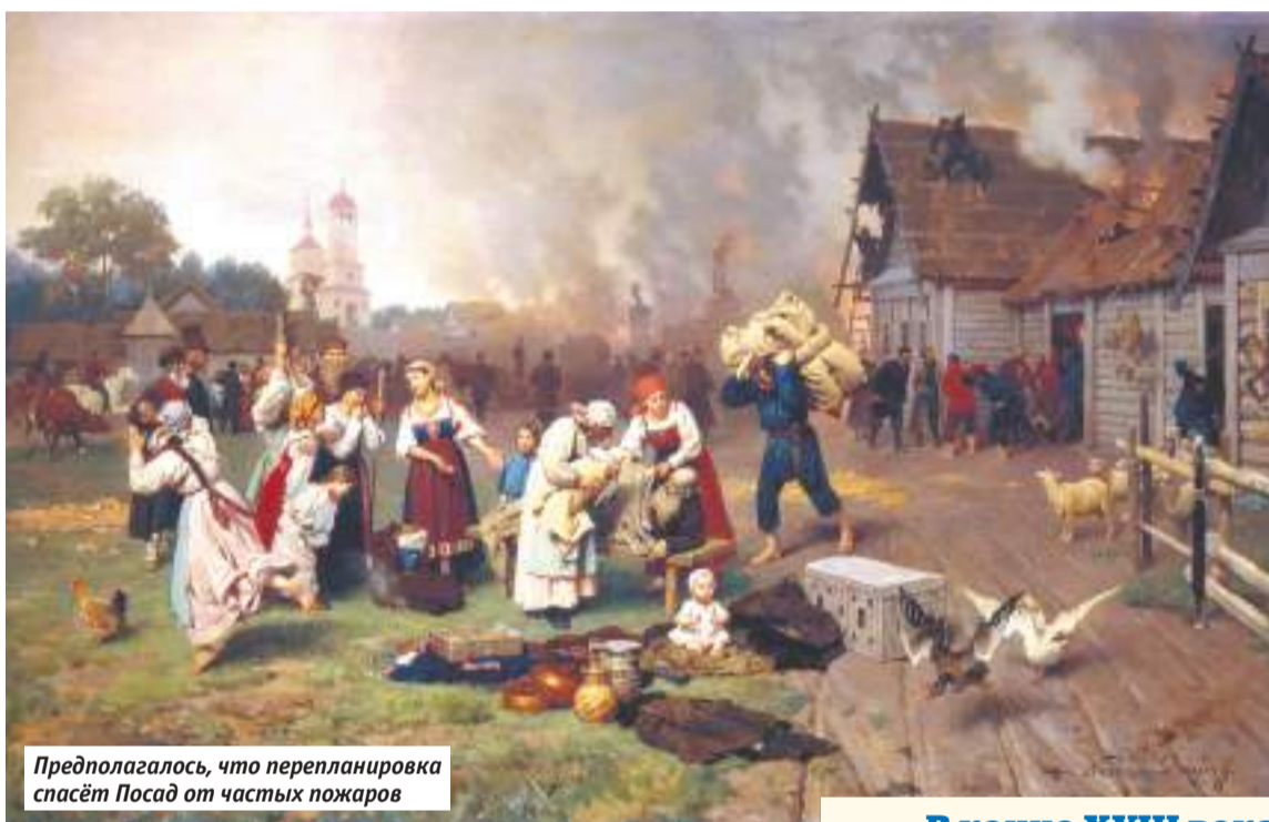
Предполагалось, что перепланировка спасёт Посад от частых пожаров

В 1791 году в Сергиевском посаде появился первый «генплан»