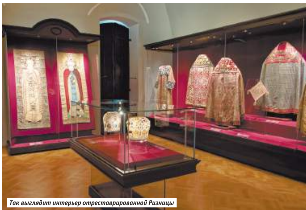
Так выглядит интерьер отреставрированной Ризницы