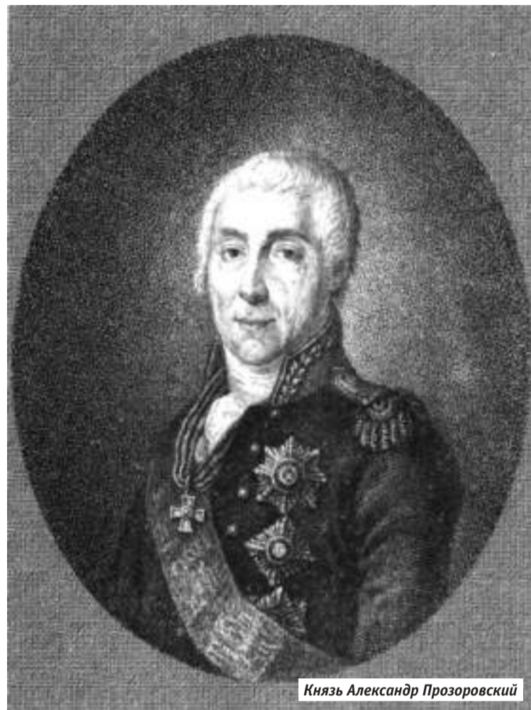
Князь Александр Прозоровский