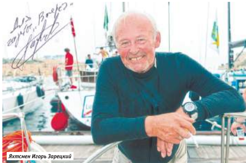
Яхтсмен Игорь Зарецкий

У СЕРГИЕВА ПОСАДА НЕТ ВЫХОДА К МОРЮ, НО ЕСТЬ ВЫХОД В ОКЕАН. ВЫХОД ПО РАДИОВОЛНАМ. НЕСКОЛЬКО МЕСЯЦЕВ НАШИ РАДИОЛЮБИТЕЛИ СОПРОВОЖДАЛИ В ЭФИРЕ ЯХТУ РОССИЙСКОГО СПОРТСМЕНА ИГОРЯ ЗАРЕЦКОГО, КОТОРЫЙ В ОДИНОЧКУ ПЕРЕСЕКАЛ АТЛАНТИКУ И ИНДИЙСКИЙ ОКЕАН В ГОНКЕ GOLDEN GLOBE RACE. КАЖДЫЙ ДЕНЬ ОНИ, КАК ИХ КОЛЛЕГИ ИЗ ДРУГИХ ГОРОДОВ И СТРАН, БЫЛИ СВЯЗНЫМИ МОРЯКОВ.