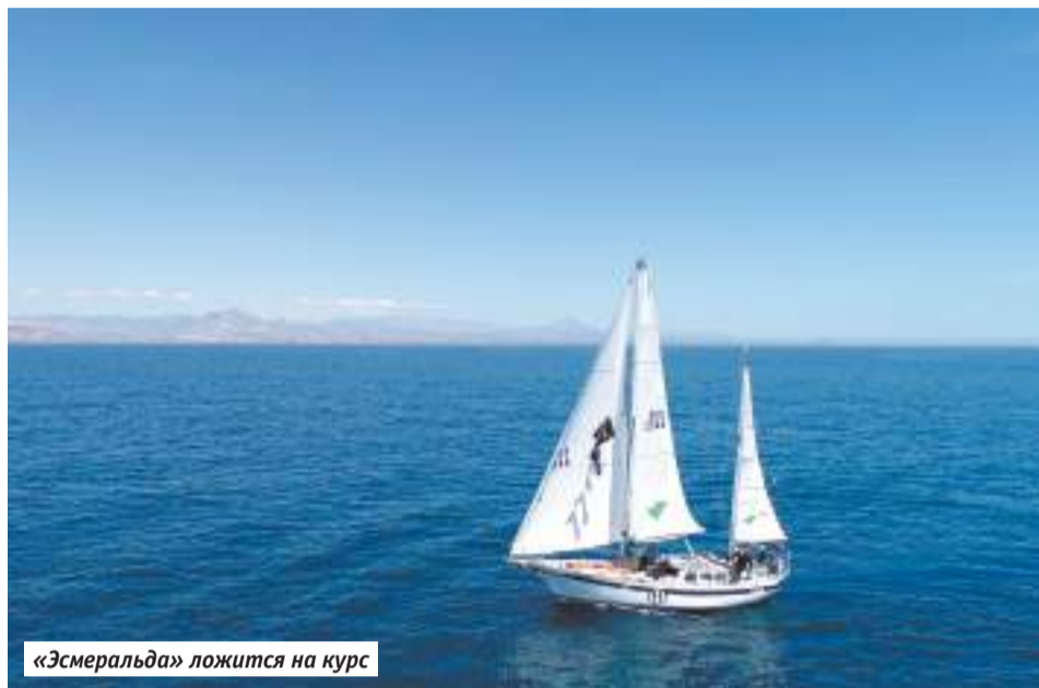
«Эсмеральда» ложится на курс

Сергиевопосадские радиолюбители держали связь с яхтами в кругосветке Golden Globe Race