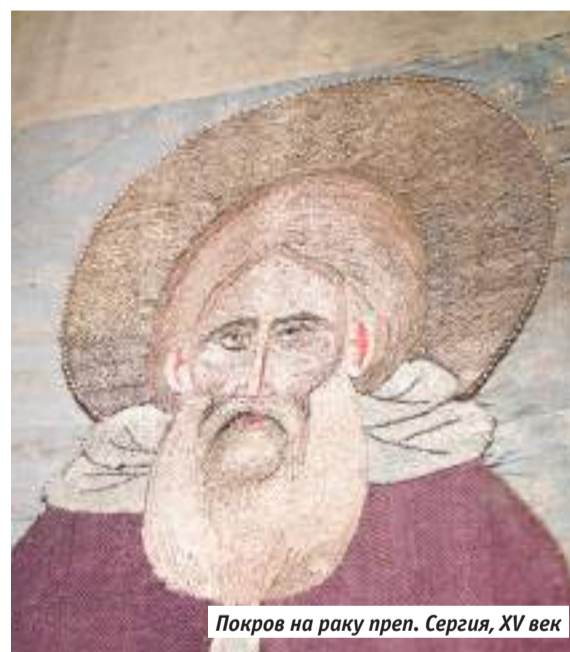
Покров на раку преп. Сергия, XV век