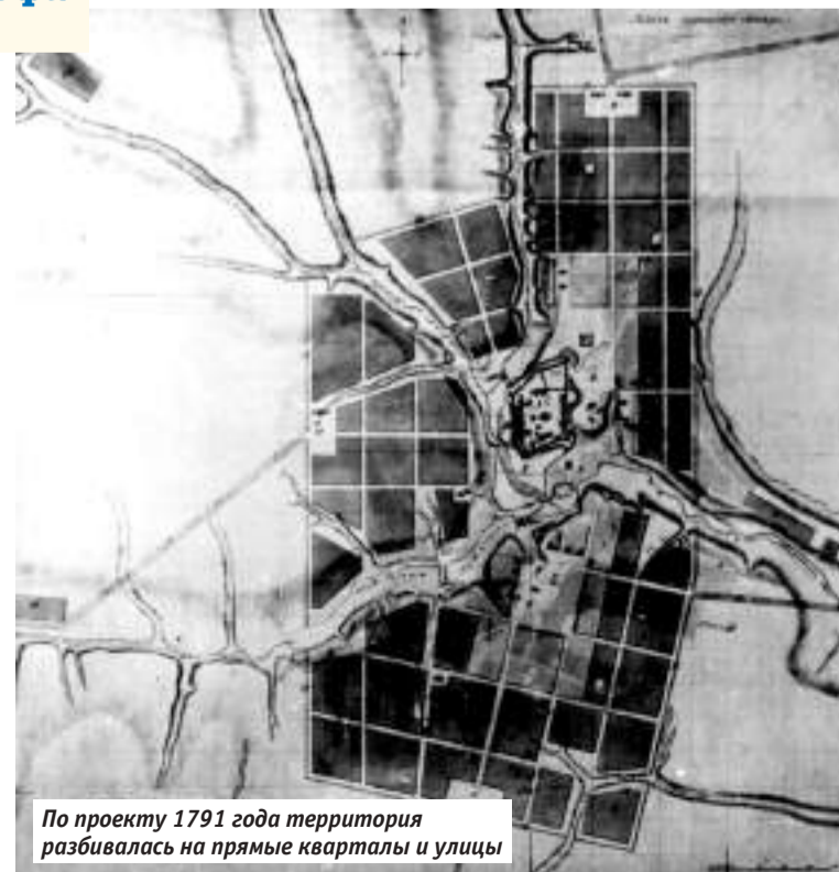
По проекту 1791 года территория разбивалась на прямые кварталы и улицы