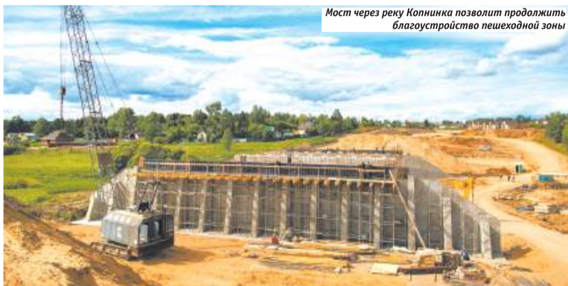
Мост через реку Копнинка позволит продолжить благоустройство пешеходной зоны