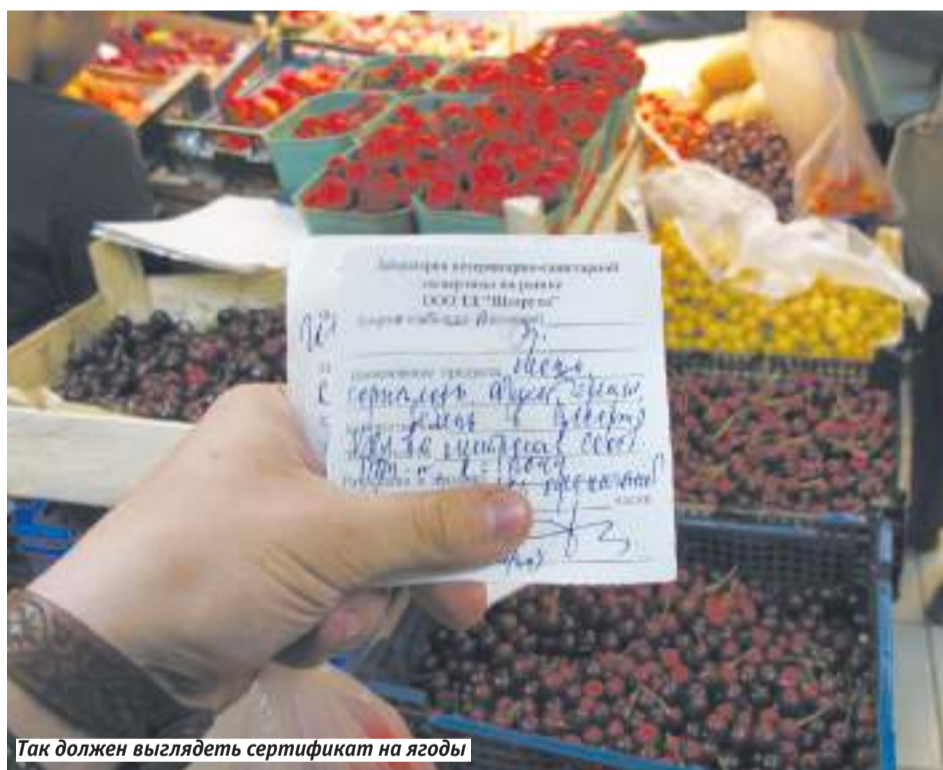
Так должен выглядеть сертификат на ягоды

К ОНЕЦ ИЮНЯ В НАШИХ ШИРОТАХ ВРЕМЯ СОЗРЕВАНИЯ ЯГОД. КЛУБНИКА, ЗЕМЛЯНИКА, ВОТ-ВОТ ПОСПЕЕТ ЧЕРНИКА... НО ПРЕЖДЕ, ЧЕМ СОБРАТЬ БОГАТЫЙ УРОЖАЙ, НЕОБХОДИМО МНОГО ТРУДИТЬСЯ. ИНОГДА НЕ ОДИН ГОД. А ЧТО ДЕЛАТЬ, ЕСЛИ НЕТ ЖЕЛАНИЯ ИЛИ ПРИУСАДЕБНОГО УЧАСТКА? ВЫХОД ОДИН — ИДИ НА РЫНОК.