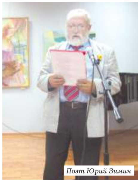
Поэт Юрий Зимин

Я сидела в своём телефоне, Вдруг вижу: идёт мужчина. Он выделялся на фоне Весь сморщенный, старый, в морщинах, Он еле стоял на ногах, Опирался на трость и шатался, Слёзы были у него на глазах, Но он это скрыть пытался. Я, взглянув на него, растерялась, Не знала: почему же он плачет, Подойти к нему забоялась, Но всё же поступила иначе. Я подбежала, спросила: «Почему на щеках его слёзы?» И он, помолчав, ответил: Что виной тому страшные грёзы. Он мечтал о том, как снова, Оказавшись обычным мальчишкой, Он окажется дома С букетом цветов подмышкой, Подарит их своей маме, Обнимет крепко, руку держа. Но только не бывать тому больше: Всё изменила война. Вокруг горели дома. Земля огнём из крови пылала. «Старший брат мой поднял сестру, Побежал в дом, чтобы скрыться, Но не учёл вещь одну: