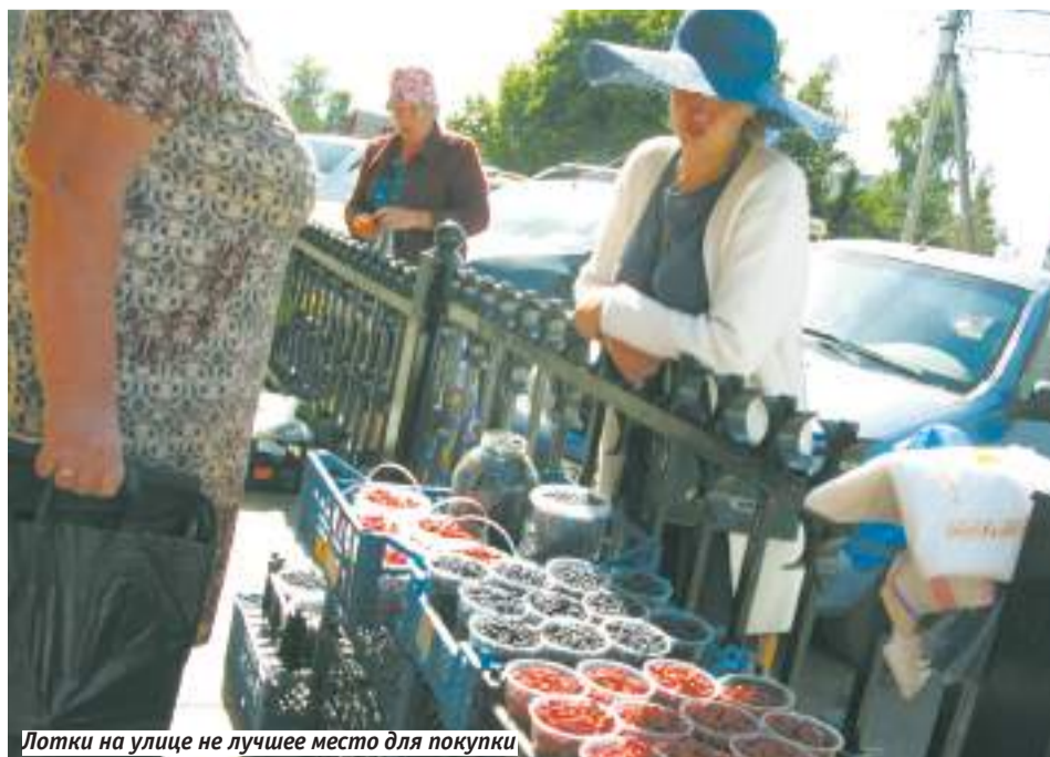
Лотки на улице не лучшее место для покупки