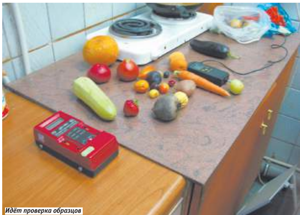
Идёт проверка образцов