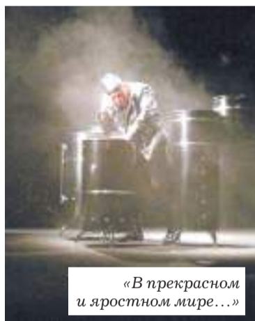
«В прекрасном и яростном мире...»

«Трудно назвать постановку «В прекрасном и яростном мире...» по рассказу Андрея Платонова о судьбе машиниста и гролом свалившегося на него мира моноспектаклем, хоть на сцене всего один, к слову, прекрасно работающий актёр. Особое место в действии занимает «поезд», который сыграла барабанная установка — она здесь