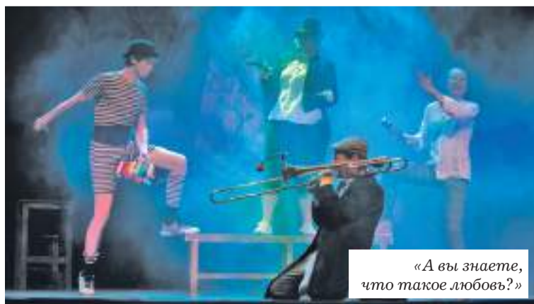
«А вы знаете, что такое любовь?»

Приз за музыкальное решение — спектакль «А вы знаете,