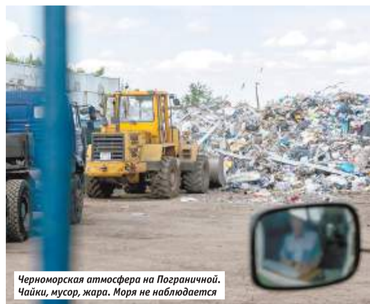
Черноморская атмосфера на Пограничной. Чайки, мусор, жара. Моря не наблюдается

Жителям улиц Новоярославская, Цветочная и Островского это не нравится. А кому-то метан и сероводород мешают делать бизнес — автомойка на Пограничной лишается элитных клиентов, которые, по словам работников, учуяв запах разложения, просто уезжают и не