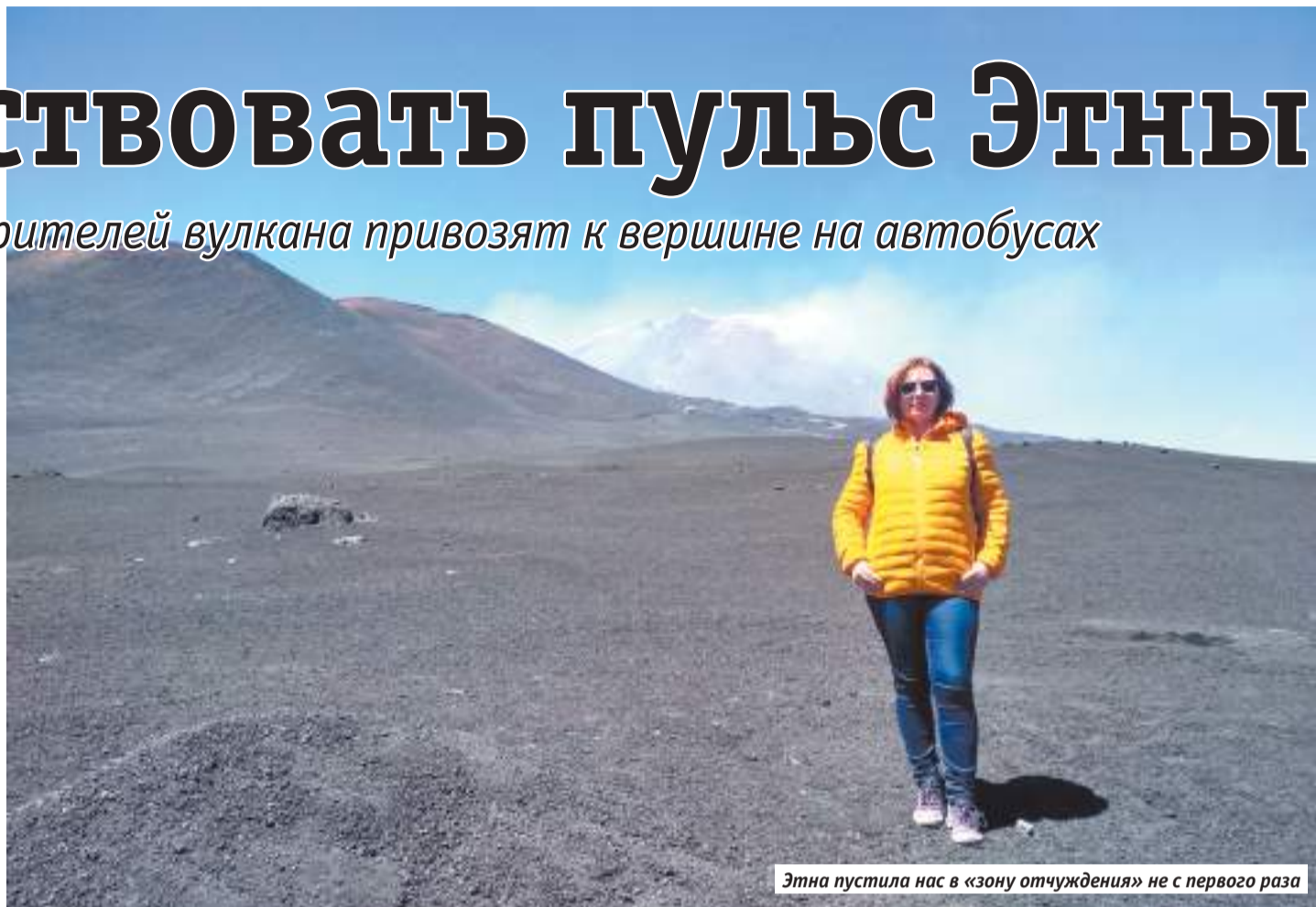
Этна пустила нас в «зону отчуждения» не с первого раза

Любые другие жители давно бы ушли от такого хлопотного соседства, но только не сицилийцы. Они очень комфортно чувствуют себя рядом с вулканом, который даёт им отменный урожай, отличный материал для мо-