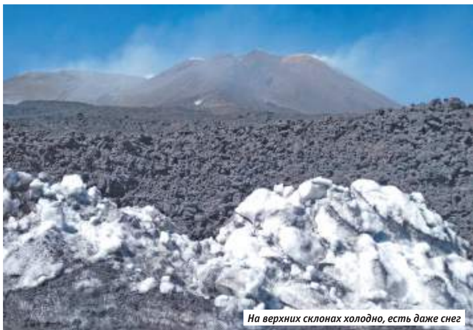
На верхних склонах холодно, есть даже снег

По вулкану ходила Оксана Перевозникова