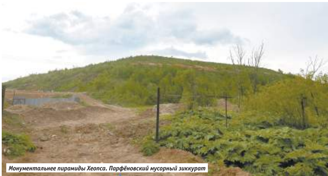
Монументальнее пирамиды Хеопса. Парфёновский мусорный зиккурат