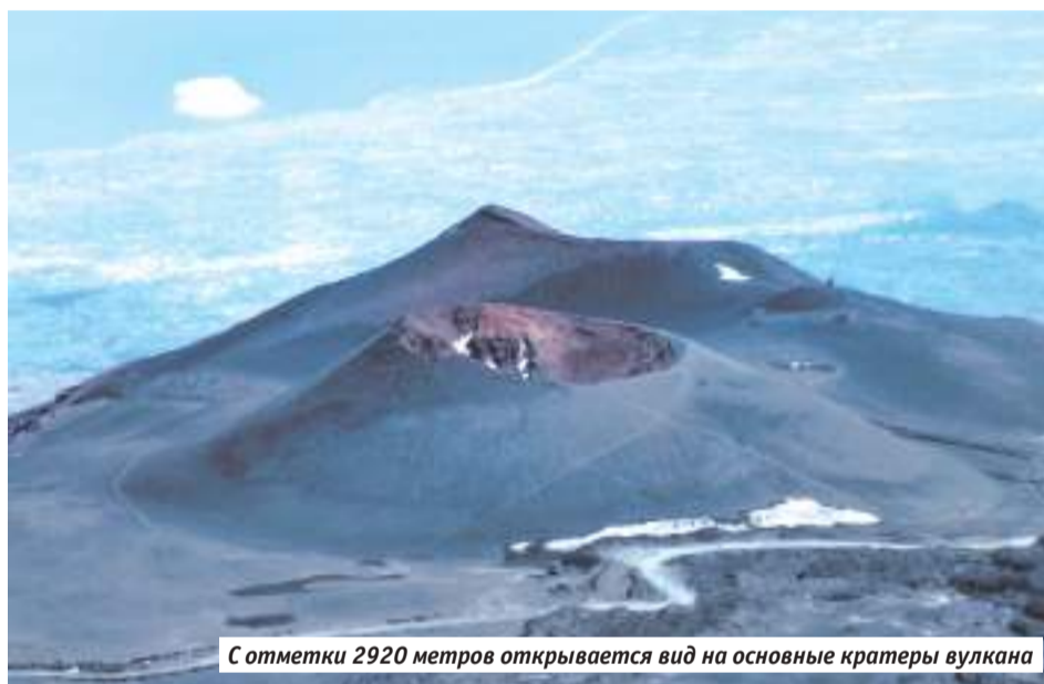
С отметки 2920 метров открывается вид на основные кратеры вулкана

стовых и домов, а также суперприбыльную статью доходов от туризма. Кстати, символ Катании — чёрный слон, который венчает скульптурную композицию фонтана на главной площади рядом с Кафедральным собором святой Агаты, также сделан из лавы.