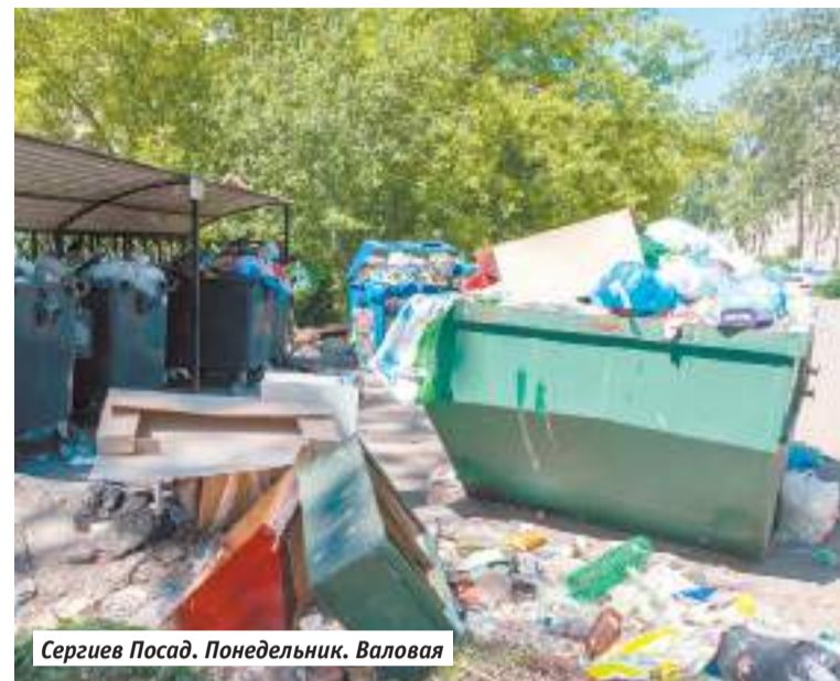
Сергиев Посад. Понедельник. Валовая