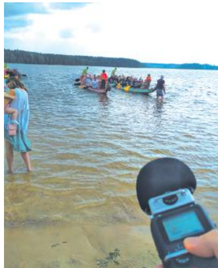
Один из первых звуков, плеск под вёслами и удары барабанов

С ергиевopосадский клуб полевой звукозаписи oontz.ru побывал в Литве, где поучаствовал в создании карты звуков города Висагинас*, первой подобной в стране. И вот проект Висагинского центра культуры заработал — результат можно увидеть и, главное, послушать по адресу vsgsounds.lt