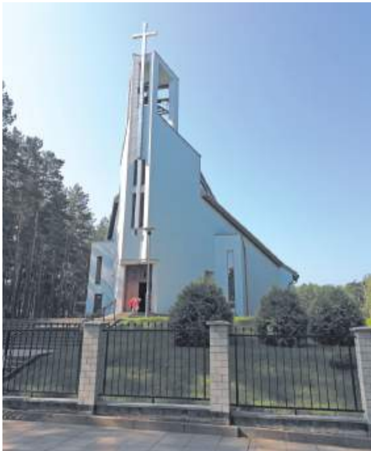
Служба на польском и на русском