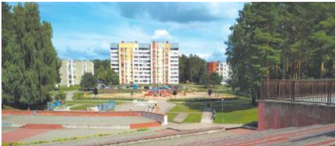
Амфитеатр — древняя форма, отлично вписавшаяся в современную городскую среду

СЕРГИЕВОПОСАДЦЫ УЧАСТВОВАЛИ В СОЗДАНИИ ПЕРВОГО ЛИТОВСКОГО АРХИВА ГОРОДСКИХ ЗВУКОВ