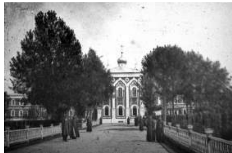
Гефсиманский скит. Начало XX века

Одно его произведение по сей день вызывает ажиотаж. Это поэма в прозе «Девятая ель» 1929 года, опубликованная и неоконченная — писатель, как это с