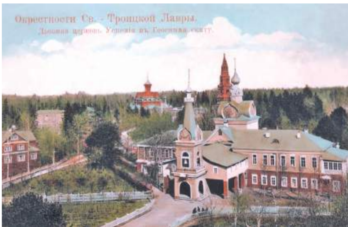
Гефсиманский скит. Конец XIX века

Когда Пушкин узнал об ответе митрополита Филарета, он ответил в свойственной ему манере: «Стихи христианина, русского епископа в ответ на скептические куплеты! — это, право, большая удача».