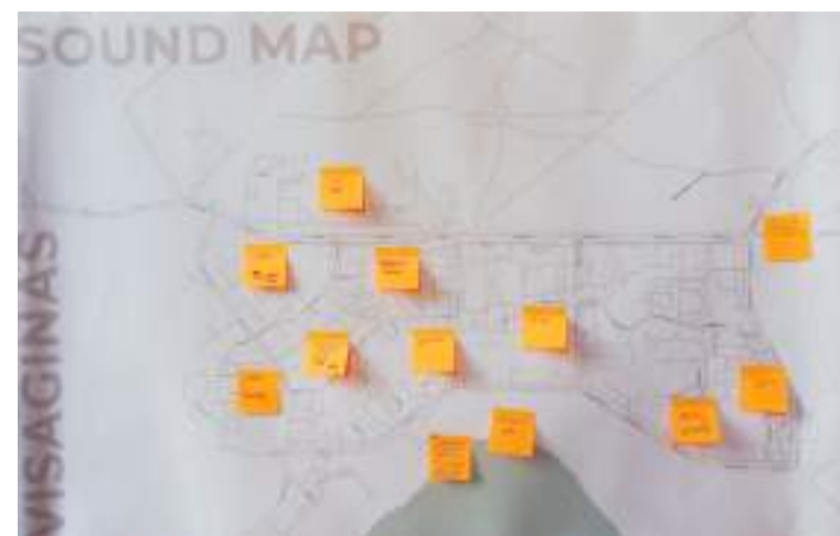
Наклейками отмечаем самые яркие звуки на карте города

В местном кинотеатре крутят наше кино, на Дне города выступают «Братья Грим», через границу — латвийский Даугавпилс, откуда приезжают тамошние музыканты, и на фестивале во дворе местного пивного завода-ре-