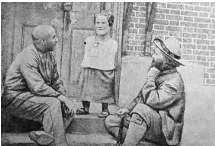
«Девятая ель», её автор и герои

...Узнаваемы «монастырские наследники» — детские дома в Черниговском Гефсиманском скиту — и в произведениях Анатолия Приставкина «Три ковшика из Загорска» и «Ночевала тучка золотая». Непростой это район, Ферма, и, похоже, музы давно поселились в этих местах!