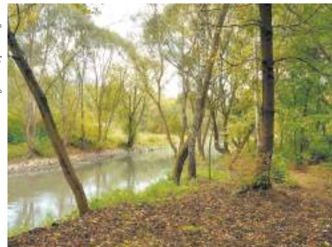
Если бы не река Яуза, мы не узнали бы поэта