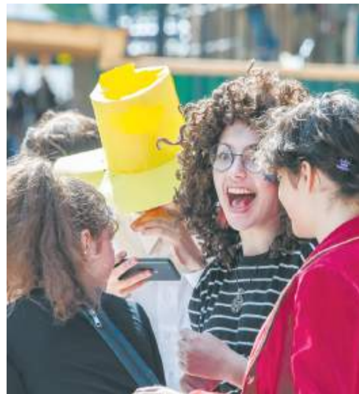
Таких фестивалей на улице Карла Маркса мы, вероятно, не увидим ещё год

Сергиевопосадское объединение «Трикотажка Fest» в начале года планировало серию ярких уличных праздников в центре города, но, похоже, и их придётся отложить до лучших времён.