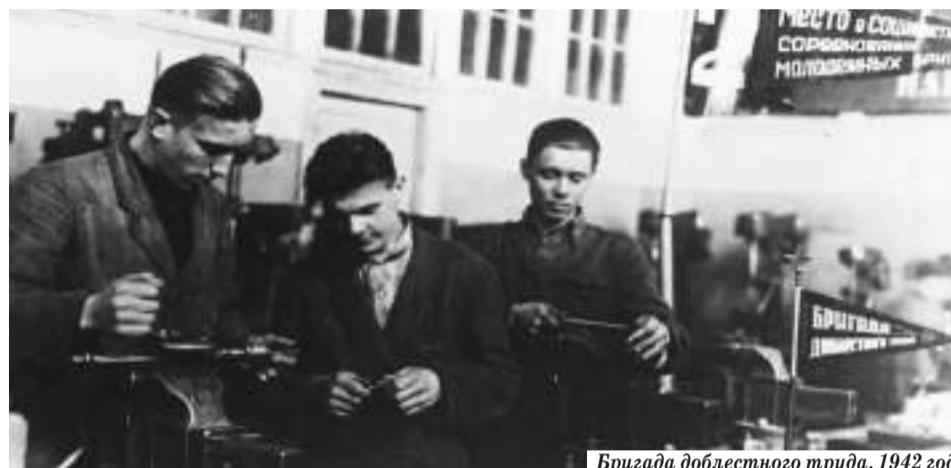
Бригада доблестного труда, 1942 год

В начале декабря 1941 года началась Московская битва: Красная Армия перешла в наступление под Яхромой, враг был отброшен от столицы. Непосредственная угроза захвата Загорска миновала. Наш город принимал раненых, выпускал военную продукцию, формировал и отправлял на фронт призывников и добровольцев, собирал деньги в Фонд обороны страны.