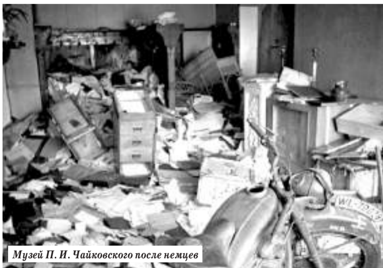
Музей П. И. Чайковского после немцев

С ледующие четыре полосы необычны. Это репринтное издание двух исторических, победных номеров газеты «Вперёд».