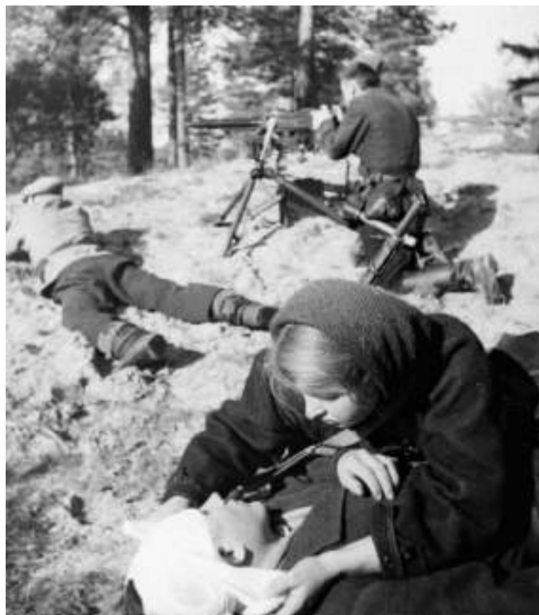
Бой партизан в Белоруссии, 1943 год.