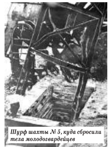
Шурф шахты № 5, куда сбросили тела молодогвардейцев