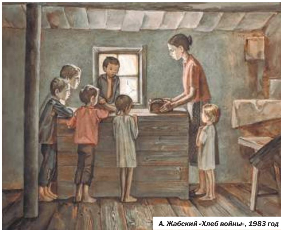
А. Жабский «Хлеб войны», 1983 год