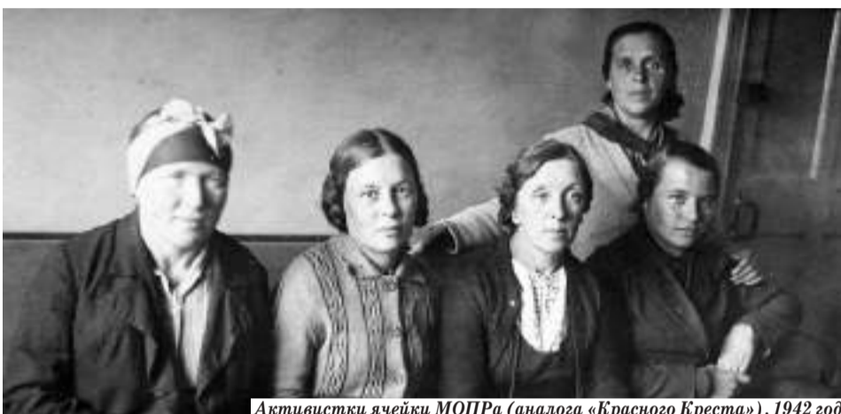
Активистки ячейки МОПРа (аналога «Красного Креста»), 1942 год