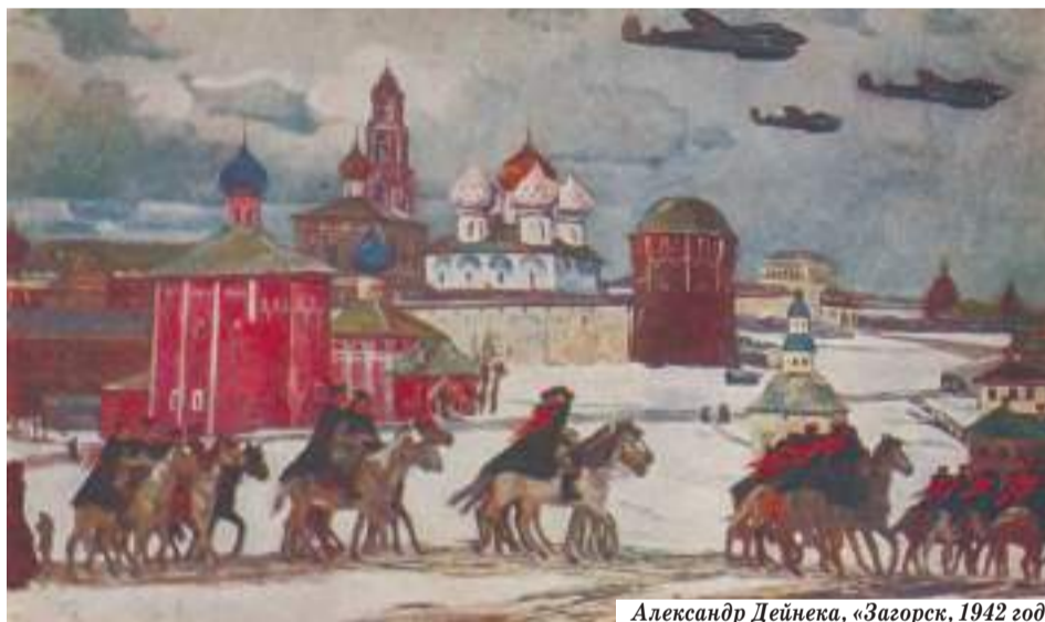
Александр Дейнека, «Загорск, 1942 год»

«В начале 1942 года в боях под Боровском во взвод, которым я командовал, прибыло новое оружие, в том числе и несколько штук ППШ. Так как бойцов было в несколько раз больше, чем автоматов, его выдавали, как награду. Получив новое оружие, солдаты разбрелись, чтобы его опробовать. Вдруг вижу, бежит ко мне боец и показывает выцарапанную на ложе надпись: «Привет из Загорска». С трудом сдержал слезы, ведь это была первая весточка из родного города».