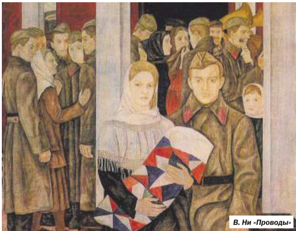
В. Ни «Проводы»

Мама работала, я ходила в детский сад. В те голодные годы это было большой поддержкой: там хоть скудно, но всё же кормили. Обычно на стол кроме супа из гнилой картошки или двух ложек гороховой каши, размазанной по дну миски, ставили тарелочку, на которой лежали пять маленьких кусочков хлеба. За столом нас было четверо. То ли по недомыслию воспитатели клали пятый кусочек, то ли как-то подкормить нас хотели, но этот пятый кусо-