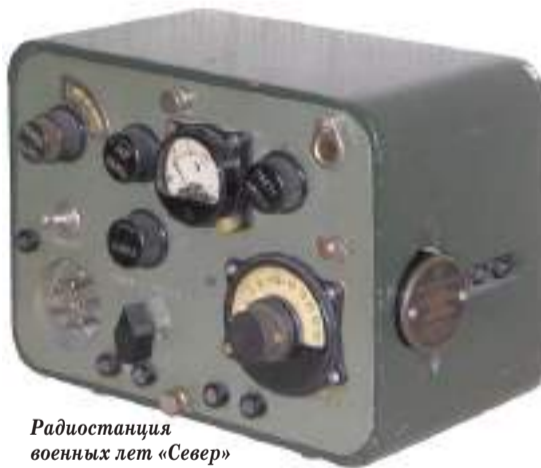
Радиостанция военных лет «Север»

затопанные немецкими сапогами ноты, разгромленные интерьеры, в личных комнатах композитора — грязная уборная... Он уже прошёл немало разорённых городов и сёл, но картина варварства в музее великого композитора потрясла его. Три недели фашисты хозяйничали здесь, перед отступлением заминировали дом, но взорвать его помешали наши войска.