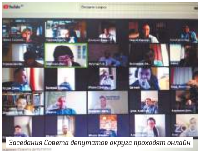
Заседания Совета депутатов округа проходят онлайн

По словам главы, в первую очередь будут отложены программы, связанные с газификацией, строительством котельных, частично от текущего и капитального ремонта дорог, а также комплексного ремонта дворовых территорий. В этом году