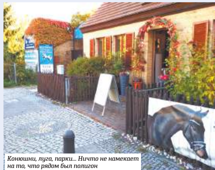
Конюшни, луга, парки... Ничто не намекает на то, что рядом был полигон