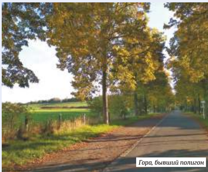
Гора, бывший полигон

Как Берлин избавился от своего «парфёновского полигона»