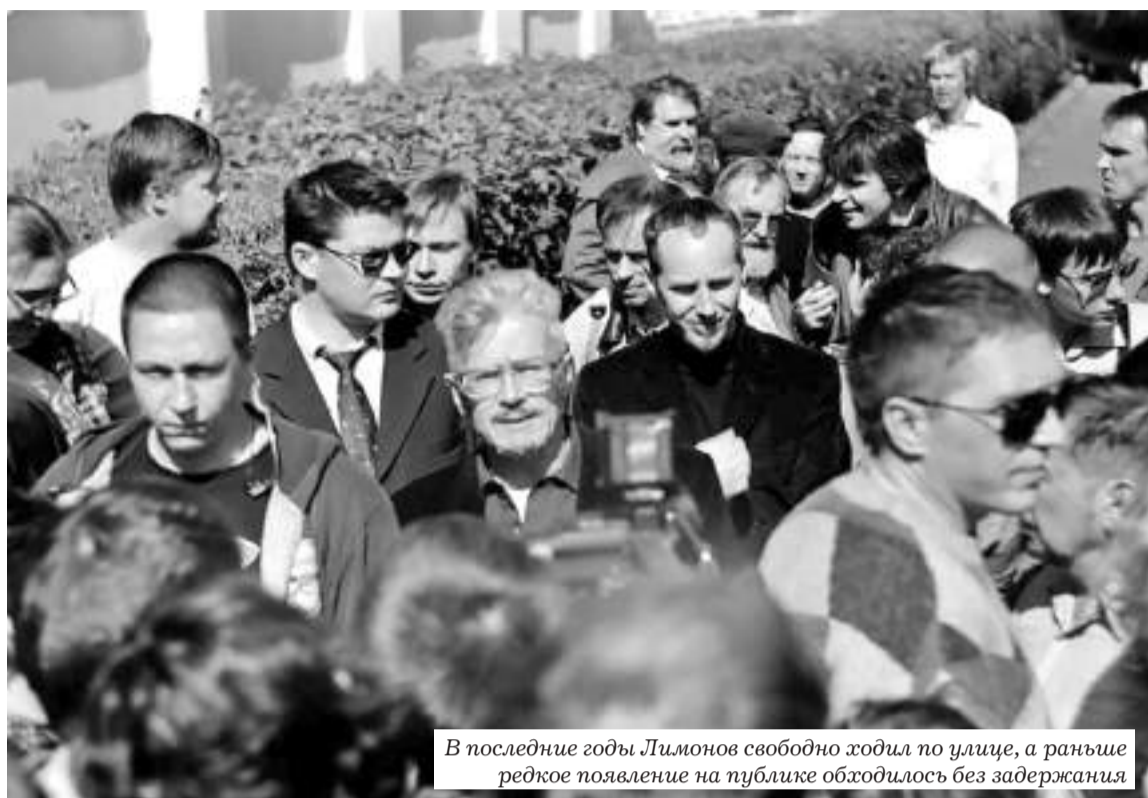
В последние годы Лимонов свободно ходил по улице, а раньше редкое появление на публике обходилось без задержания

фашистом, на антилимоновские акции возили из Тулы поглазеть на Москву «нашистов», политическая активность которых всячески поощрялась.