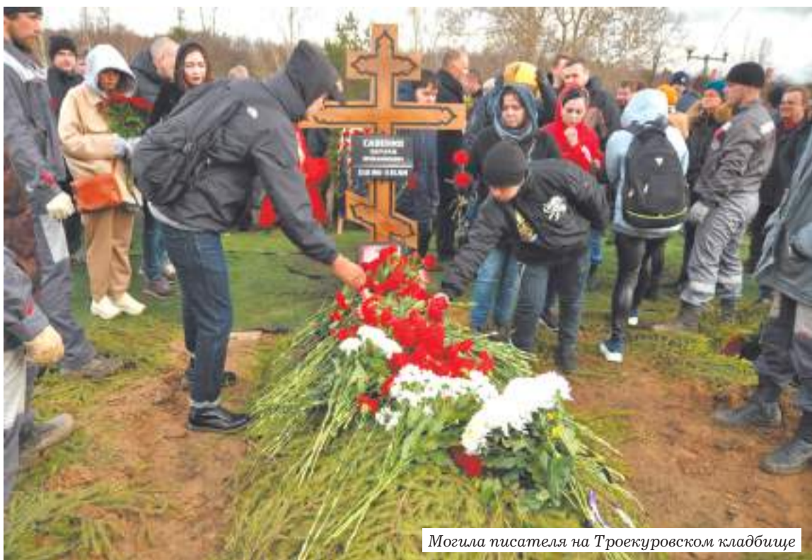
Могила писателя на Троекуровском кладбище

Был официально женат пять раз. В последнем официальном браке у Лимонова и актрисы Екатерины Волковой родились сын и дочь.