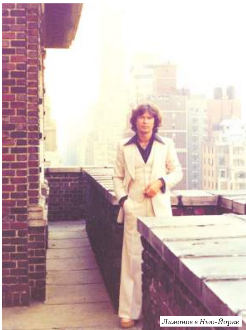
Лимонов в Нью-Йорке