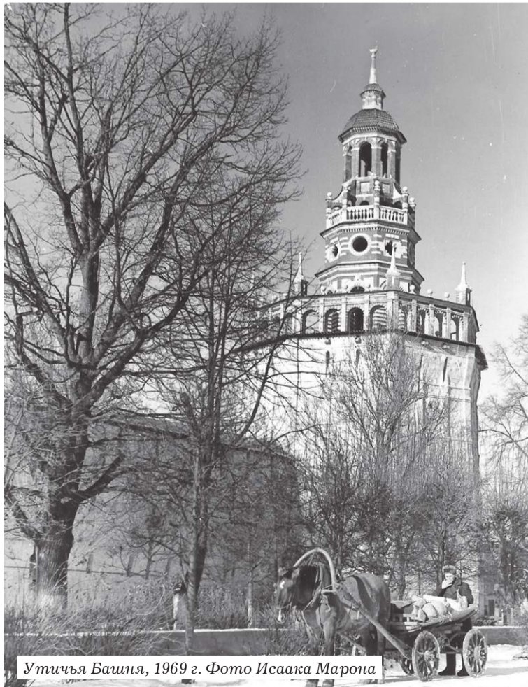
Утичьа Башня, 1969 г.

А потом снова Москва, Московский институт культуры. Преподаёт, занимается проблемами сохранения культурного наследия, изучает историю западноевропейской и русской книжности. Так мы и подошли к началу моего рассказа. В начале 1980-х Николай Александрович перебрался в Ленинград. Там и умер в 1983 году.