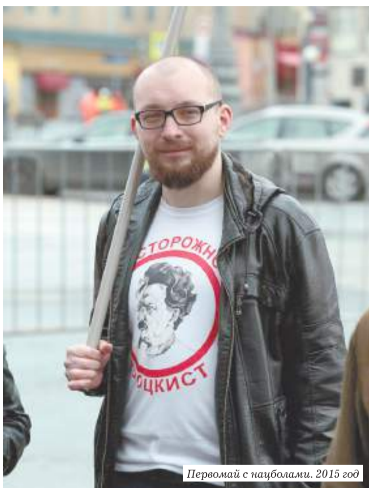
Первомай с нацболами. 2015 год

По большому счёту, реконструировать там нечего. Лимонов не был занудой и прагматиком. Он писал, опираясь на чувства, а жизнь его напоминала круто взнузданный перформанс с элементами драмы. Его и критиковали за «полное отсутствие фантазии». Мол, все свои книги от первой буквы до последней он прожил и истесал о собственную шкуру. Но и достоинства у такой литературы были неоспоримы: автор понимал, о чём он пишет, гораздо лучше, чем те, кто высоколобо